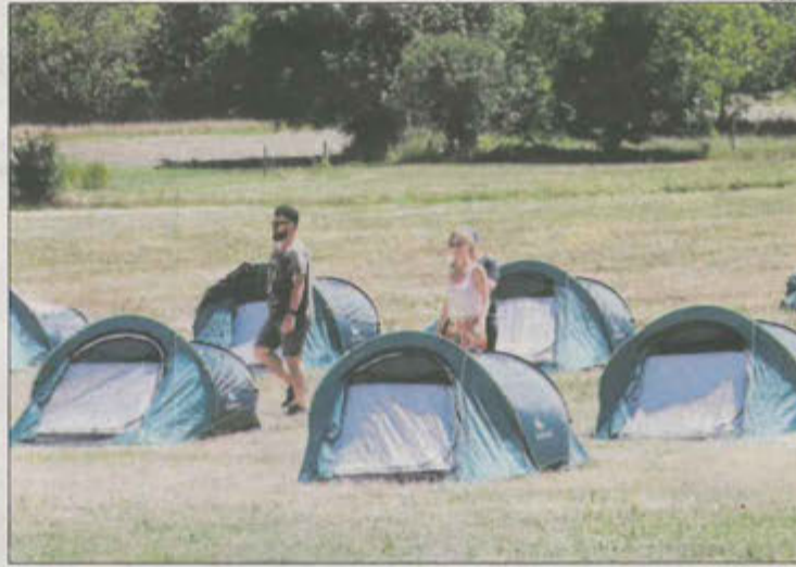
Les tendes de campanya que es van instal·lar a Escalarre el 2017.