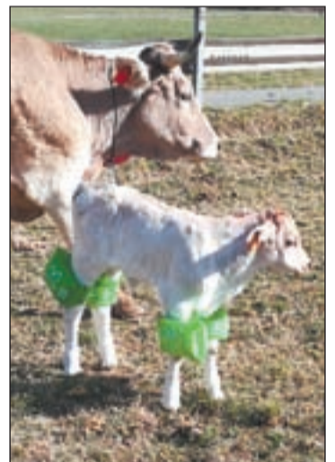
Una ironía sobre la inundabilidad