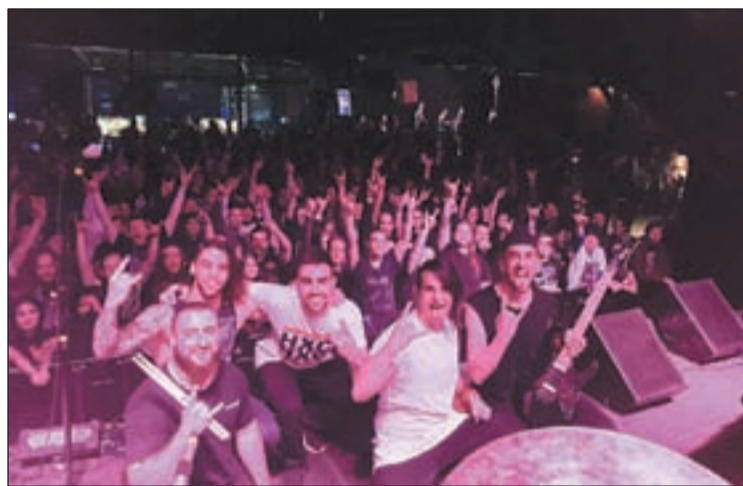
Los leridanos, en el Summit Music Hall de Denver

Esta gran aventura de carretera y manta comenzó el pasado día 18 en Detroit, donde actuaron en el Summit Music Hall ante más de mil espectadores. Hollow Cry dispone de 30 minutos como banda