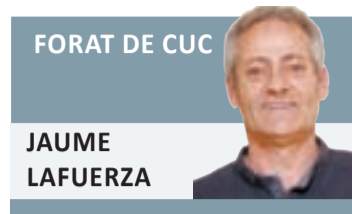
FORAT DE CUC

d'unes 55.000 persones amb l'impacte econòmic directe i d'imatge, a rendibilitzar a mig termini, que s'esvirà molt probablement. Fa dies que s'intuïa un final així i les reaccions d'ahir anaven tendents a buscar un culpable de tan mala notícia; quan les culpes, en tot cas, semblen bastant repartides. L'Administració no se la pot jugar a relaxar alguns criteris de seguretat si el risc –ni que sigui teòric– existeix, i la promotora potser no ha estat prou flexible en moure alguns dels elements de risc per a fer possible un esdeveniment del qual ja ha rebut per part del territori una important dosis de promoció i projecció pública que ara aprofitarà aprop de Barcelona.