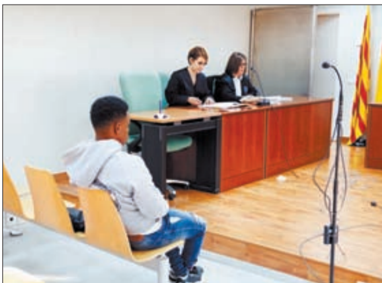
Moment del judici celebrat al penal 3 de Lleida

germans entre 7 i 10 anys. La sentència també estableix que l'home indemnizzi les víctimes amb 20.500 euros: 2.500 euros a cadascun dels tres germans i amb 6.500 a cadascuna de les dues germanes. En aquest sentit, considera provat que l'home va sotmetre als seus germans i germanastres a "càstigs físics