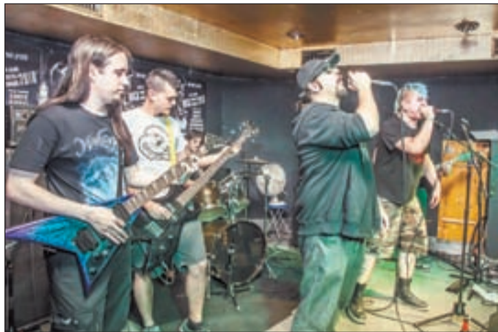
Sidosis, finalistas del XV Pepe Marín Rock