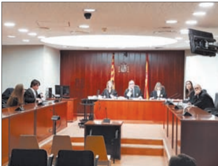
La dona va declarar per videoconferència l'11 de març

La sentència recull les declaracions que els Mossos d'Esquadra que van vigilar la cangur i l'home, i que van fer fotografies de l'escena, van fer durant la vista oral. Els agents van manifestar que durant la vigilància van comprovar que l'home li feia petons a la boca a la menor i l'agafava per les natges, mentre que la nena mostrava una actitud de rebuig. A més, això succeïa mentre l'acusada tenia "una actitud de vigilància". De fet, van indicar que en un moment donat la nena i la cuidadora van sortir de la terrassa i van tornar després d'uns minuts, tornant-se a asseure la menor sobre l'home. Així, l'agent dels Mossos van mantenir