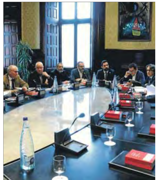
La mesa del Parlament, durant la reunió d'ahir

Llegint la premsa escrita o pensada des de Madrid es podia creure que el judici contra els presos polítics seria bufar i fer ampolles, perquè les coses estaven prou clares. Després, a l'hora de presentar les proves documentals s'ha vist que no era així. Ara, qui corre el risc de quedar desprestigiada és la justícia espanyola. Així ho veu l'il·lustrador Santy a La Opinión .