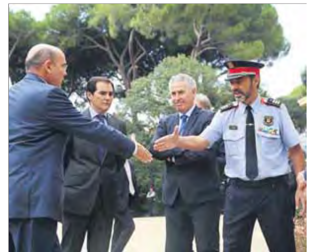
Trapero saluda Pérez de los Cobos, coordinador policial de l'1-O, en la junta de seguretat del setembre

el coordinador policial de l'1-O, el coronel de la Guàrdia Civil Diego Pérez de los Cobos, carreguessin durament contra ell i l'acusessin d'haver planificat un dispositiu per no aturar l'1-O. Si Trapero declara, les seves afirmacions no haurien de perjudicar-lo en el seu judici, segons fonts jurídiques consultades. ■