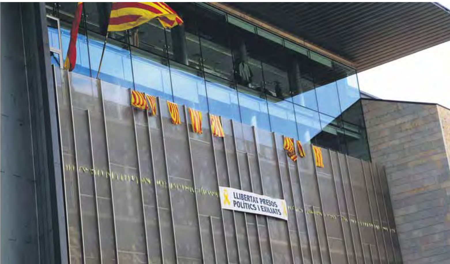
L'edifici dels serveis de la Generalitat a Girona tenia penjada ahir la pancarta amb llaços grocs en què es reclama la llibertat dels presos i exiliats