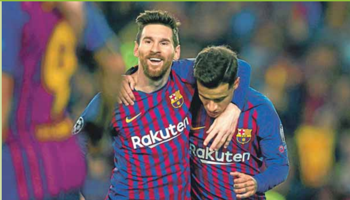
Coutinho celebra amb Messi el segon gol del Barça en la primera part

DEFENSA • El president presenta l'escrit d'al·legacions, hi veu un nou intent de censura a la llibertat d'expressió i posa en dubte la neutralitat de la Junta Electoral