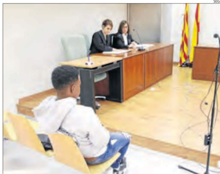
El condemnat, al judici que es va celebrar l'octubre passat.

La jutge va descriure els maltractaments contra els nens com "actes brutals, humiliants i cruels"