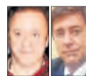
N. Sala / J. Agustí

L'Escola de Dansa de Guissona, que dirigeix, va aconseguir set premis al Nacional Orbe de Burgos, en el qual competien 90 centres de tot l'Estat.