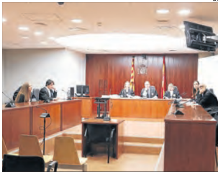
L'acusada va declarar per videoconferència des de Romania.

Els abusos es van cometre el març del 2015 a la terrassa d'un bar de Bellvís. Els Mossos d'Esquadra els van observar en directe després que una veïna detectés dies abans una "actitud inapropiada" de l'ancià cap a la menor. L'hi va comentar a una amiga, que ho va corroborar i ho va explicar a la seua parella, un agent de la policia catalana. L'endemà, els agents van presenciar l'escena. "L'agafava per les natges, la pressionava contra els seus genitals i li feia petons a la boca", va explicar un mossos, que va afegir que "donava diners a la nena que, posterior-