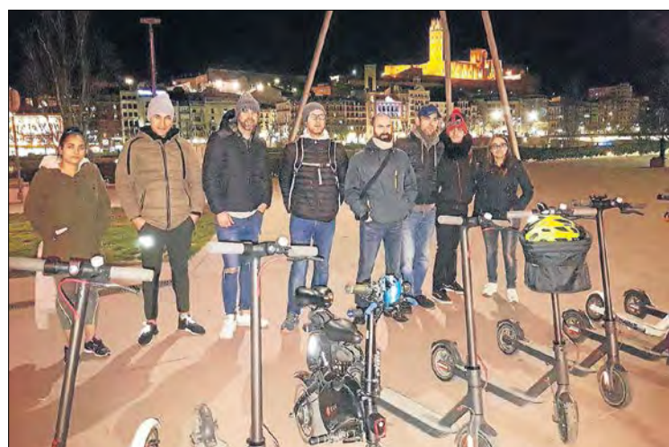
El col·lectiu VMP, que s'oposa a aquesta ordenança per a patinets.