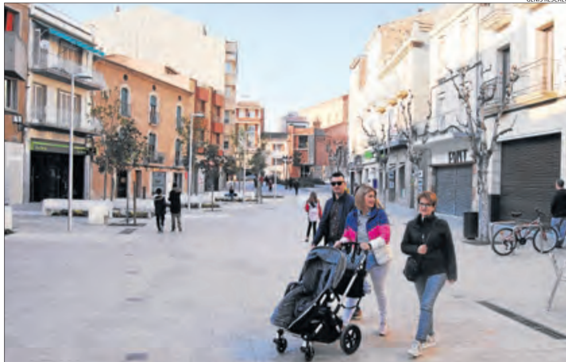
La plaça Manuel Bertrand, per a vianants.

S'ha de recordar que l'ajuntament de Mollerussa va cedir la recollida de residus urbans de la ciutat al consell comarcal del Pla d'Urgell el 2014. Va ser aleshores quan es van distribuir nous contenidors de selectiva i també es van començar a recollir fraccions com l'orgànica. També es va començar a oferir serveis com la recollida d'objectes voluminosos i la deixalleria mòbil, que s'atansa als barris de la ciutat per tal de facilitar la recollida d'objectes que no es