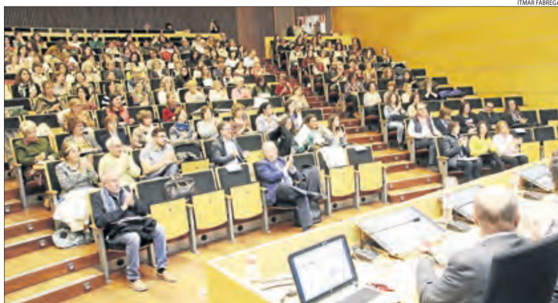
Un moment de la dotzena jornada d'acompanyament al dol ahir a la Universitat de Lleida.

Així mateix, Bátiz va advocar per la "humanització" dels professionals que han d'atendre pacients que estan en fase terminal. Posteriorment estava prevista una taula redona sobre com gestionar el dol dins de la unitat familiar i com afrontar la pèrdua d'un fill abans o just al nàixer.