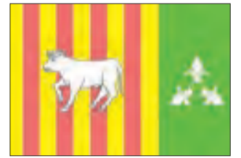
La bandera de les Borges.