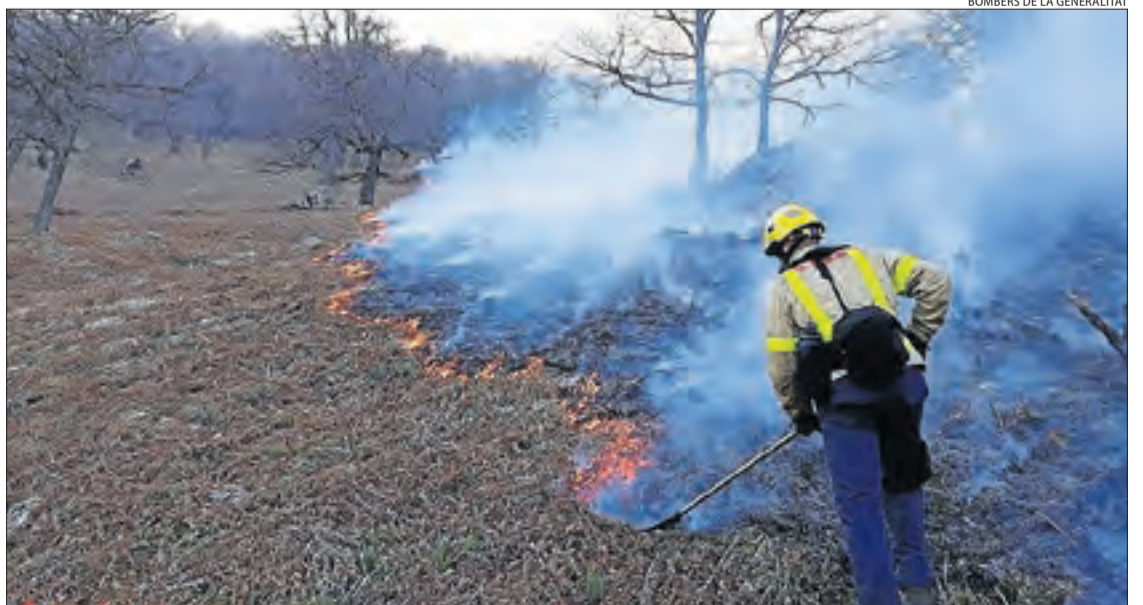
Els bombers van fer un tallafoc per evitar que les flames avancesin.

Forestal (GRAF) transportat en helicòpter. En les tasques d’extinció també va participar un helicòpter bombardier i van fer un tallafoc. Els efectius es van retirar al pondre’s el sol i aquest matí tornaran al lloc dels fets per a l’extinció. D’altra banda, un incendi va calcinar ahir 1,5 hectàrees a la Granadella. Els Bombers van rebre l’avis a les 13.31 hores i fins al lloc van anar quatre dotacions. A Maials es van cremar 500 metres.