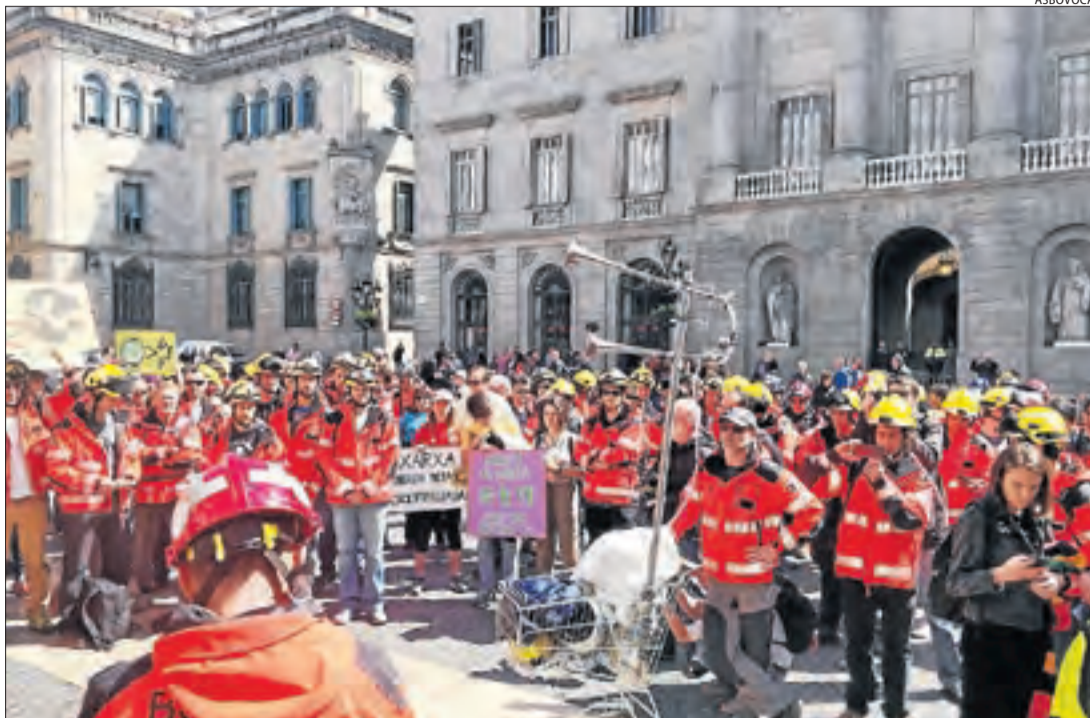
A la plaça Sant Jaume, davant de la Generalitat, van llegir un manifest amb les seues reivindicacions.