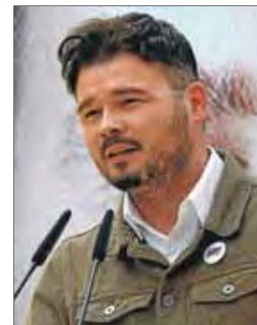
Gabriel Rufián, número dos d'ERC, ahir en l'acte de Figueres

En un míting a la plaça de l'Escorxador de Figue-