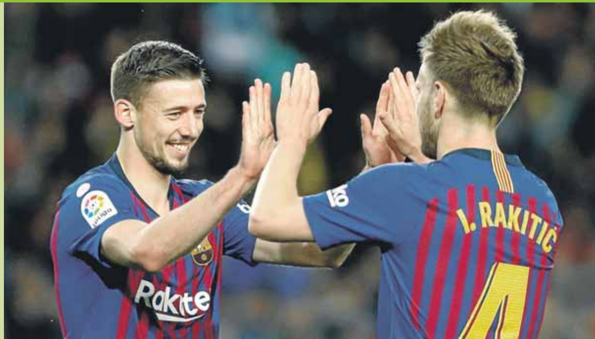
Lenglet celebra amb Rakitic el gol que va fer ahir al Camp Nou, el primer del Barça en el 2-1 sobre la Real