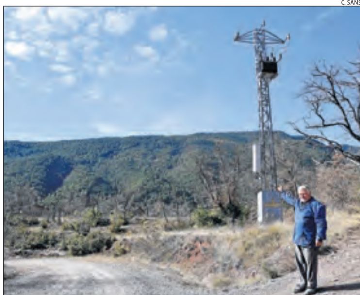
Una de les torres de la línia elèctrica inacabada.