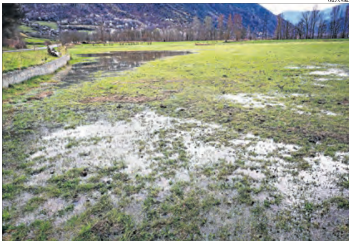
Una zona dels prats d'Escalarre entollada per aigua de reg dimarts.