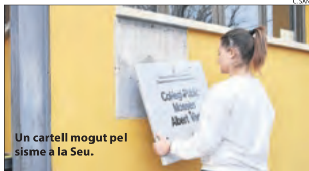
Un cartell mogut pel sisme a la Seu.

Sense danys || El terratrèmol va moure copes i mobles, va fer trontollar llums i va despenjar cartells