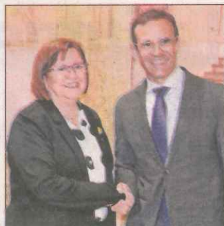
Firma del conveni.