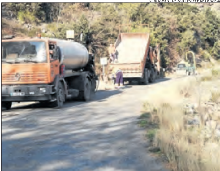
Els treballs s'han iniciat aquesta setmana i acabaran la vinent.

Inversió de més de 50.000 euros a les obres de millora de la carretera local de Sant Esteve