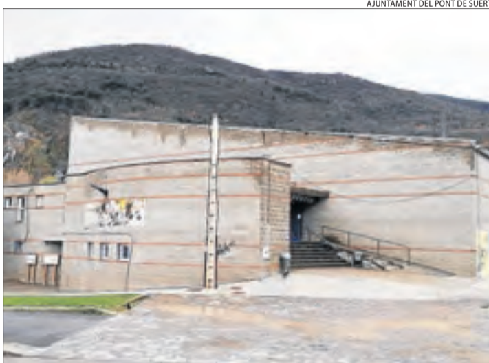
Imatge del pavelló municipal del Pont de Suert

finançaran amb una ajuda de la Diputació del 60 per cent de l'import i la resta es pagarà amb fons propis de l'ajunta-