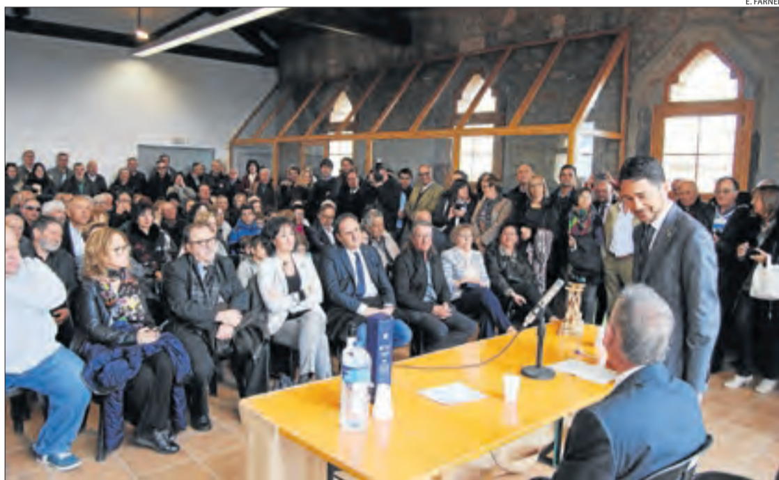
El conseller, en els actes de celebració del centenari de la cooperativa de l'oli de l'Albi.

LLEIDA | El conseller de Territori, Damià Calvet, va assegurar ahir que el Govern estudia ampliar la superfície esquiable de Port Ainé segons el compromís adquirit amb l'alcalde de Rialp, Gerard Sabarich, que va demanar de prolongar la superfície al considerar que s'havia quedat petita. Port Ainé, amb 25 pistes que sumen 26,7 quilòmetres, ha registrat un creixent nombre d'esquiadors. Les dos estacions del Sobirà (Espot i Port Ainé), de FGC, reben 200.000 esquiadors a l'any. "Treballem perquè aquests actius territorials continuïn sent estables i aportin més economia i ocupació a la comarca", va dir. Aquestes declaracions arriben després que l'ACA vetés el Doctor Music a Escalarre. Calvet va assegurar que el Govern va treballar "per adequar la mida, la ubicació i la durada" del festival "a les possibilitats del territori", però que el model comercial de la promotora no era possible legalment. Va avançar que el president Torra ha convocat el president del Sobirà, Carlos Isús, els alcaldes i la presidenta de la Diputació, Rosa Maria Perelló, dijous a Barcelo-