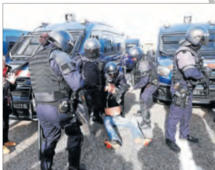
Moment de l'aldarull entre els Mossos i l'investigat.

L'home va denunciar tres agents, ja que va resultar ferit quan van desallotjar la protesta a l'autovia