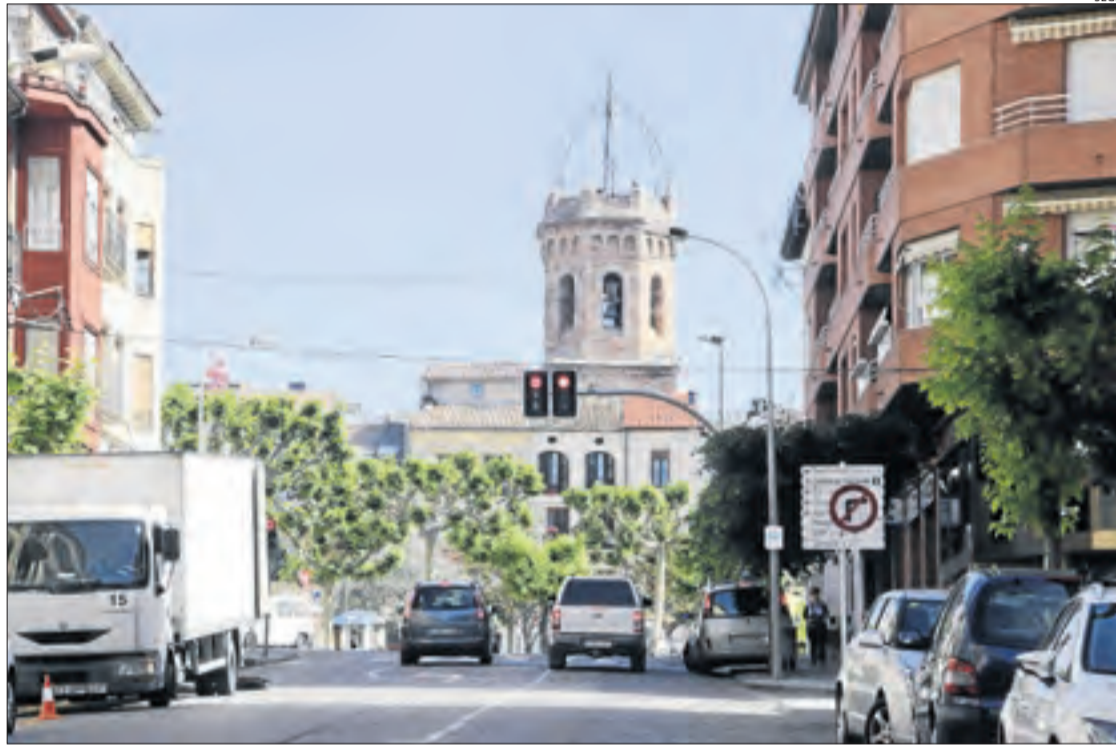
Els fets van tenir lloc en un parc de Tremp a mitjans de l'any passat.

El condemnat va recórrer la sentència a l'Audiència de Lleida al considerar que s'havia vulnerat el principi de pre-