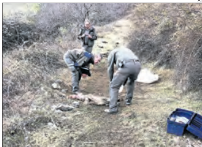
Agents forestals analitzant el vedell després de l'atac.