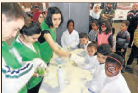
Un grup de nens, en una de les activitats.

Cucalòcum obre fins al dijous dia 18, en horari de 10.00 a 14.00 hores i de 16.00 a 20.00 hores, amb l'objectiu de facilitar la conciliació familiar els dies feiners de Setmana Santa. Al recinte, els nens de diferents edats trobaran activitats lúdiques, jocs d'enginy, aventura, zones de lectura, de projeccions o per a la pràctica de diferents esports, adaptades a cada tram d'edat. Alhora, altres activitats seran educatives, sense perdre el seu caràcter amè i de diversió.