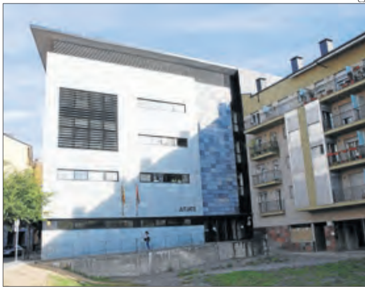
Vista dels jutjats de la capital de l'Alt Urgell.

Els agents van arrestar dissabte un jove de 20 anys de nacionalitat colombiana i un altre home de 34 anys de nacionali-