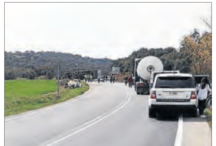
L'accident va tenir lloc al quilòmetre 95 de la C-14, a Preixens.