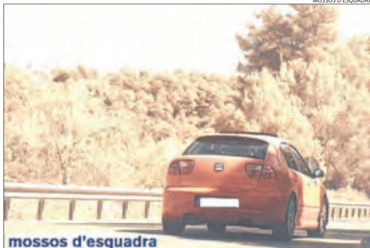
Imatge del vehicle interceptat a l'N-240 a Tarrés.

El denunciat haurà de comparèixer davant del Jutjat d'Ins-