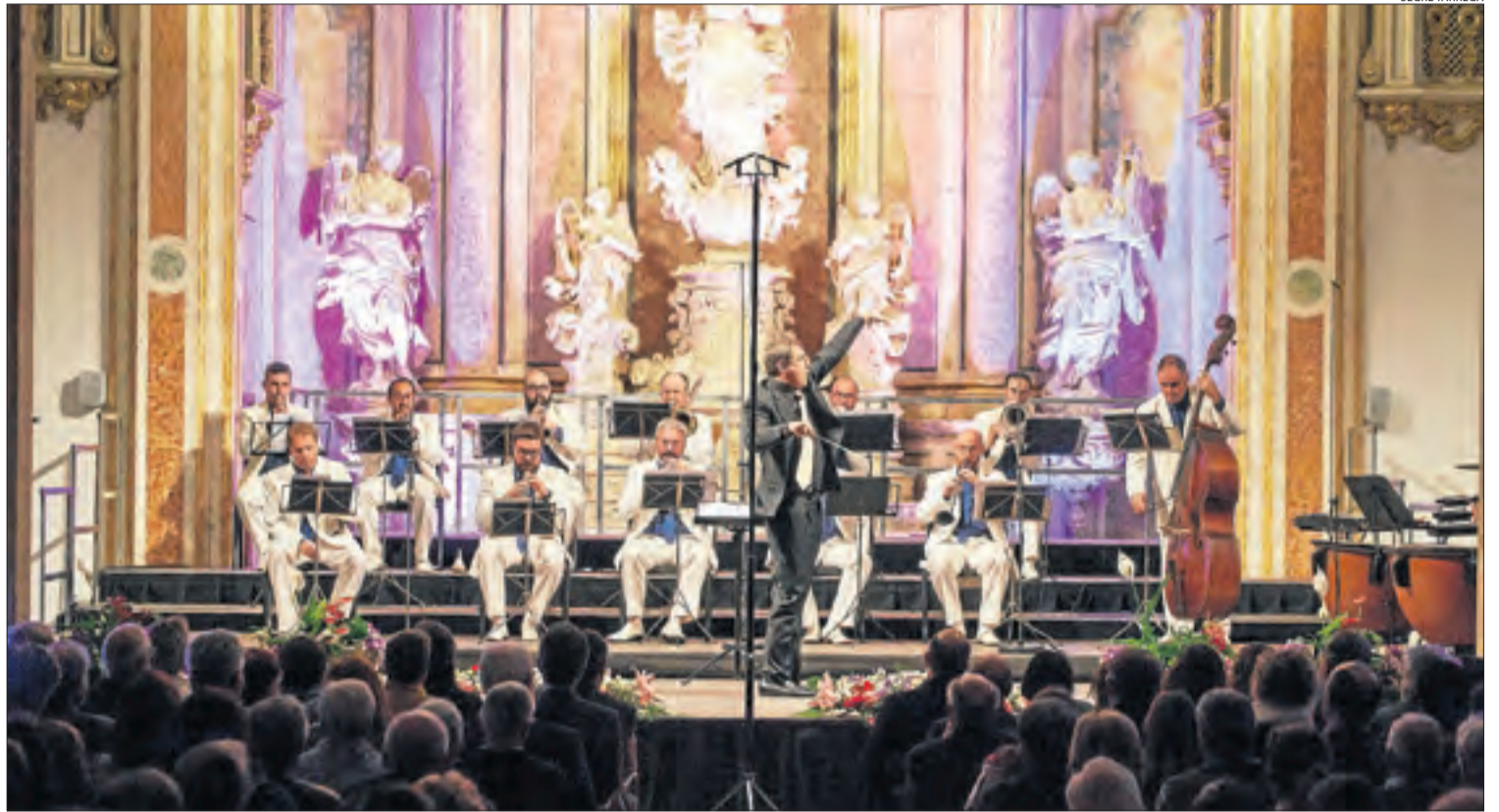
Estrena de '660 anys', producció de Brotons per a Cervera. El concert va aconseguir omplir el paranimf amb més de 300 persones.