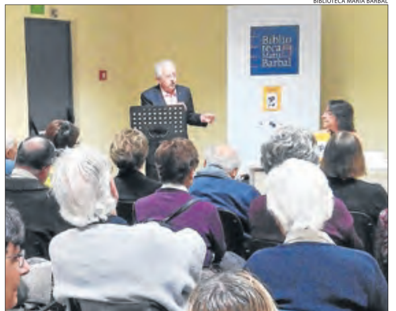
BIBLIOTECA MARIA BARBAL