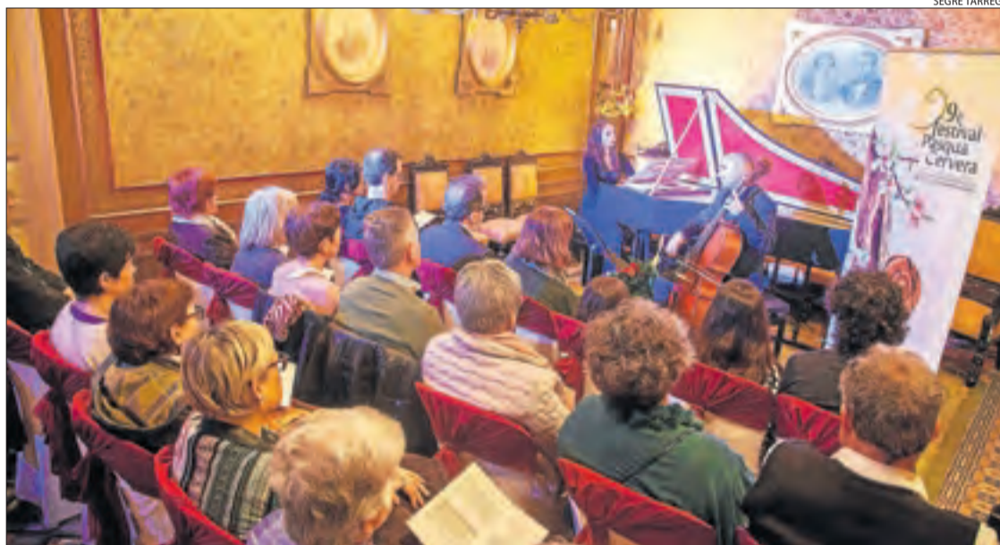
Primer concert de proximitat ahir a la Casa Duran i Sanpere dedicat a l'obra de Pau Vidal.