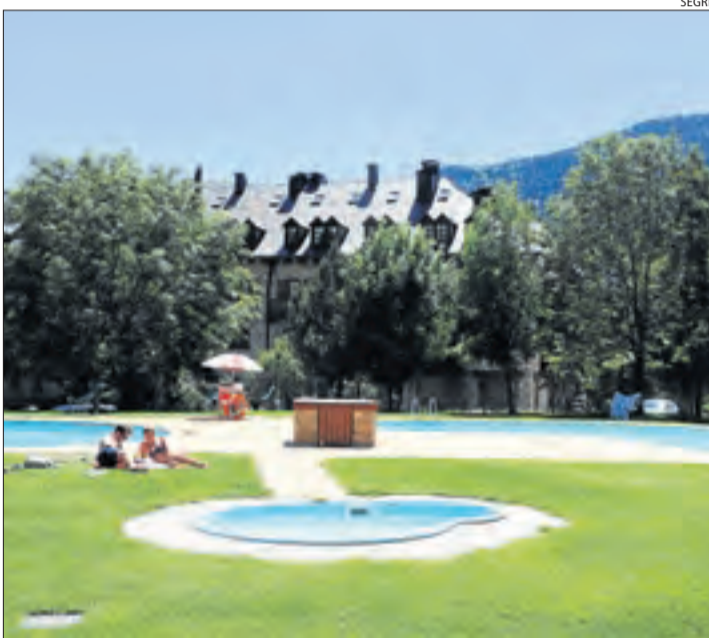
Imatge d'arxiu de les piscines del Pla de l'Ermita.

"Es tracta d'equipaments que són d'interès per al municipi però que no ho són per a les empreses que vulguin llogar els hotels", va assenyalar Perelada, que va destacar la bona disposició de l'administració