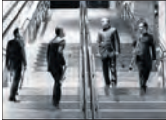
Barcelona Clarinet Players.