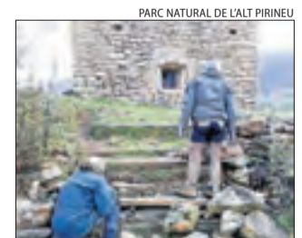
L'ermita de Soler.

SORT | Tècnics de l'empresa pública Forestal Catalana han reparat els desperfectes i han desbrossat el camí d'accés i l'entorn de l'ermita romànica de Mare de Déu del Soler, al terme municipal de Sort. Després de l'hivern, les herbes s'havien acumulat i dificultaven el pas. L'objectiu és deixar aquest espai preparat per al pròxim aplec popular, que es portarà a terme el dimecres 1 de maig.