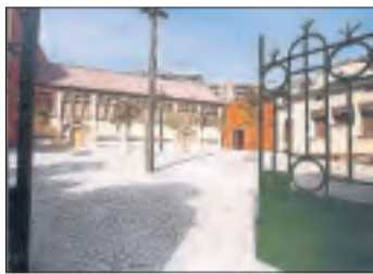
Teatre de l'Escorxador.