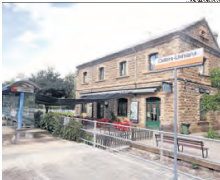
Imatge d'arxiu de l'estació de Cellers-Llimiana.

Les obres de consolidació dels quatre edificis i un hangar a Tremp costaran 517.214 euros