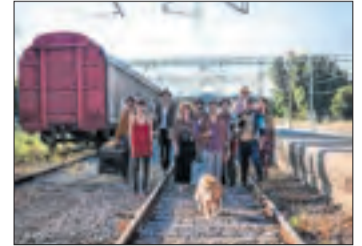
Cia. Parking Shakespeare.