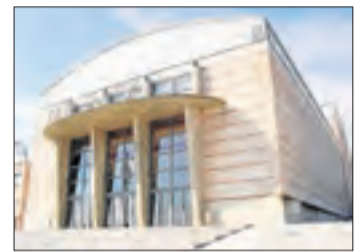
Teatre Municipal de Balaguer.