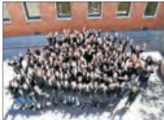
Coral del Sant Josep.