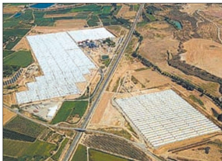
Imatge de la central termosolar de les Borges Blanques

primer emès, el banc ha destinat els 1.000 milions d'euros captats al finançament de projectes d'energia renovable i transport sostenible. Un dels projectes finançats pel BBVA amb la captació és la construcció de la central termosolar de les Borges Blanques, la primera central híbrida al món que combina energia solar termoelectrícula i de biomassa.