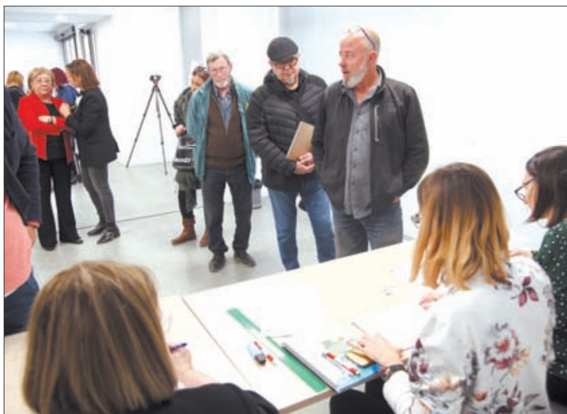
Empresaris votant ahir a la seu de la Cambra de Comerç i Indústria a Lleida

La Cambra de Comerç de Lleida va facilitar ahir els resultats de les eleccions passada la una i mitja de la matinada. El període per votar el nou plenari de la Cambra de Comerç i Indústria de Lleida va finalitzar ahir. Segons van informar fonts de l'ens cameral, entre els dies 2 i 7 de maig, en els quals els empresaris van poder efectuar el vot per internet, es van comptabilitzar un total de 711 vots, mentre que ahir, on el vot es va efectuar de forma presencial a la seu de la Cambra