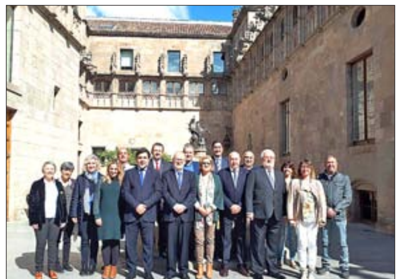
Imatge de la comissió bilateral Generalitat-Conselh Generau

Una de les principals dificultats ha estat el finançament d'aquesta estructura pel que fa a la cartera de la Prevenció i Extinció d'incendis i Salvaments.