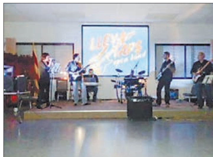
La banda apuesta por las versiones de rock

The Poorboys, celebrando el 50º aniversario del concierto de los Creedence en Woodstock.