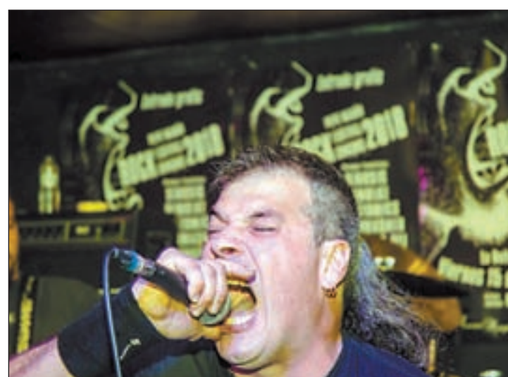
Brainwashed, ganadores del último certamen

La CTretze de la Poble de Segur, "por motivos de las elecciones y los mítings programados en el pueblo nos vemos obligados a posponer el concierto de Olympic Flame", según reza un comunicado de la sala. Olympic Flame es una banda barcelonesa nacida en 2016 que ese mismo año publicó su primer EP homónimo, al que siguieron dos sencillos -'Voyager' y 'Pionners'- que le abrió las puertas del Primavera Sound. Actualmente se encuentra de gira con su nuevo EP, 'Thalassa'.