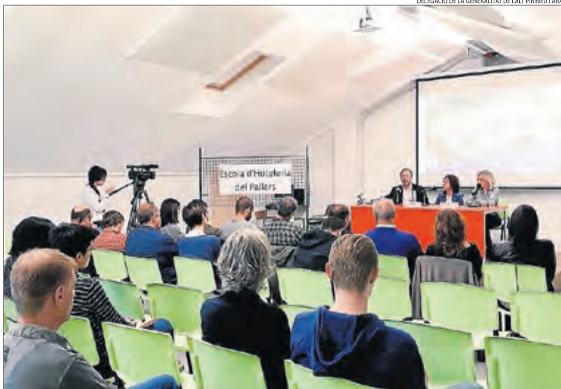
Imatge de la presentació de l'Escola d'Hoteleria del Pallars.

Així mateix, també serà singular perquè "les empreses estaran molt més implicades en la formació". Aquest cicle oferirà un màxim de vint places i està pensat deliberadament per al Pallars, per la qual cosa incorporarà coneixements i formació sobre productes del territori i la gastronomia típica de la zona. Per aquesta raó, els alumnes rebran també coneixements sobre vins i cerveses artesanes. Vega va afirmar que la intenció de l'escola d'hoteleria és oferir