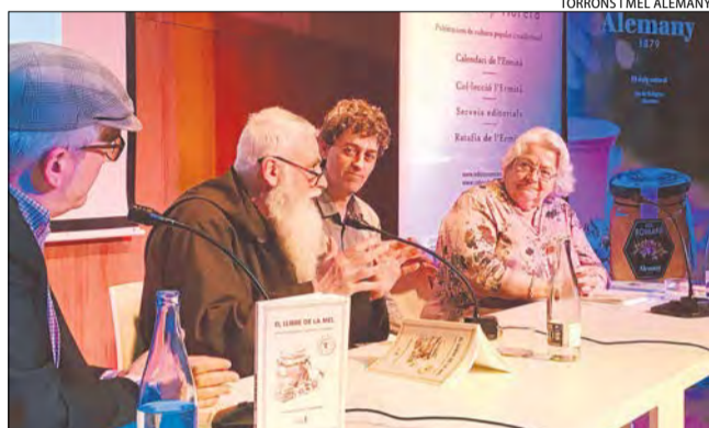
TORRONS I MEL ALEMANY

Tàrrrega reconstrueix en una exposició el seu passat urbanístic medieval, un treball que compagina fonts documentals històriques i les noves tecnologies. Al Museu Comarcal de l'Urgell, fins al 30 de juny.