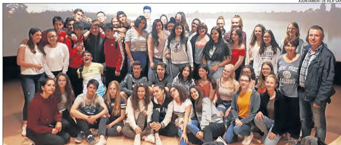
AJUNTAMENT DE VILA-SANA

del servei de formació i inserció Enfoc de l'entitat. L'objectiu del programa és facilitar la inserció laboral a nivell pràctic i formatiu.