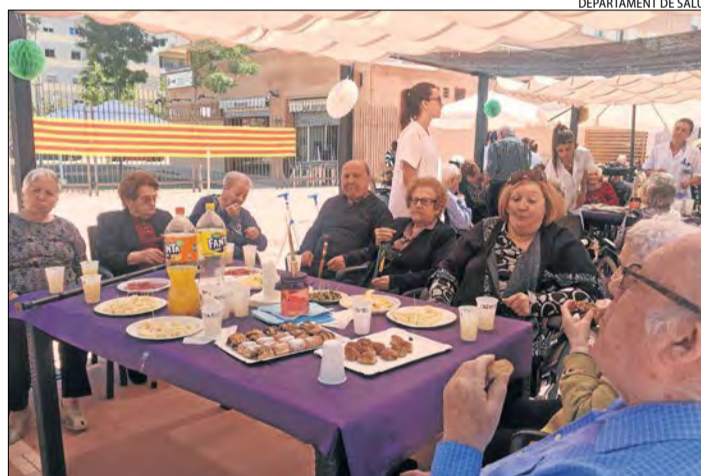
DEPARTAMENT DE SALUT

Alumnes de l'institut Manuel de Montsuar de Lleida han visitat el Centre d'Immersiò de Vila-sana juntament amb joves alemanys que formen part d'un programa d'intercanvi. Els estudiants van poder gaudir de la pantalla de grans dimensions que té el municipi, entre altres atractius.