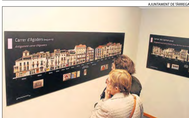
AJUNTAMENT DE TÀRREGA