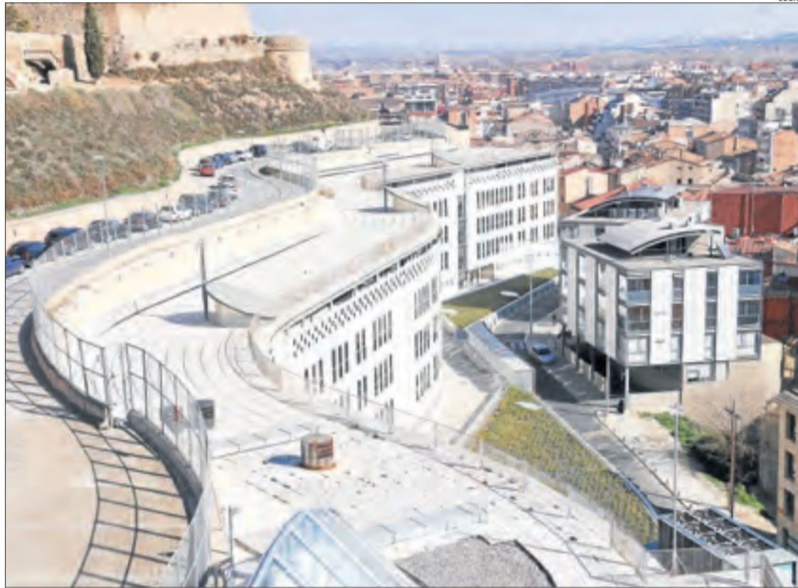
Vista panoràmica de la seu dels jutjats de Lleida al Canyeret.

Així mateix, el Ministeri Públic va investigar quatre casos per ús de menors per a l'elaboració de pornografia, dos més que un any abans, i un per un delicte d'exhibicionisme o provocació sexual davant de menors. L'any passat no se'n va registrar cap cas, almenys als tribunals, per assetjament telemàtic a menors