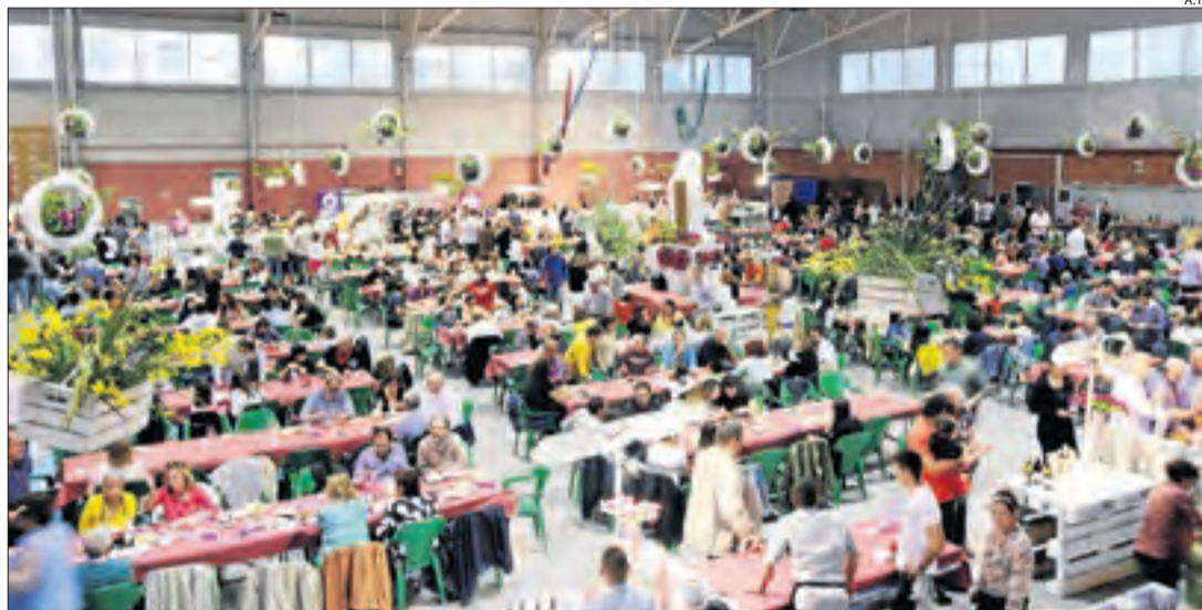
Imatge de la quarta edició de la Pallars Food Fest de Tremp.