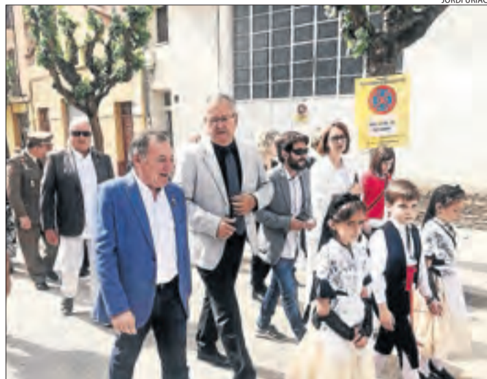
La rambla Doctor Pearson de Tremp acull la Fira de Primavera.