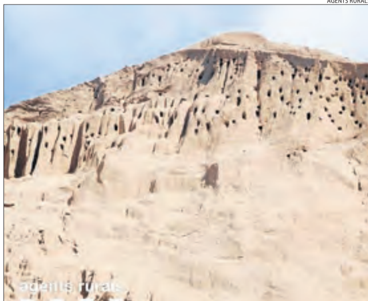
Vista del lloc on s'han localitzat els nius a Arbeca.

Els Agents Rurals han comunicat al titular de la gravera que fins que no passi el període reproductiu de les aus no podrà remoure els àrids afectats sense autorització prèvia de la Generalitat com a mesura de protecció.