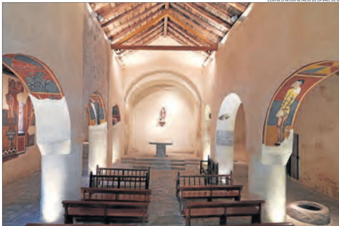
Vista de l'interior de l'església de Sant Joan de Boí i de les seues pintures.

Aquesta tecnologia es farà servir per divulgar la història i el significat de les pintures del temple