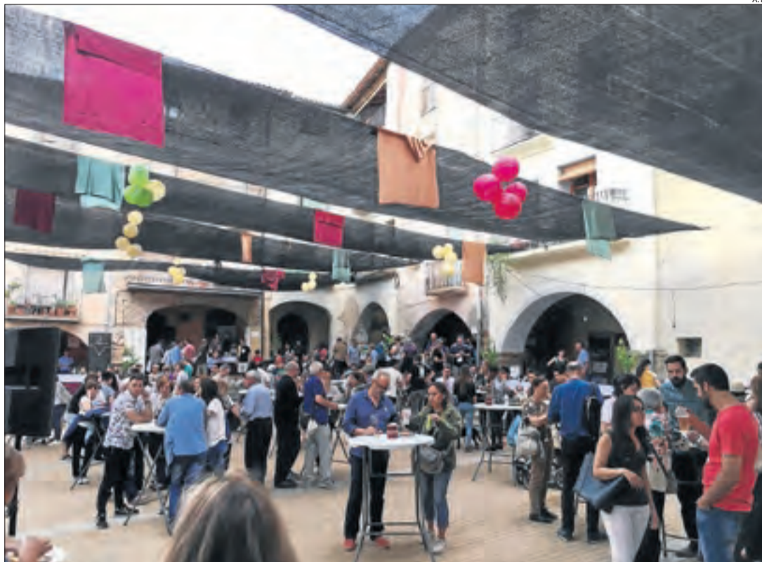
La degustació de vins i productes de proximitat va ser un dels atractius del certamen.