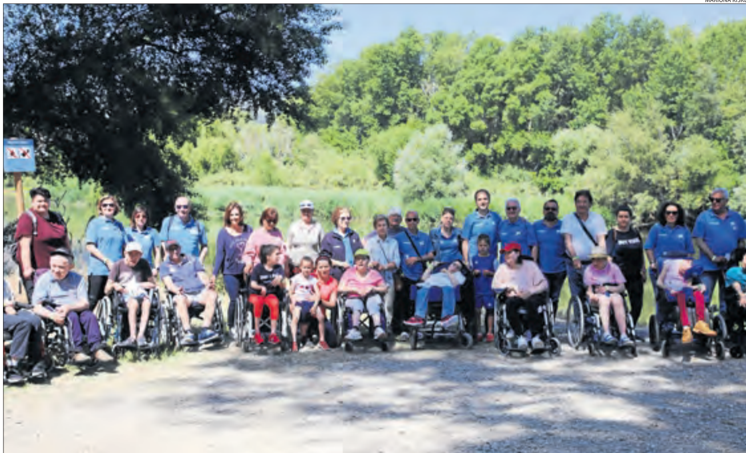
Voluntaris i persones de l'Associació Aremi, abans de començar les passejades i activitats per l'aiguabarreig a la Granja d'Escarp.