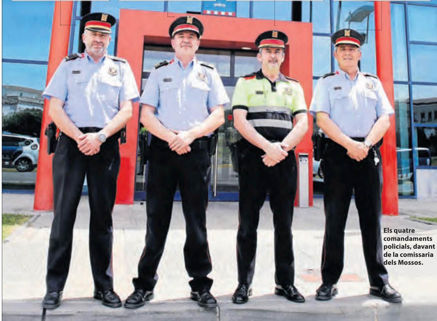
Els quatre comandaments policials, davant de la comissaria dels Mossos.

■ Fa 20 anys era el cap de la Unitat de Seguretat Ciutadana (USC) de l'ABP Segrià-Garrigues-Pla d'Urgell. Va ser el primer coordinador de seguretat d'espectacles esportius d'elit quan la Unió Esportiva Lleida estava a Segona A. "Érem principiants en ordre públic."