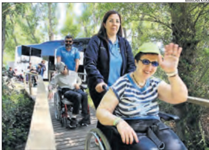
El recorregut per la passarel·la del bosc de Sant Jaume.

Des de principis d'aquest mes de juny i fins avui diumenge estan previstes més de tres-centes activitats a tot Catalunya per a la conservació de l'entorn dirigides a tots els sectors de la població.