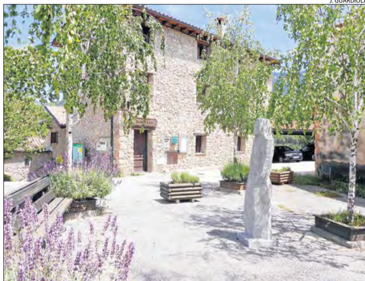
Vista de l'ajuntament de la Vansa i Fórnols.

LA VANSA I FÓRNOLS | Una mare i la seua filla de 8 anys van resultar intoxicades ahir a la matinada per la mala combustió de la caldera en una casa de la Vansa i Fórnols, segons van informar els Bombers de la Generalitat. Les dos intoxicades van ser evacuades en dos ambulàncies del Servei d'Emergències Mèdiques (SEM) a l'Hospital Comarcal del Pallars. La dona, de 48 anys, presentava un pronòstic greu, segons el SEM. Els serveis d'emergència van rebre l'avís d'emergència pocs minuts abans de dos quarts de tres de la matinada en un immoble familiar d'aquesta localitat de l'Alt Urgell, en el qual residien dos menors. Fins al lloc dels fets es van traslladar dos dotacions dels Bombers de la Generalitat, que van apagar la caldera i van ventilar les instal·lacions. S'ha de recordar que una de les majors intoxicacions per monòxid de carboni a les comarques lleidatanes es va produir el febrer del 2015 a Vilanova de la Barca quan 39 persones d'entre quatre i vuitanta anys van haver de ser ateses per la mala combustió d'una estufa de propà a la penya barcelonista del poble, on havien acudit per veure la retransmissió en directe del partit entre el Barça i el Vi-