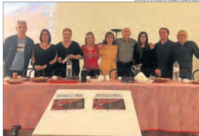
Els actors que van participar en la representació a Isona.