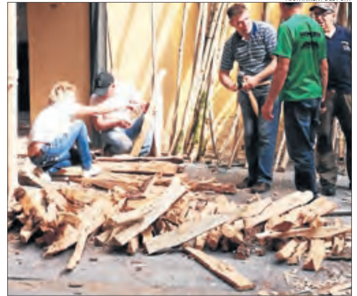
Troncs tallats per muntar falles.