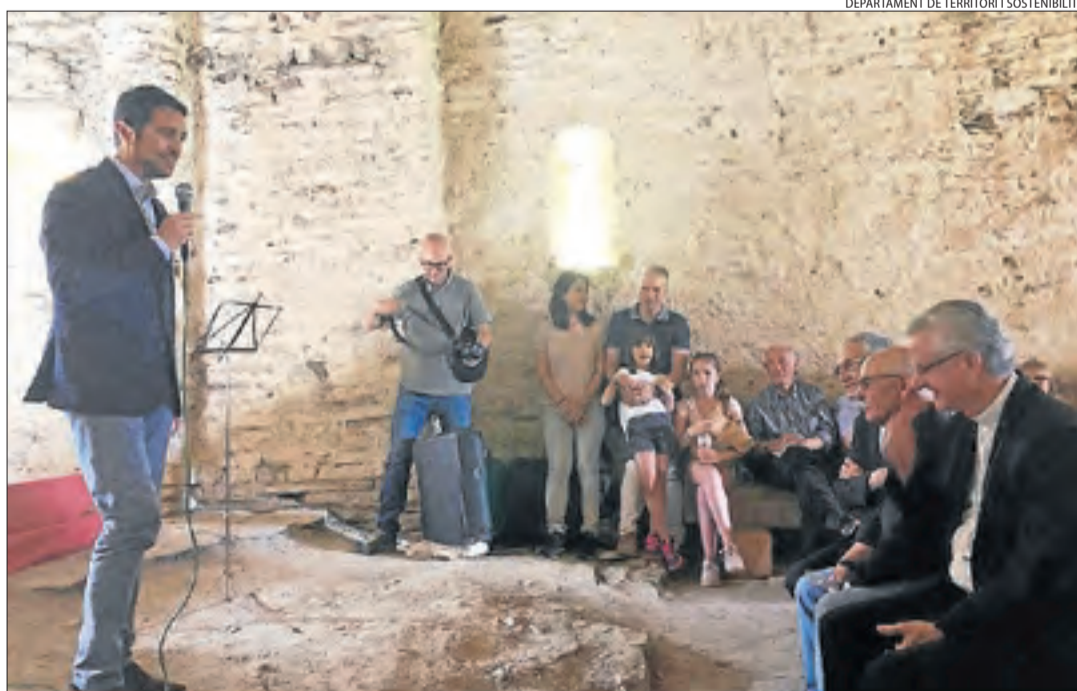
El conseller, durant la inauguració de l'ermita ahir a Farrera.