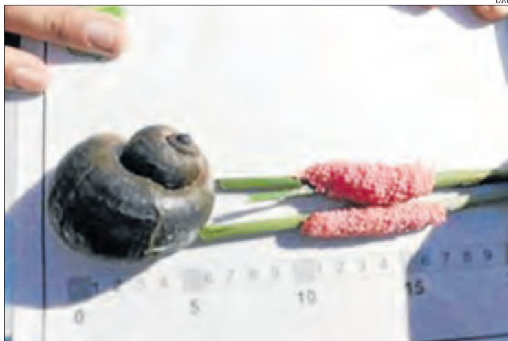
Imatge d'arxiu d'un caragol poma i una posta d'ous.

El caragol poma és considerada "una de les cent espècies invasores més perjudicials del món". Amb aquestes paraules