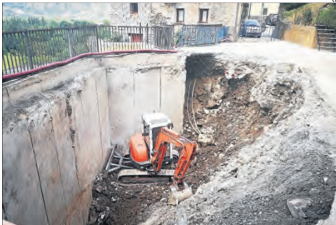
La màquina, en plena operació de buidatge de la plaça a Castelló de Tor.

A falta d'un còmput exhaustiu, l'alcalde va calcular que la intervenció pot assolir els 40.000 euros, per la qual cosa