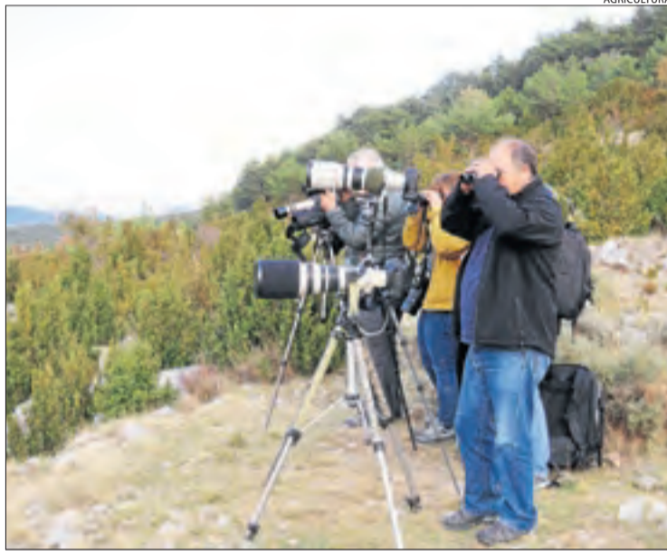
Turistes observant cérvols, en aquest cas, a la reserva de Boumort.

Paral·lelament, també hi ha la possibilitat de visitar de forma exclusiva la reserva amb guies acreditats del Parc Natural de l'Alt Pirineu. Segons va indicar Ruiz, l'objectiu de la regulació és canalitzar les visites a la reserva, que la temporada passada van ser de 1.500, 748 la temporada 2017-2018 i 554 visitants l'any 2016.