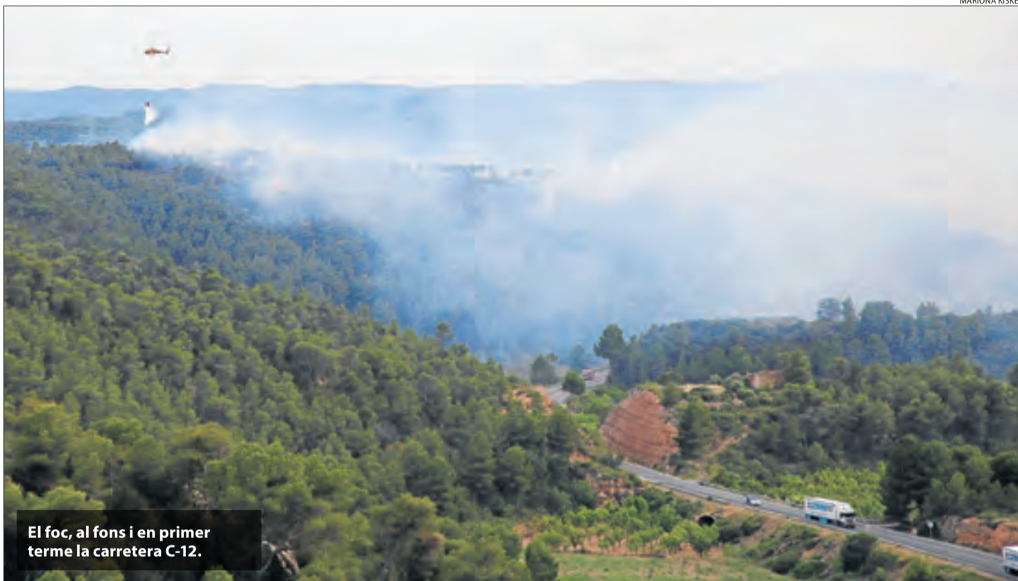
El foc, al fons i en primer terme la carretera C-12.