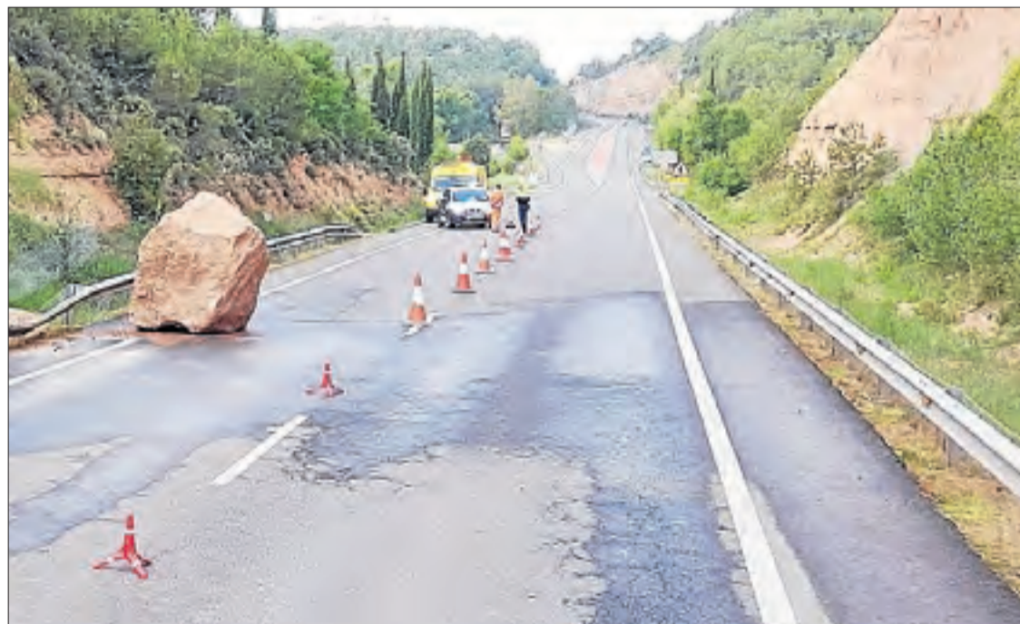
El desprendiment d'una roca va obligar a restringir ahir la circulació de la carretera C-14 a Bassella.

Fins al lloc es van traslladar quatre patrulles dels Mossos i quatre dotacions dels Bombers que van haver d'excavcar un dels ferits, que s'havia quedat atrapat. Així mateix, el Sistema d'Emergències Mèdiques (SEM)