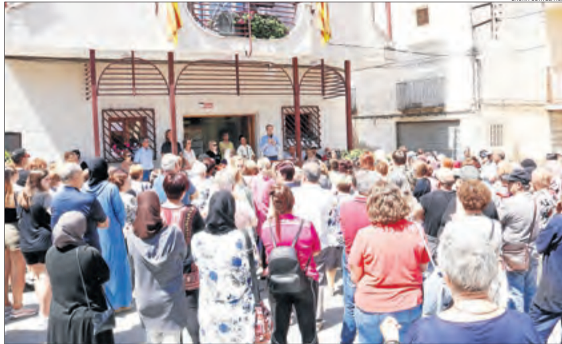
La Granja d'Escarp va fer dos minuts de silenci pel menor que va perdre la vida dilluns passat.

L'any passat van morir dos menors. Precisament, dissabte es va complir un any de la mort d'un nen de sis anys a les piscines municipals de Tàrrrega i a l'agost va morir un nen de set