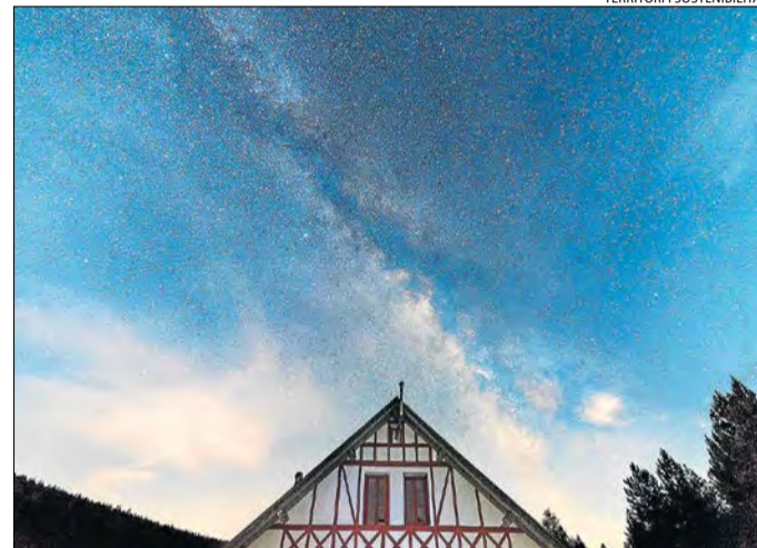
Imatge del cel nocturn del Parc Natural de l'Alt Pirineu.