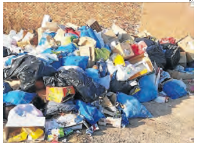
Escombraries acumulades al costat del cementiri de Torres de Segre.

sanció oportuna". L'alcalde va incidir que l'ajuntament té molta cura en la recollida de rebu- jos que porta a terme pel sistema d'illes. Segons va remarcar, aquesta situació s'ha repetit en les últimes setmanes des que va començar la campanya de la fruita, encara que moltes persones incíviques aprofiten per deixar les escombraries fins que s'acumulen en un munt.