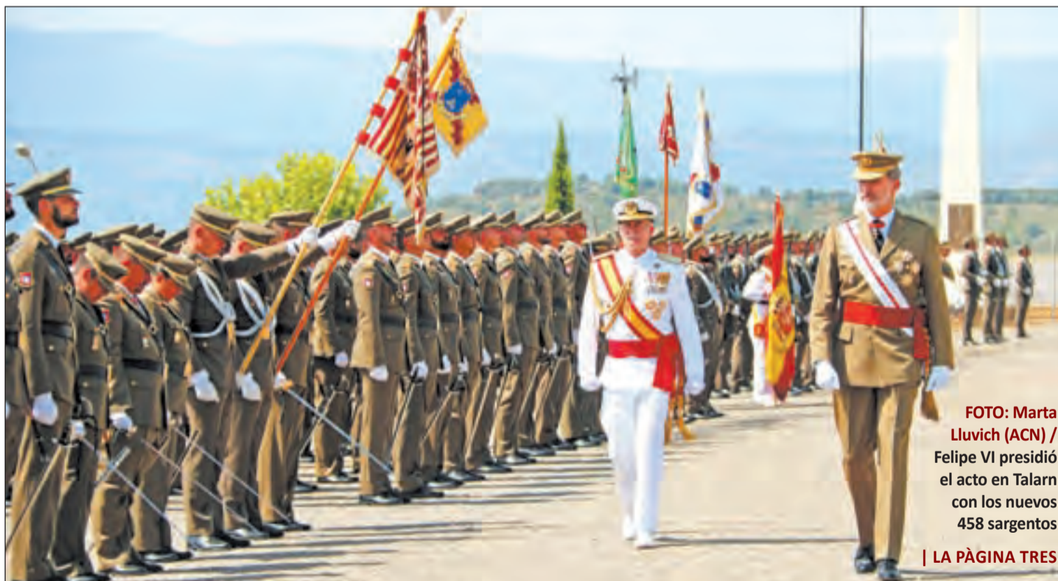
Felipe VI presidió el acto en Talarn con los nuevos 458 sargentos