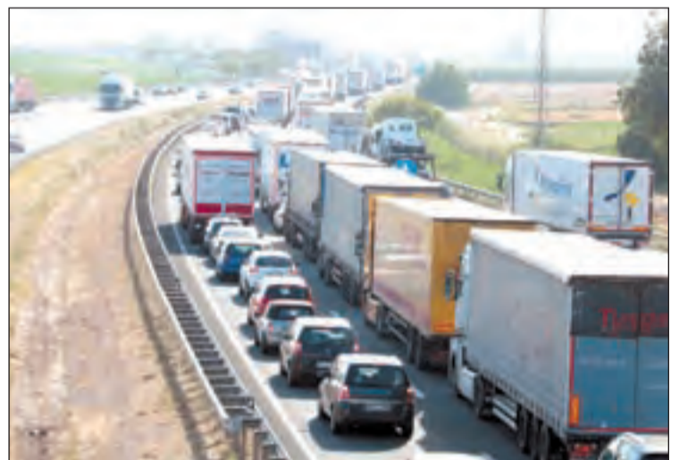
Imatge de les cues registrades ahir a l'A-2

ocupaven la via, tot i que els camions obligatòriament havien de circular per l'N-II. Posteriorment, fonts de Trànsit van informar que cap a les 19.00 hores es va tornar a tallar la via totalment. Pel que fa als sinistres, el primer xoc es va produir a les 16.10 hores, quan va tenir lloc un encaix entre tres camions i un turisme, un dels quals va bolcar per la part de la cabina i el conductor hi ha quedat atrapat. El segon sinistre va ser cap a les 16.41 hores i va ser un encaix entre tres camions. Destacar que no van haver-hi ferits i al tancament d'aquesta edició no s'havia normalitzat la situació.