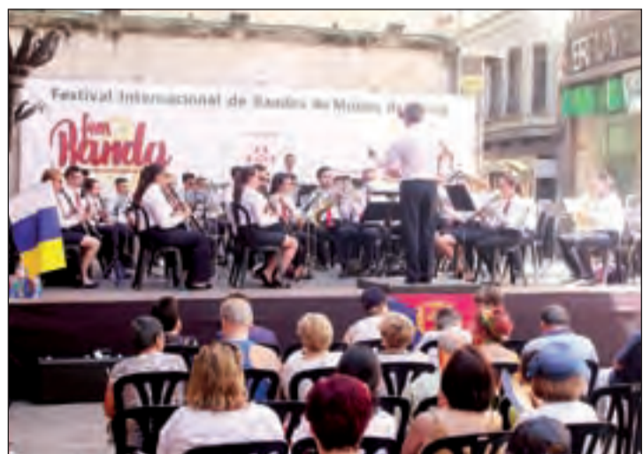
FOTO: Lidia Sabaté / La Agrupación Guayedra de Canarias en la Paeria

SLAYER CIERRA SU GIRA EN VIVEIRO La legendaria banda norteamericana de thrash metal Slayer se despidió el jueves de España con un último concierto de su gira final en el festival Resurrection Fest de Viveiro (Lugo), que por momentos peligró su celebración ante la tormenta eléctrica y de lluvia que cayó justo a la hora fijada para el inicio del concierto. Slayer está considerado uno de los cuatro grandes grupos del thrash metal junto a bandas del calibre de Metallica, Megadeth y Anthrax.