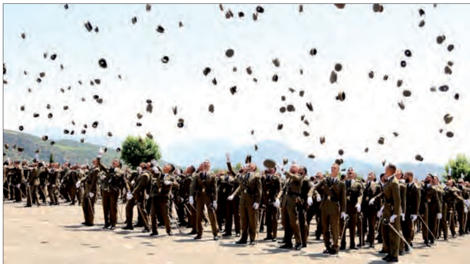
Els nous sergents de l'Acadèmia General Bàsica de Sotsoficials de Talarn van llençar les gorres a l'aire en finalitzar l'acte

Aquesta va ser la quarta visita del Rei Felip VI a Catalunya aquest any. La primera per entregar despatxos a Talarn com a Rei la va fer l'any 2015. Felip VI va ser l'encarregat de presidir l'acte i de distingir al número 1 de la promoció, Bogdan Davygora, d'origen ucraïnès. Des del 1980 el Govern de la Generalitat reconeixia al número 1 de la promoció amb una reproducció de l'es-