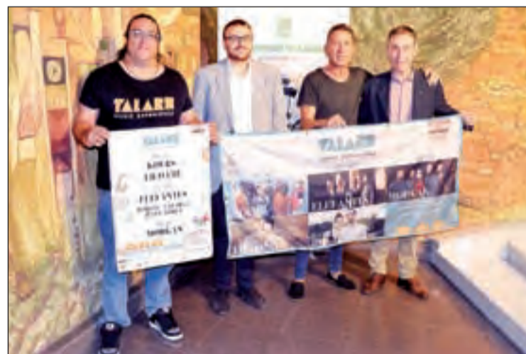
La organización ha apostado por artistas de gran nivel