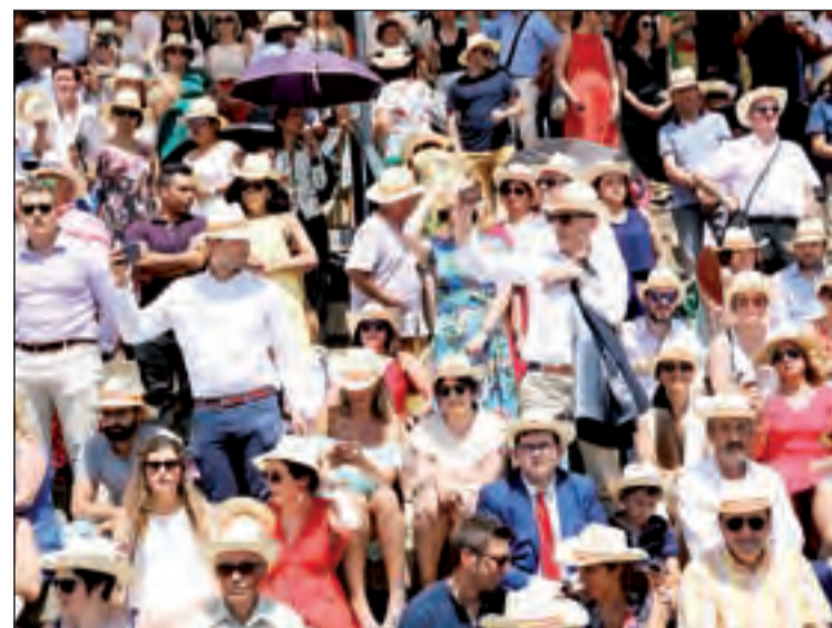
Es van repartir barrets a tots els assistents