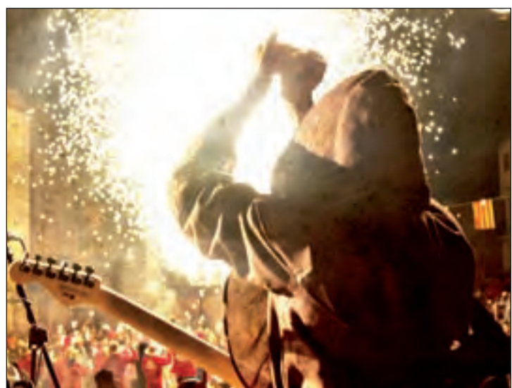
La formación al completo debutará hoy