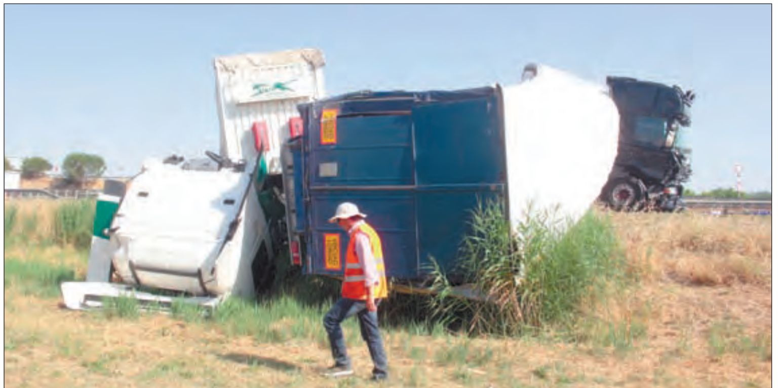
Estat en què van quedar dos dels camions implicats en un dels sinistres de l'autovia, al terme municipal de Sidamon

Un turisme va quedar ahir totalment calcinat per un incendi quan es trobava estacionat en un pàrquing de la Seu d'Urgell. En aquest sentit, els serveis d'emergències van ser alertats a les 5.56 hores que en un pàrquing situat al carrer Doctor Peiró de la Seu s'estava cremant un cotxe. Ràpidament es va activar el corresponent protocol i fins al lloc es va personar una dotació dels Bombers de la Generalitat que en 30 minuts havia apagat el foc.