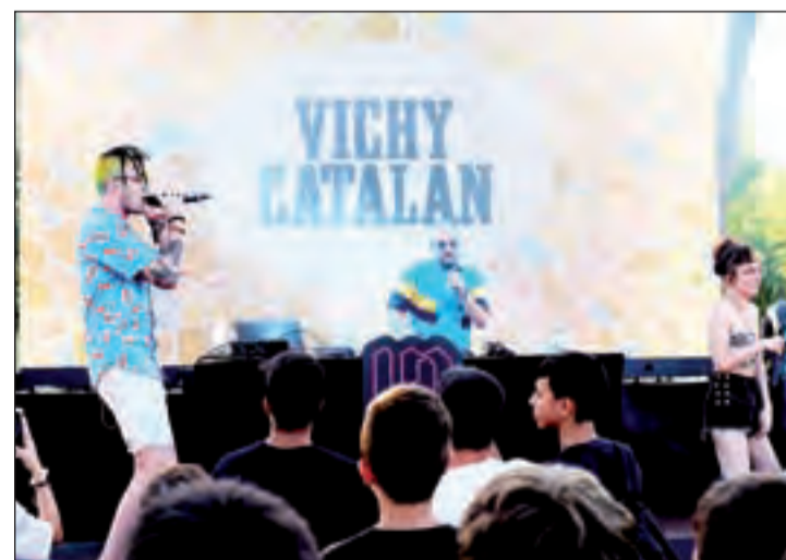
El cantante de rap y trap català en la presentación