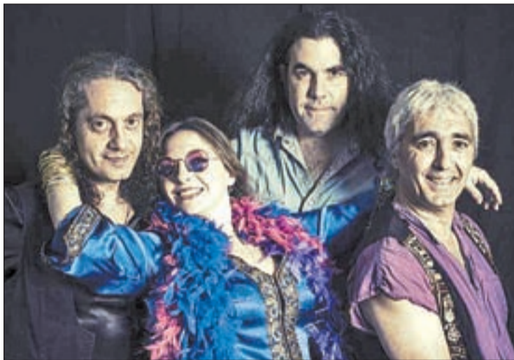
La Kozmic Band es una banda tributo a Janis Joplin

Aliens Eat Unicorns es la formación más joven de las convo-