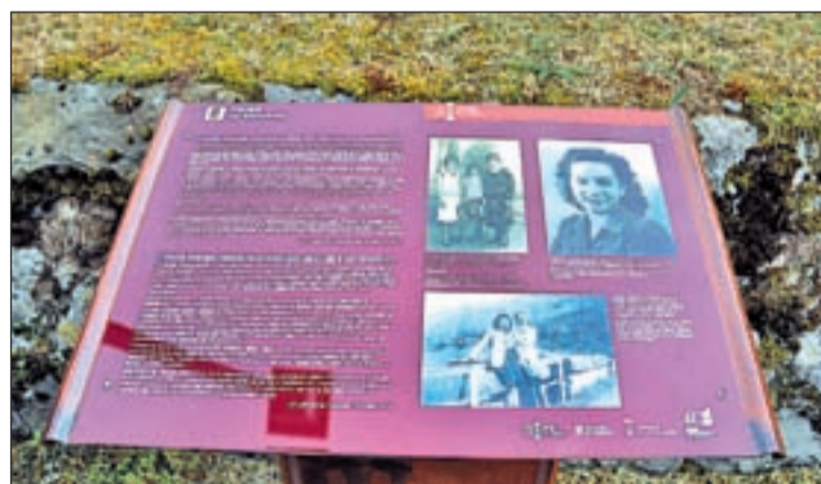
Detall de la placa que es va descobrir

i actes com aquest contribueixen de manera especial a la recuperació de la memòria històrica. Domènech va explicar que és una iniciativa que ha sorgit de la societat i va afegir "que és un deure de país tenir presents aquestes persones que van lluitar perquè visquéssim en democràcia".