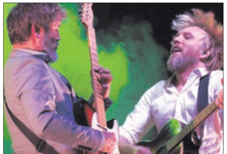
Elefantes, en pleno éxtasis concertístico

l'Infant. El repertorio de piano rock fusión también contempla temas nuevos y algunos 'covers'.