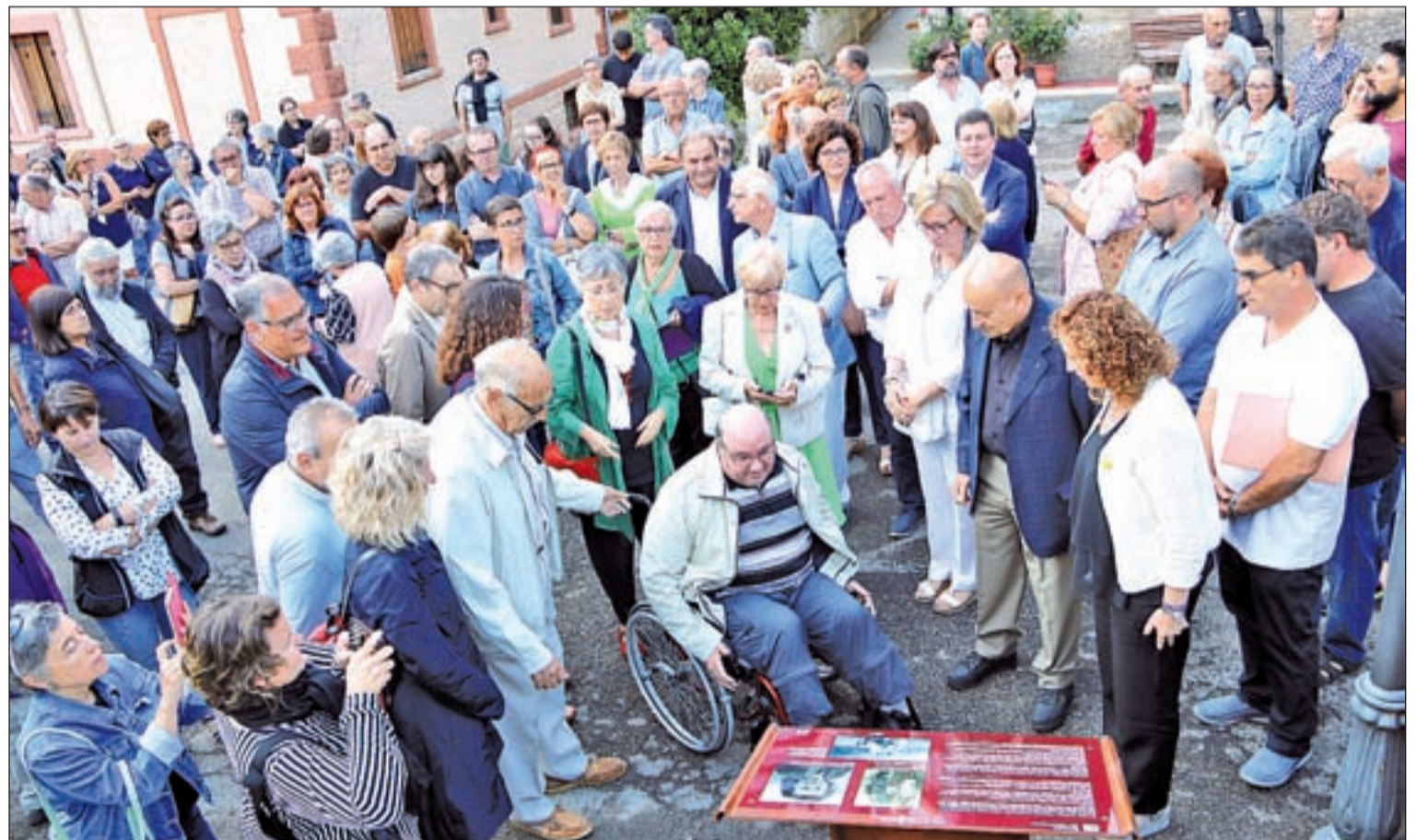
Va dedicar tota la seva vida a lluitar perquè no caigués en l'oblit la memòria de les dones deportades als camps