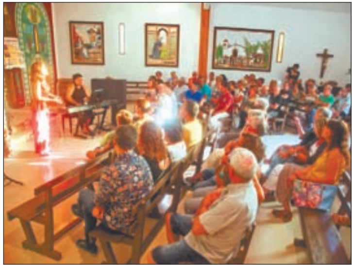
Darrer concert d'enguany a l'Ermida de Montalbà