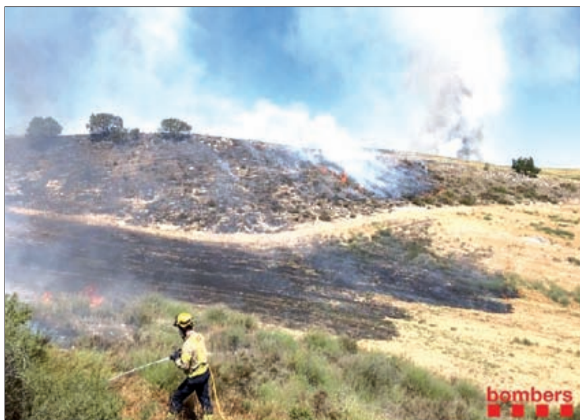
Els efectius dels Bombers treballant en l'extinció de l'incendi de Castelló de Farfanya