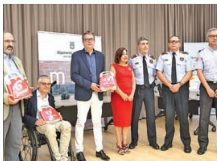
Fins a 24 per als Mossos i 10 als Bombers

lana van decidir tallar completament la via. D'aquesta manera, es van fer desviaments per la sortida 512 fins que a les 9.06 hores es va procedir a obrir un dels carrils fins a les 9.36 hores. Segons va informar Trànsit, tota aquesta situació va provocar fins a dos quilòmetres de retencions i a les 10.00 hores ja s'havia normalitzat la situació. Cal indicar que la passatgera del camió va ser traslladada a l'Hospital d'Igualada amb una possible fractura a un braç, mentre que els conductors de sengles vehicles van resultar ferits lleus.