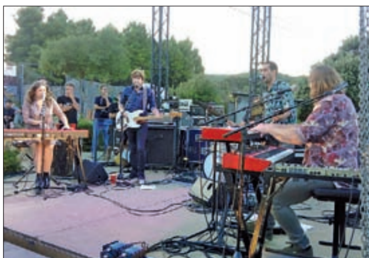
Morgan, el domingo en ese escenario idílico

temas que se iban sucediendo, con las sorpresas de una versión de The Band y algunos rasgueos guitarrosos que recordaban al mejor David Gilmour de los Pink Floyd. Acudir a un concierto de Morgan no precisa conocer el repertorio, pese a que siempre ayuda, porque la naturalidad con la que fluyen los ritmos hacen cómplices a los presentes desde el primer minuto. Morgan aporta a la escena un 'Air' fresco muy interesante y habrá que estar atentos a su evolución, después de anunciar un paro tras este exitoso 'Airtour' con prórroga: "Acabaremos la gira en enero y queremos parar, tomar conciencia de lo que hemos vivido para trabajar largo y tendido en lo próximo". Esta formación no deja indiferente a nadie porque además de por actitud y calidad destaca por una polivalencia de géneros que seduce al gran público. Larga vida... Oh yeah!