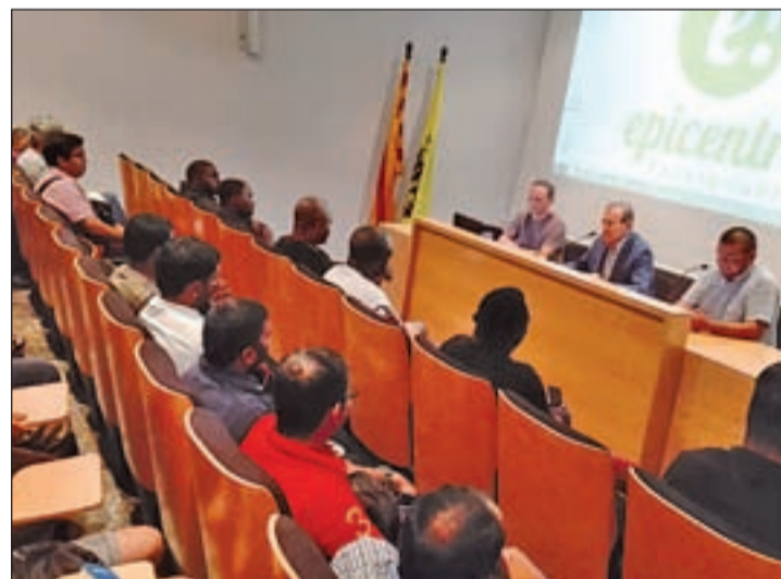
Va divulgar l'educació pública