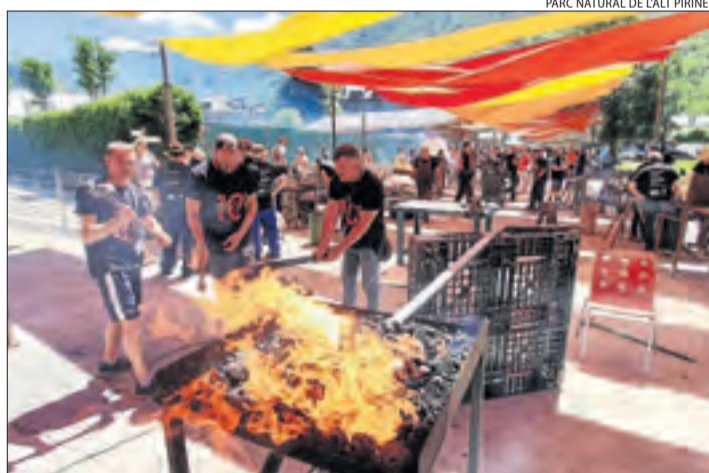
Una de les demostracions de forja que es van poder veure ahir.

forjadors, un taller infantil i per les danses tradicionals a càrrec de l'associació Alegria, d'Arles-sur-Tech de França. El bon temps va acompanyar la jornada d'ahir, per la qual van passar centenars de persones. Per avui està previst el taller infantil de manualitats amb la llana, visites guiades a la Torre de Castellarnau, l'obertura de la Carbonera i l'entrega de l'escultura elaborada pels forjadors participants en aquest certamen del Pirineu que reivindica un antic ofici molt present avui dia, a banda del mercat artesanal.