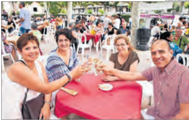
La festa, de caràcter rotatiu, al Pati de la capital de l'Urgell.