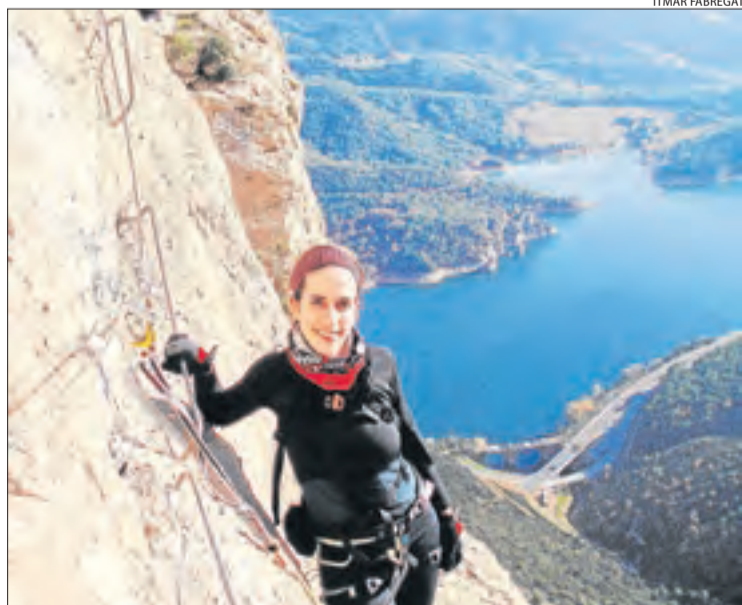
La via ferrada de la Regina, propera al pantà d'Oliana.

■ Els jubilats preparen ara demandes individuals que presentaran a finals d'aquest any si el Suprem no s'ha pronunciat o si resol en contra seu. Ja tenen quatre-centes denúncies de Lleida.