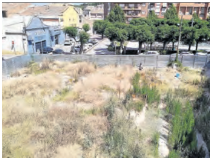
El solar on se sospita que hi ha l'origen de la plaga.

a la Guàrdia Urbana de Tàrraga, que van visitar el solar per comprovar l'origen d'aquesta plaga. "Ens van dir que instarien el titular de la parcel·la a fumigar la zona però aquí no ha vingut ningú", van explicar. A més, van denunciar que el consistori de Tàrraga no disposa d'atenció al públic les 24 hores del dia per donar resposta a queixes com aquesta de salut pública.