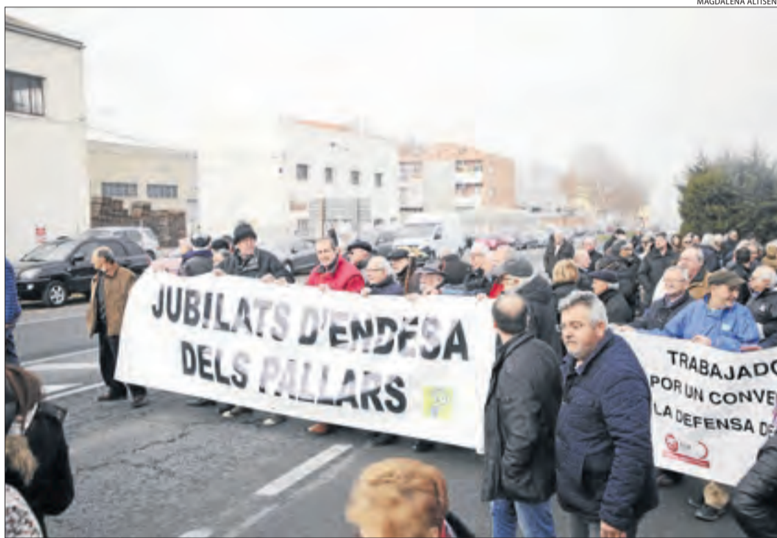
Jubilats d'Endesa, en una de les manifestacions del mes de gener passat a Lleida ciutat.

Al perdre la vigència el conveni marc laboral el 31 de desembre passat, els beneficis