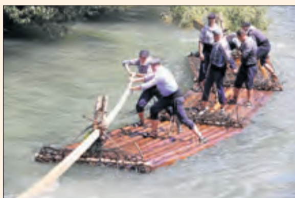
Un rai baixant per la Noguera Pallaresa.

Des de molt aviat, els raiers s'agruparan a la presa de Llania per fer els últims retocs a les basses i comprovar la navegabilitat abans d'iniciar el recorregut fluvial fins al Pont de Claverol. Allà els esperarà una multitud curiosa per aquesta festa que reivindica l'antic ofici de raier, mentre passen el matí entre el mercat artesà de proximitat, tallers de la Caravana Xisqueta per als nens i intervencions musicals. Després de l'arribada, dinar i concert de Premium.