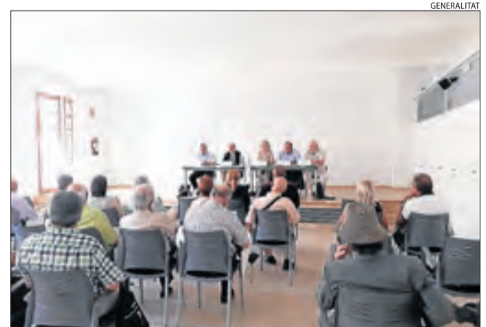
Imatge de la reunió de jutges de pau a Isona.