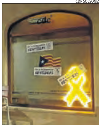
Protesta del CDR a Solsona.

■ ERC ha aconseguit 86 alcaldies, 21 més que en el mandat anterior. Destaquen les de Lleida ciutat, Tàrraga i Balaguer, les tres ciutats amb més població.