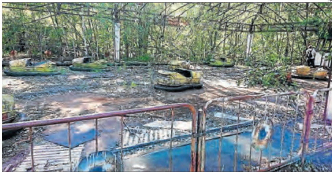
La zona continua comptant amb molts espais abandonats des del 1986.

Amb la sèrie d'HBO, les visites han crescut un 50% || Les empreses turístiques asseguren una neteja a fons en les últimes dècades