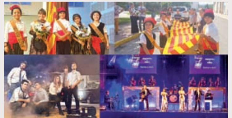
Les pubilles i els hereus, i els grups de dissabte