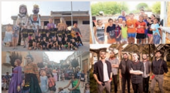
La Festa Major, en edicions anteriors

20.30 Ball llarg amb l'orquestra Junior's.