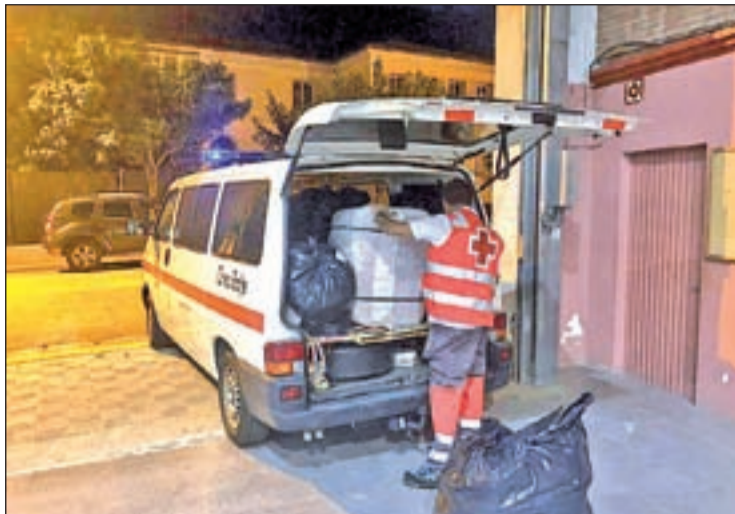
FOTO: @CreuRojaCAT / Creu Roja Catalunya va cedir material al grup

Tot i que ningú patí cap risc, els serveis d'emergències van optar evacuar-los. Així doncs, es va iniciar la recerca d'un lloc que tin-