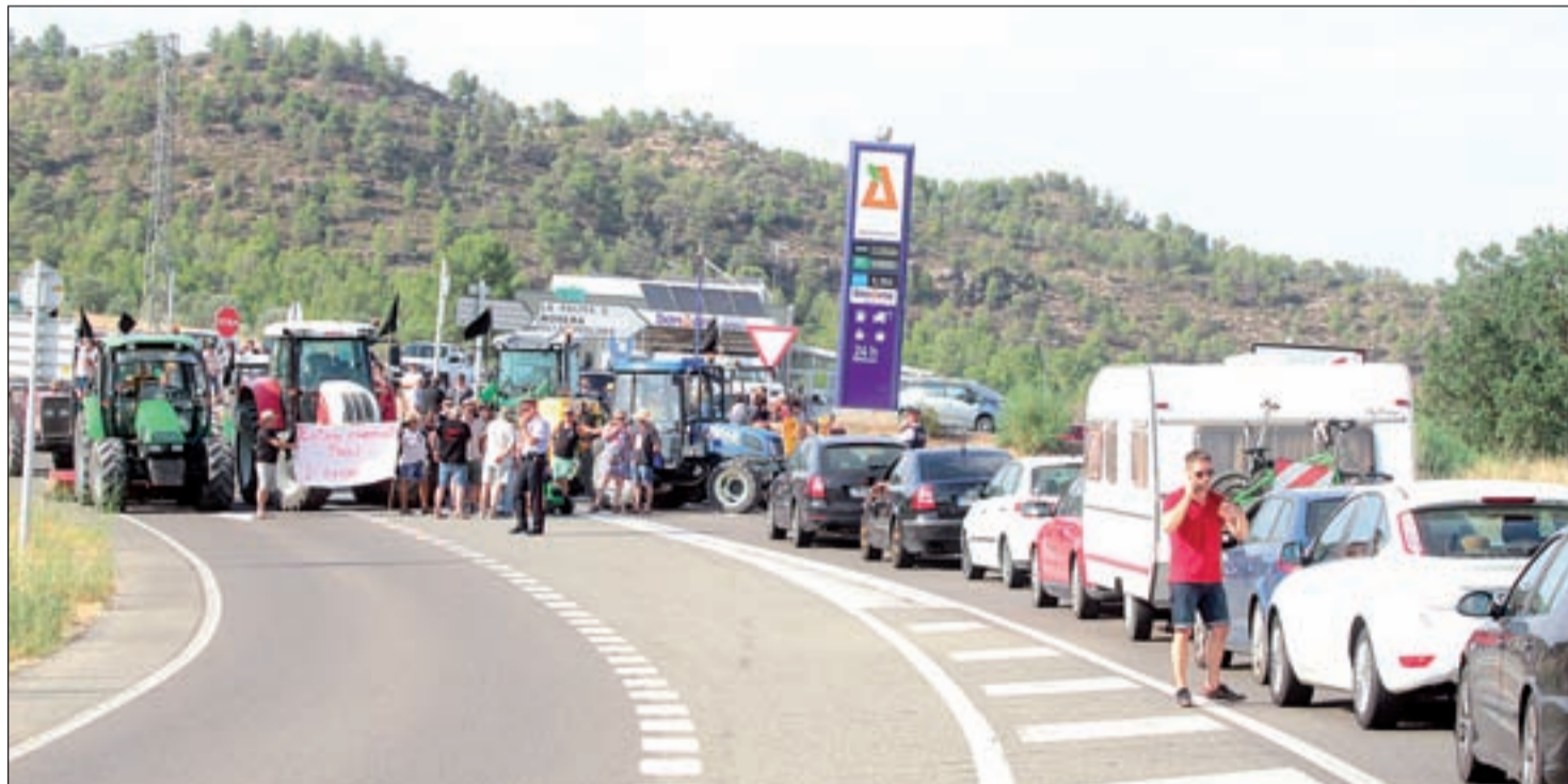
Hasta 17 tractores sirvieron para cortar ayer la carretera C-12 en Flix y reclamar las ayudas por el incendio de este año