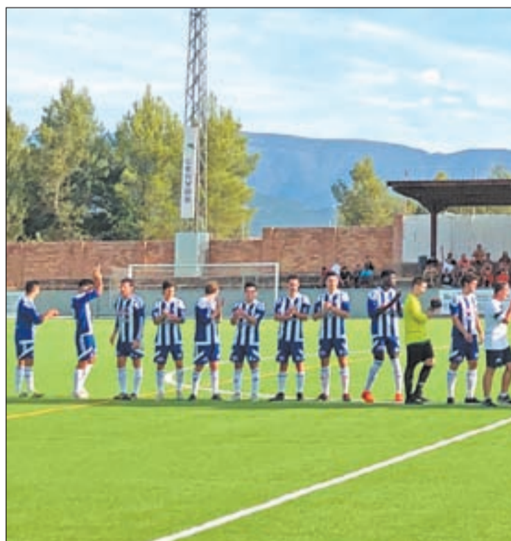
El Tremp antes del partido

y demostraron más físico durante todo el encuentro aunque los locales consiguieron empatarles. Los del Tàrraga vieron la primera