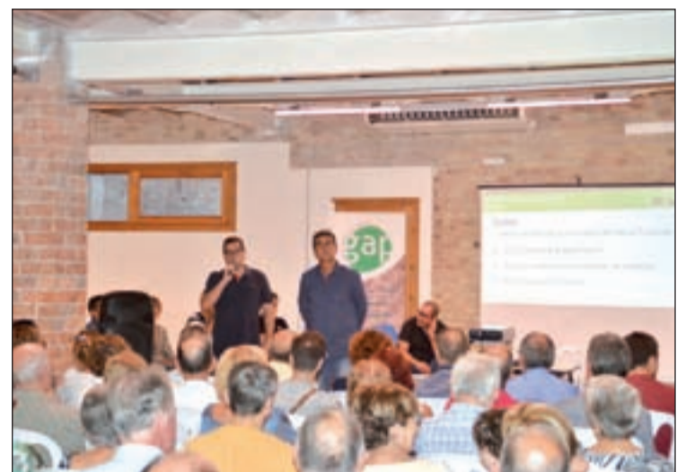
Hi ha previstes més jornades per explicar el nou projecte

Més de 200 persones van assistir a la reunió informativa convocada per GAP Cooperativa sobre el nou projecte de Tracjusa. Hi van assistir tant partidaris com detractors del projecte i persones sense una postura encara definida. L'acte va servir per explicar els principals canvis en el funcionament de la planta.