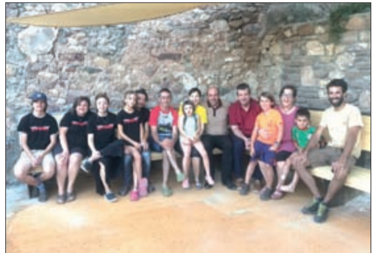
Aposten per fomentar nous models econòmics

L'Ateneu Cooperatiu de l'Alt Pirineu i Aran, liderat pel Consell Comarcal del Pallars Jussà, ha acompanyat la constitució