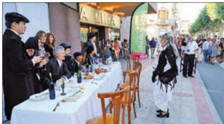
La compañía A Galet realizó una acción teatral

Además, la compañía A Galet realizó una acción teatral que dio