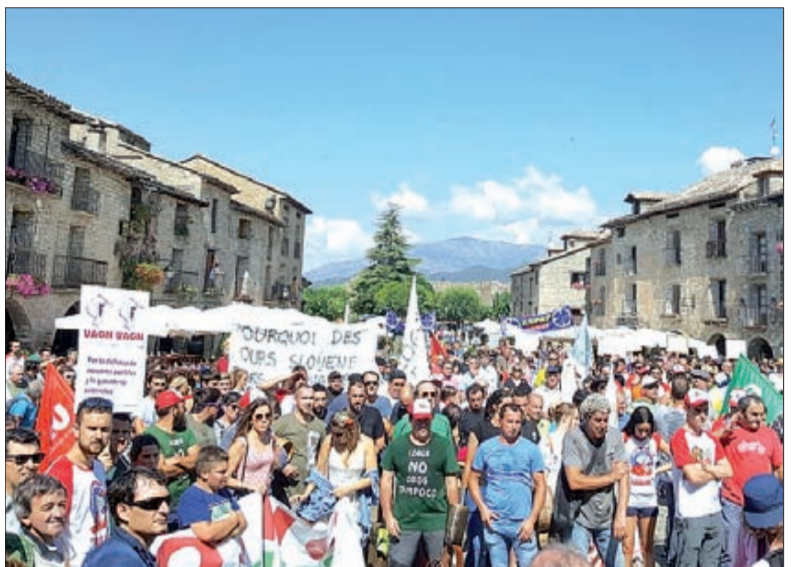
Denuncien la falta de suport de les administracions a la ramaderia extensiva

A l'acte, els portaveus de les associacions convocants van llegir un manifest per denunciar la falta d'un suport "real" de les administracions a la ramaderia extensiva i la existència "d'atacs constants" al sector per la presència de l'ós i del llop en boscos i zones de pasturar. Segons van explicar els portaveus, "existeix una total falta de sensibilitat des de les polítiques europees, nacionals i autonòmiques que, lluny de sumar suports, incorporen una dificultat darrera l'altra". El