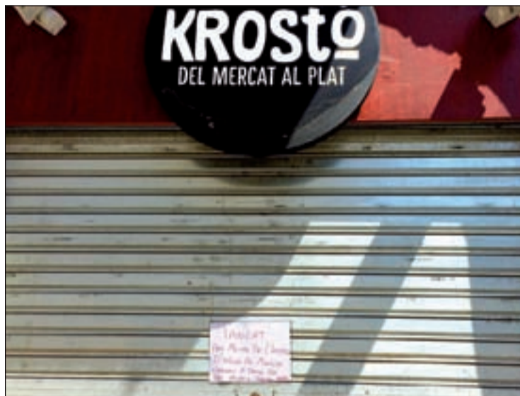
L'alcalde accidental reconeix que la xarxa és "antiga"

Segons l'empresa, es tractava del trencament de la canonada principal de 300 mm, que abasteix els municipis, per la qual cosa