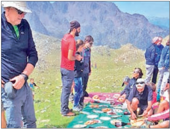
Imatge de la trobada de Tavascan de l'any anterior