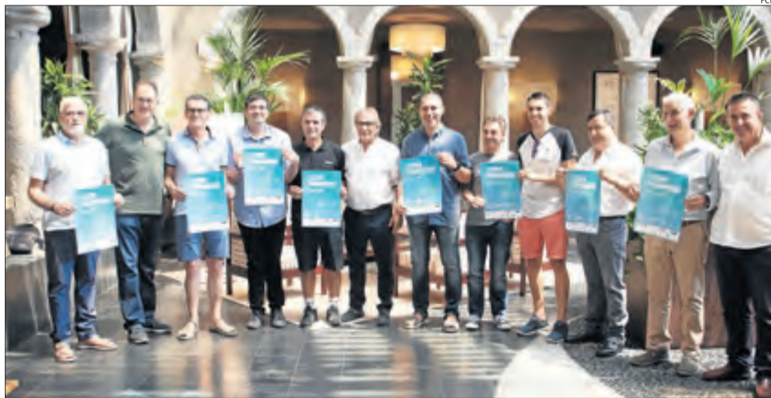
Els representants dels equips participants i directius de la Federació Catalana després del sorteig.