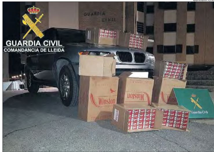
Intervenció de tabac de contraban a la Seu d'Urgell.

Segons la resolució, es considera provat que els acusats,