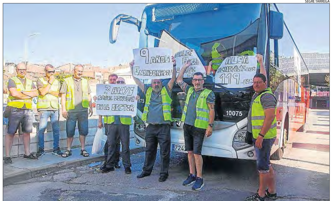
Alguns dels xòfers de Lleida ahir a l'estació de busos de Tàrrega.

El tercer i últim dia de vaga va afectar ahir el 70% dels serveis que la firma fa diàriament