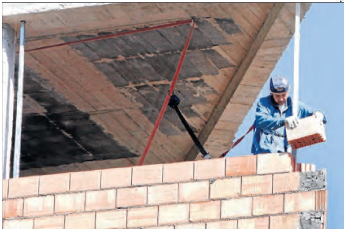
Imatge d'un treballador en la construcció d'un bloc d'habitatges.

Les comarques catalanes on els treballadors subscriuen menys contractes en un any || La província, a la cua de Catalunya