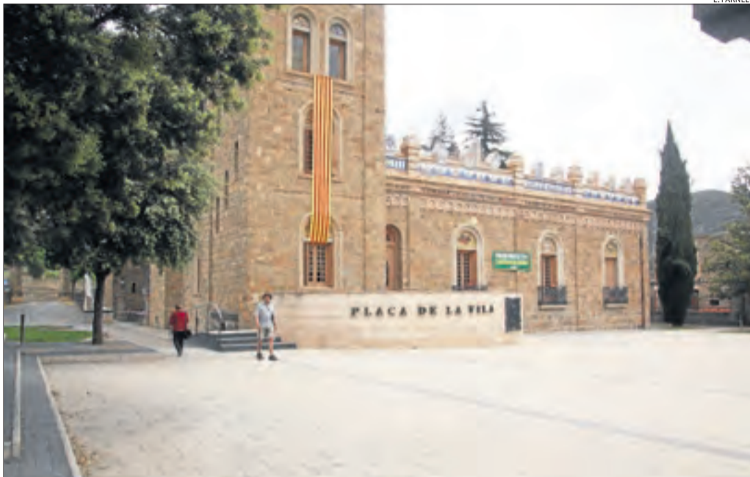
El conjunt patrimonial de Casa Mauri de la Pobla de Segur, seu de l'ajuntament.

En aquesta línia el projecte s'alinea també amb el trajecte del Tren dels Llacs i amb la mobilitat sostenible a les portes