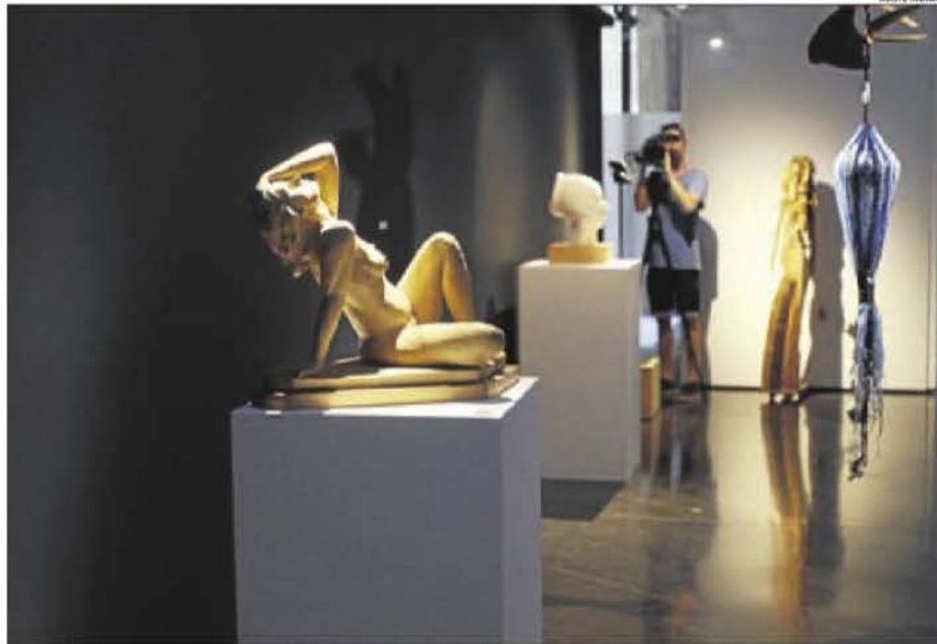
L'Institut d'Estudis Ilerdencs acull des d'ahir les 25 millors escultures del premi Sant Jordi.