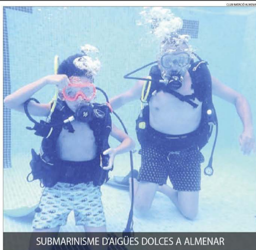
SUBMARINISME D'AIGÜES DOLCES A ALMENAR