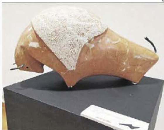
Una de les obres de Ramon Sanfeliu que pot veure's a Llavorsí.