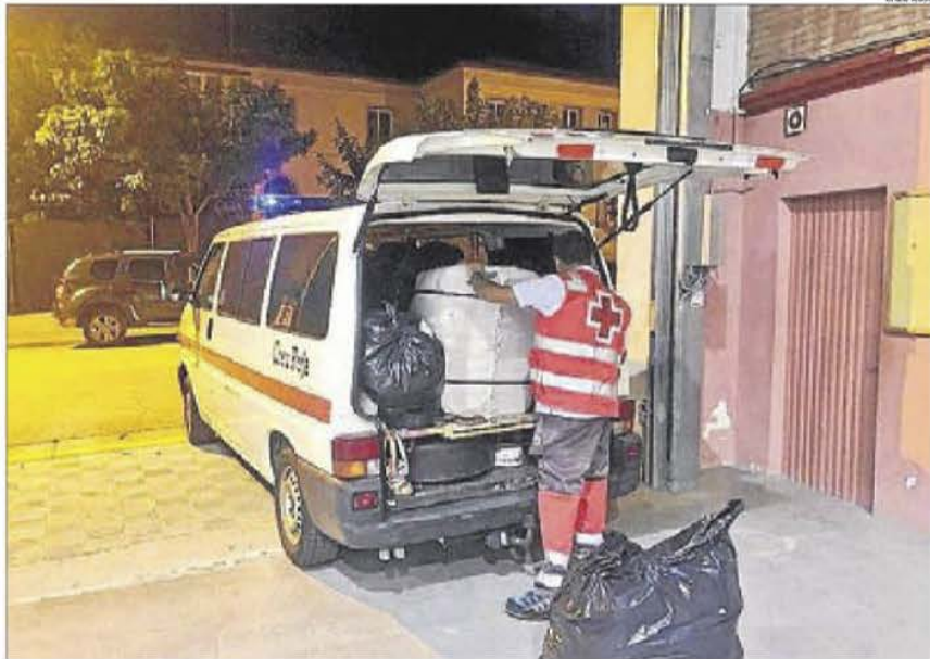
Creu Roja va aportar mantes i lliteres perquè el grup passés la nit al poliesportiu de Tremp.

El grup va passar la nit al poliesportiu de Tremp i ahir va tornar al campament a la Pobleta de Bellvei