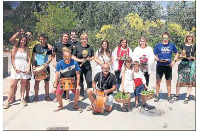
AJUNTAMENT DE VILANOVA DE L'AGUDA