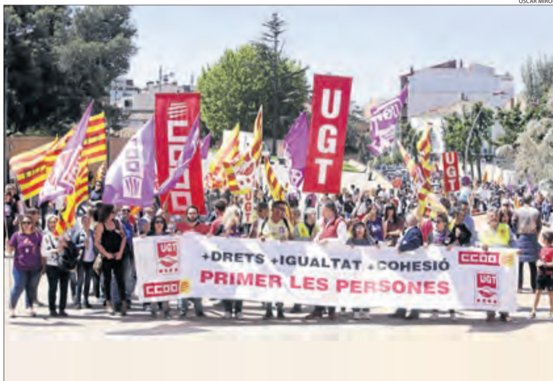
Imatge de l'última manifestació conjunta d'UGT i CCOO amb motiu del passat Primer de Maig.

Pel que fa al personal al qual s'aplica la normativa de funcionaris, Comissions Obreres és el sindicat amb més representació. Dels 237 representants elegits