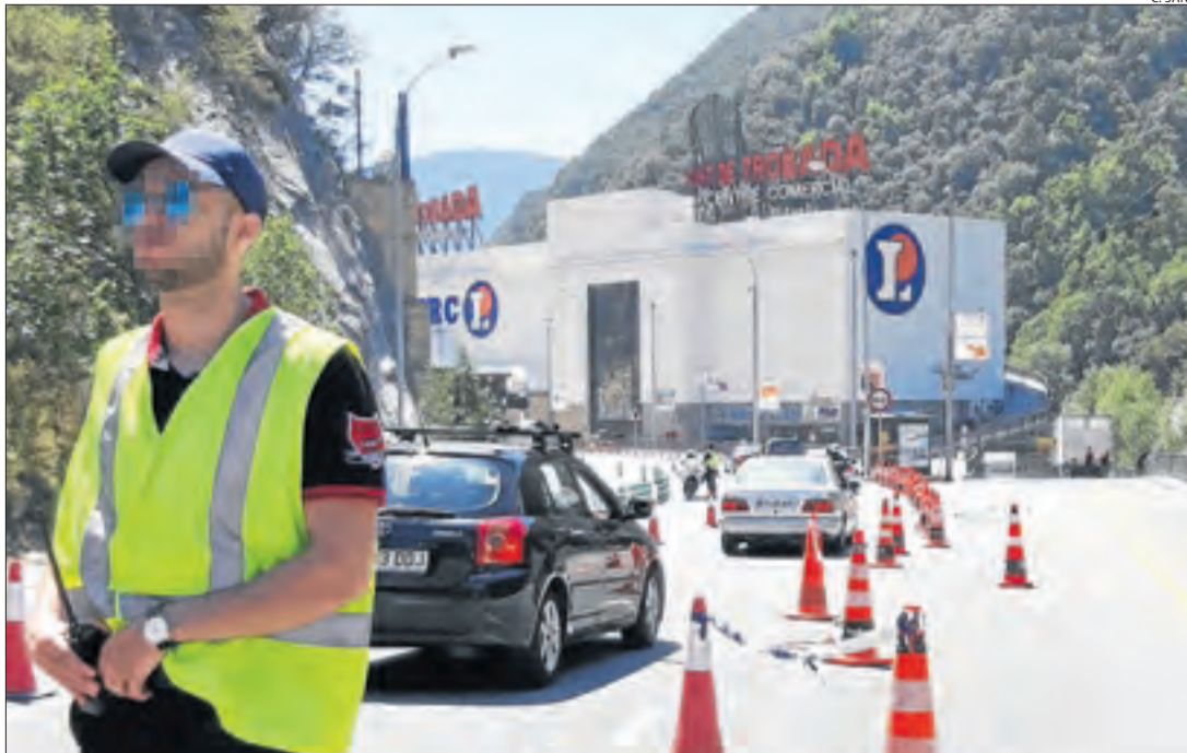
El centre comercial afectat obrirà portes aquest matí.