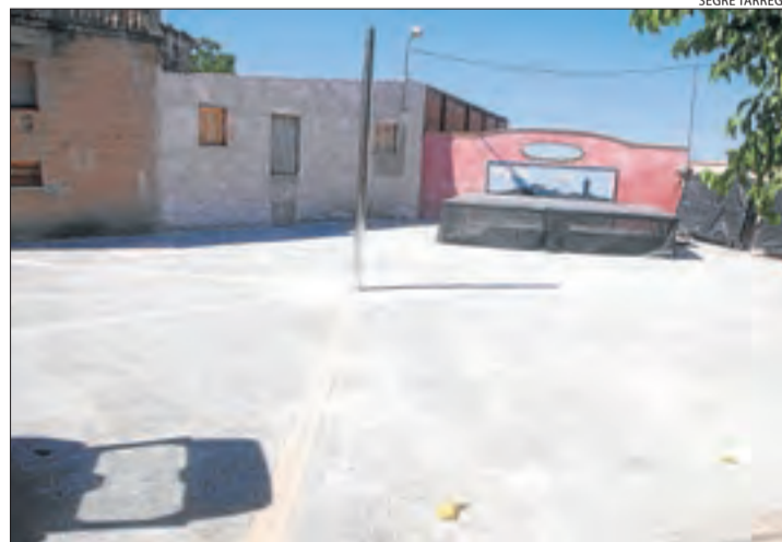
Imatge de la plaça de la Font de la Figuerosa ja renovada.

Així mateix, un artista danès que estueja a la Figuerosa està fent-hi un mural de grans dimensions amb una vista del poble al costat d'unes fulles de figuera amb la tècnica del trencadís. Aquest mural encara no està acabat i els tre-