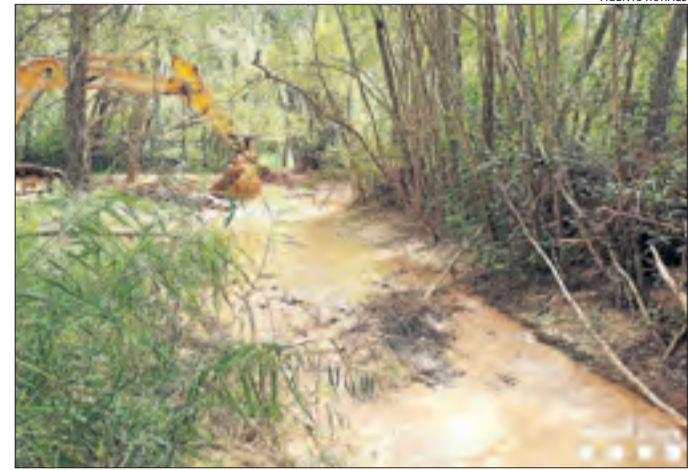
Imatge del riu Conques al seu pas per Gavet de la Conca.