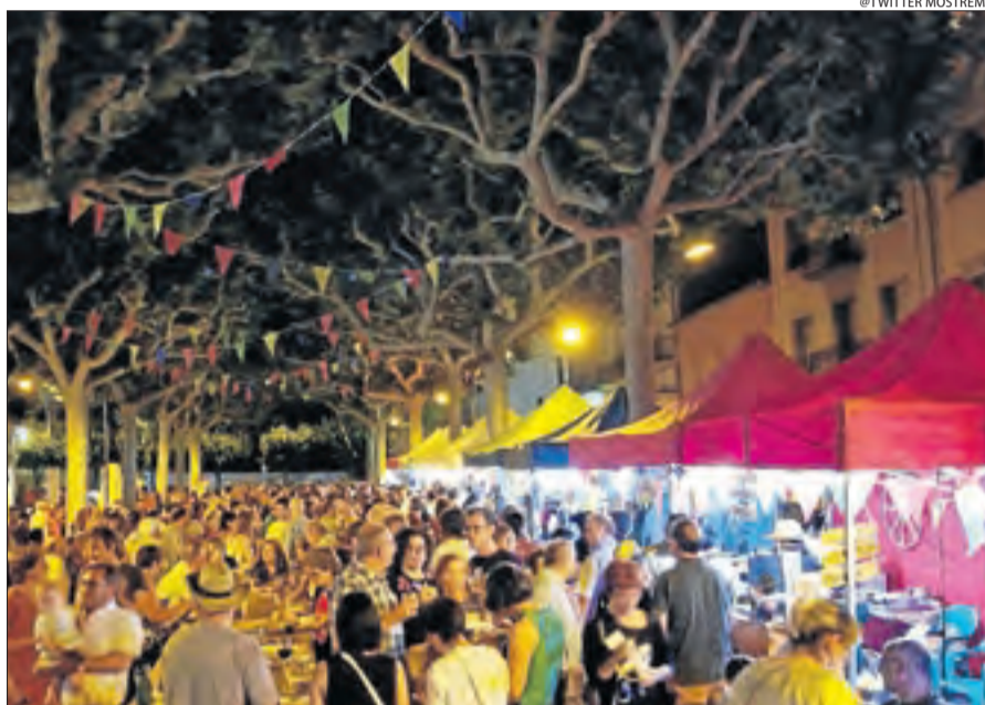
Centenars de persones van omplir la rambla de Tàrraga durant la Festa del Cinema.

L'actor Ewan McGregor tornarà al seu paper d'Obi-Wan Kenobi per protagonitzar una nova sèrie original per a Disney basada en l'univers de Star Wars , que podrà veure's a Disney+.