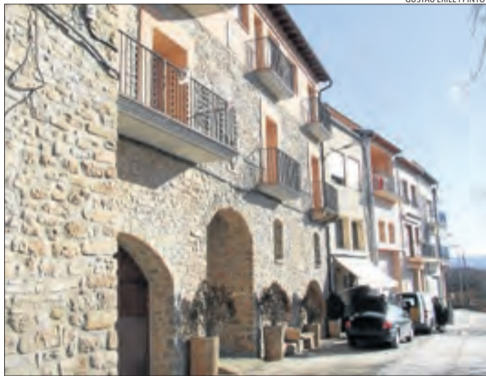
Vista de Palau de Noguera, un nucli que triarà representant.

Els representants dels pobles tenen un paper estrictament consultiu, sense responsabilitats de govern ni remuneració. La seua principal cometa és fer arribar al consistori les necessitats de cada nucli i les peticions i propostes dels seus habitants. Es tracta d'una figura que ja existia dècades enrere, encara que es tractava de persones elegides directament per l'equip de govern local de manera informal com a interlocutor amb els veïns. Fonts municipals van explicar que