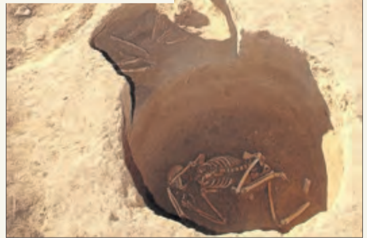
UNIVERSITAT DE LLEIDA