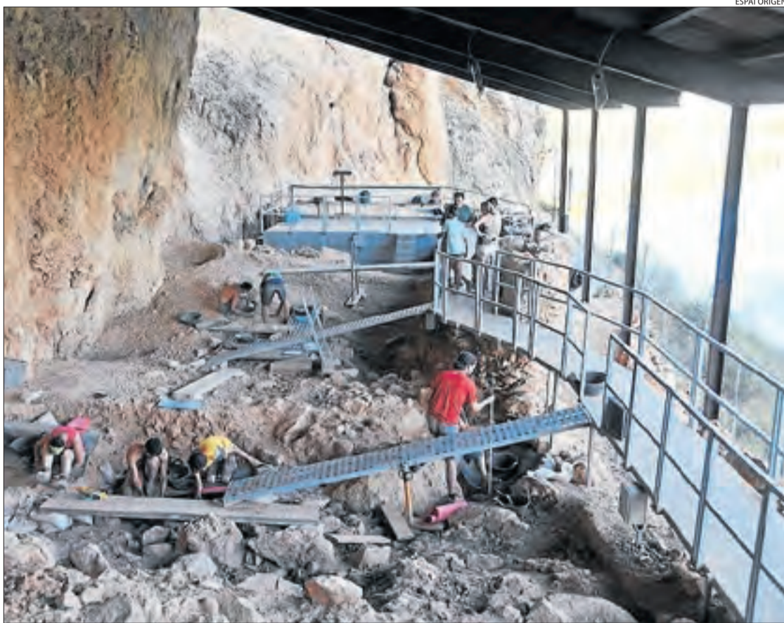
Excavacions al jaciment de la Roca dels Bous, a Sant Llorenç de Montgai, a la Noguera.

D'altra banda, el mateix equip d'arqueòlegs investiga també la Roca dels Bous, a Sant Llorenç de Montgai, un enclavament amb indicis de presència humana amb 60.000 anys d'antiguitat i que, al costat de la Cova Gran, mostra evidències del "gran control" del foc que tenien els nostres avantpassats.