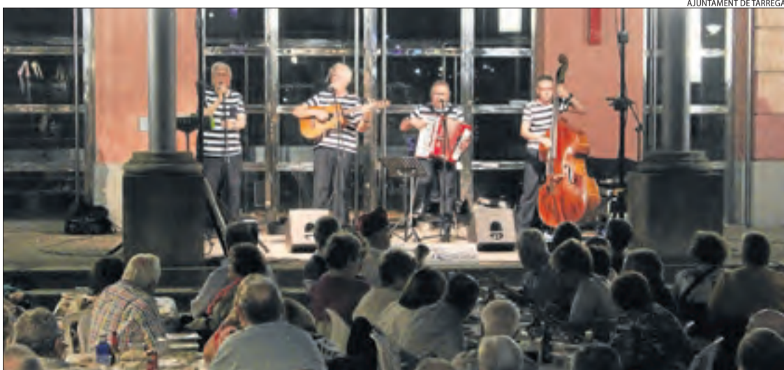
AJUNTAMENT DE TÀRREGA

tra banda, divendres a la nit Tàrraga va celebrar la Festa del Cinema a la rambla de la localitat, que es va omplir de centenars de veïns que van sortir al carrer per degustar els productes de les parades. Per postres, l'actuació del lleidatà Lo Pardal Roquer.