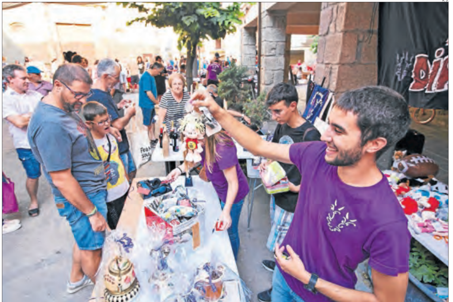
Participants al mercadillo d'objectes de segona mà celebrat ahir a la tarda a Sanauja.

El Mollerussa Second Hand Market tindrà lloc el 20 d'octubre amb uns 70 paradistes al pavelló firal. Els pagaments es faran amb molleusos, que es podran bescanviar per articles de comerços associats a Mollerussa Comercial. També el Mercat de les Puces de Montgai, que reuneix uns 15 paradistes, tornarà el 7 de setembre a Lo Carreró, obert a particulars i a artesans de tot tipus. També la Pobla preveu celebrar aquesta tardor el seu 13è mercat de segona mà, que se suma a la venda de material d'esquí utilitzat en el marc de Firaski. Incentivar el consum responsable i fomentar la reutilització i la recuperació del bon ús dels objectes són altres finalitats d'aquests mercadillos.