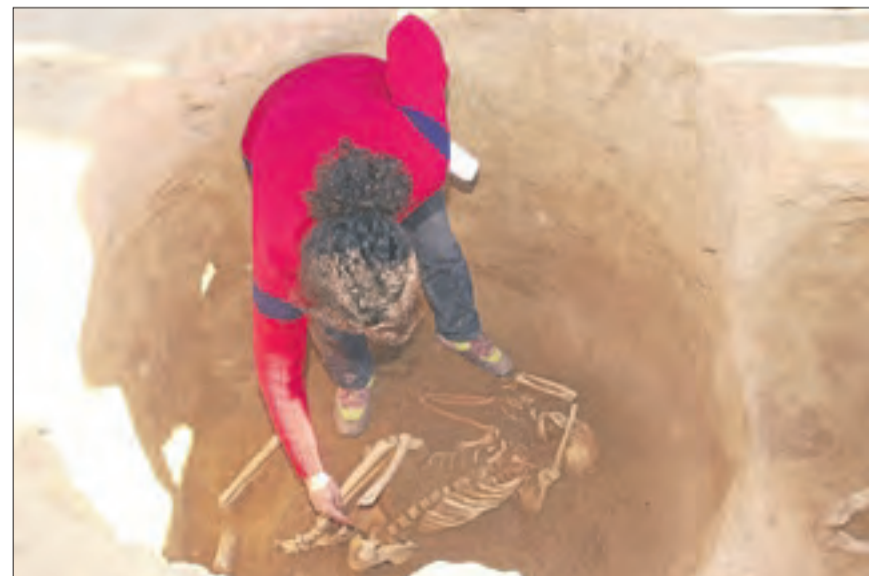
Una fossa amb restes humanes descoberta a les excavacions de Minferri.

A part de la seua ubicació, és l'època en què està datat. D'aquesta cronologia hi ha molt pocs jaciments a Europa. No crec que arribin a 20.