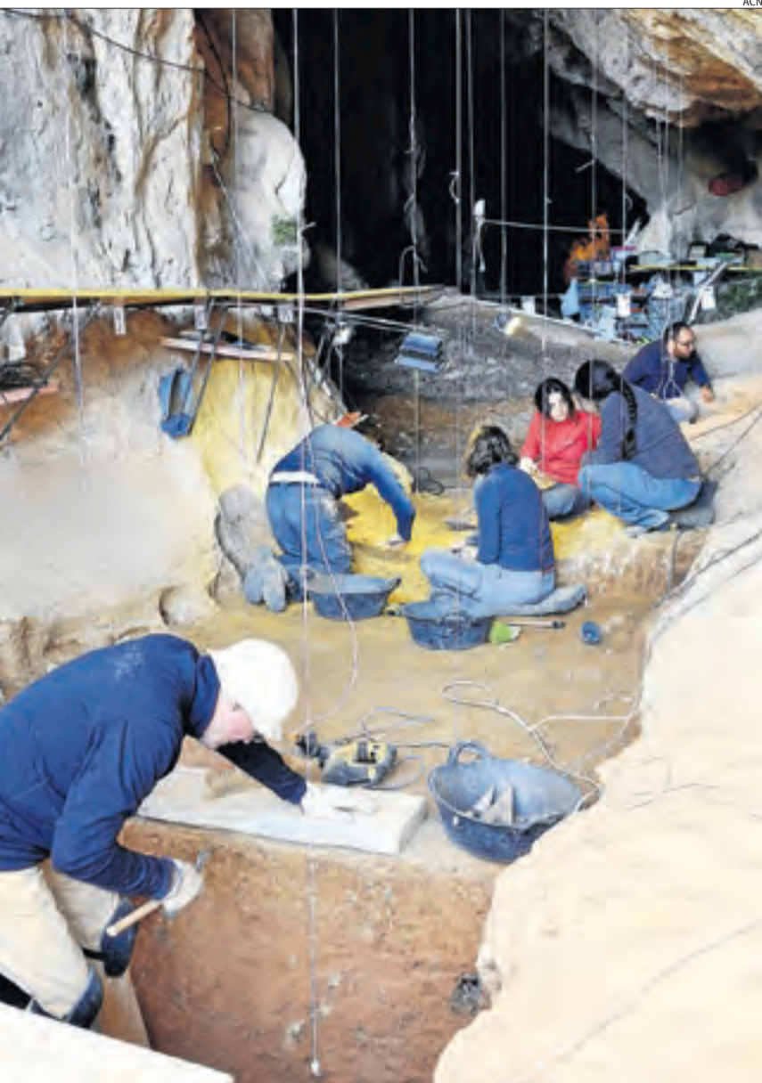
Arqueòlegs de l'equip de l'IPHES a la Cova de les Llenes.

A la Cova Gran de Santa Linya es van trobar restes de toros primitius, cosa que demostra que els neandertals que s'hi van assentar no només eren experts caçadors sinó que sortien de caça en grups molt nombrosos