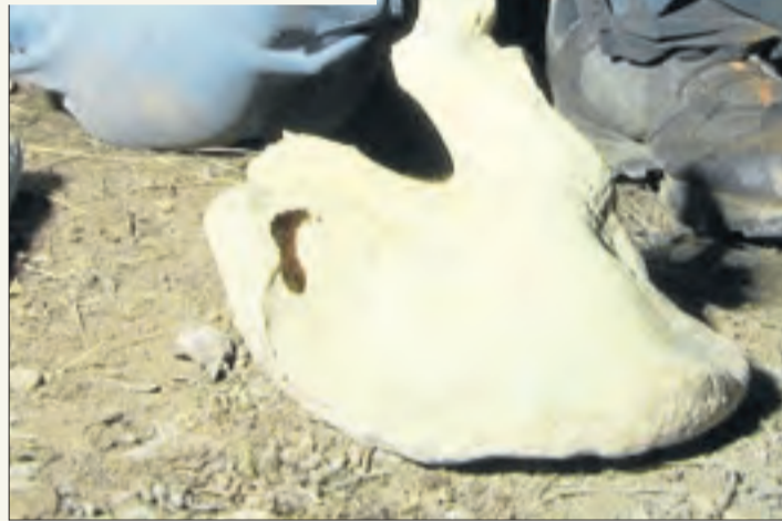
INSTITUT D'ESTUDIS ILLERDENCIS