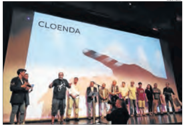
La cerimònia de cloenda del festival Mostremp.

| TREMP | El festival Mostremp va clausurar ahir la vuitena edició i es va consolidar com el festival de temàtica rural de referència a Catalunya. Prop de 1.500 persones van assistir a les projeccions dels curts i els actes paral·lels. L'últim dia del festival va obrir amb el tradicional vermut amb els directores i la matinal infantil. La secció Finestra d'Actualitat , fora de concurs, va presentar quatre curts de temàtica diversa, dos dels quals rodats a Espanya, un a Itàlia i un altre als Estats Units. Pel que fa als guardonats, el premi de la Secció Oficial va recaure en el film iranià Slaughter , de Saman Hosseinpour i Ako Zandkarimi. Està dotat amb 2.000 euros i patrocinat per Casa Torres. El film Kaset va rebre una menció especial. A la secció Pallars & Ribagorça , el guanyador va ser Tengo una cosa , de Pepe Luna. Aquest premi, de 500 euros, el patrocina el Geoparc. A la sec-