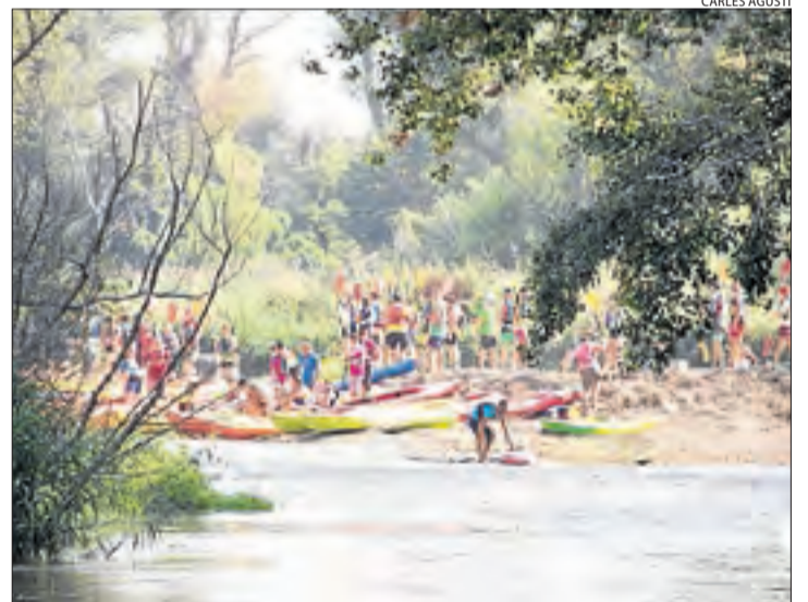
Imatge dels participants al descens de canoes pel Segre.

| LLEIDA | Les canoes van tornar a navegar pel riu Segre des de Torres de Segre fins a Seròs, passant per Soses i Aitona. Més de 400 persones van recórrer els 13 quilòmetres de riu i, a l'arribar, els assistents van poder entrar de forma gratuïta a les piscines. L'organització va explicar que aquest és un acte de germanor i de coneixement del territori i el medi natural.