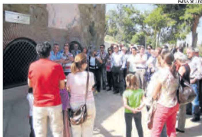
PAERIA DE LLEIDA

El Museu de l'Aigua de Lleida ha programat aquest estiu diverses visites guiades per conèixer el patrimoni de l'aigua. Durant els mesos d'estiu, es poden visitar els pous de gel, el dipòsit del Pla de l'Aigua o el Campament de la Canadenc, on es pot veure l'exposició Aigües del món , una col·lecció d'ampolles d'aigua provinents d'una gran varietat de països.