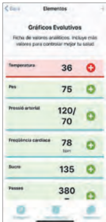
Detall d'una fitxa amb dades de l'aplicació.

■ Permet videoconferències i inclou un sistema de missatges similar a WhatsApp.