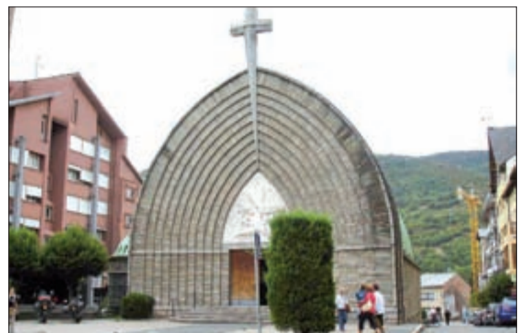
Imatge de l'església del Pont de Suert