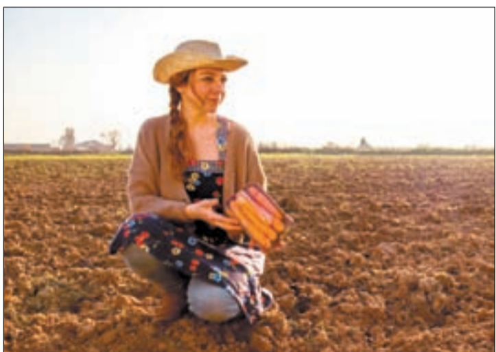
Imagen del videoclip de la canción 'Menjar plàstic'

ACUSACIONES A PLÁCIDO DOMINGO el barítono Carlos Álvarez afirmó ayer sobre las acusaciones de acoso sexual al tenor Plácido Domingo que "huele a venganza de otras instituciones" y que por su relación con el artista madrileño está "seguro" de que "en ningún caso hubo una situación que no fuera consentida". Álvarez aseguró que "cada uno es dueño de lo que hace con su privacidad" e insistió en que hay que "tener cuidado a la hora de convertirnos en una sociedad ajusticiadora".