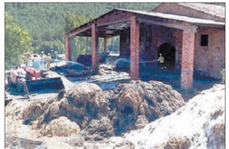
Els bombers van remullar la zona

Els efectius del GRAE de Bombers van rescatar ahir al Congost de Mont-rebei un jove de 25 anys que havia caigut per un desnivell d'uns 5 metres. Els serveis d'emergències van ser alertats per la noia que l'acompanyava a les 13.55 hores i informava que no podia sortir. Finalment, va ser localitzar i rescatat. No va resultar ferit.