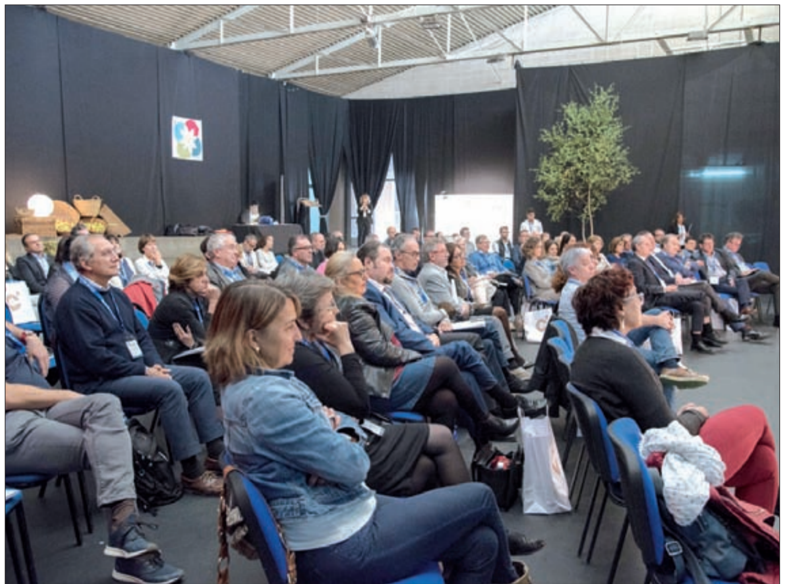
Imatge de la Jornada per a l'excel·lència celebrada l'any passat a la localitat d'Esterrí d'Àneu