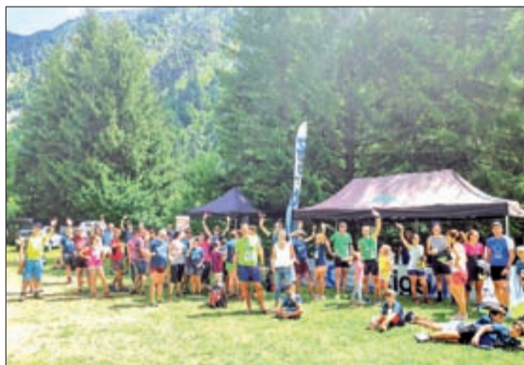
Van participar unes 70 persones en l'activitat

Dissabte passat la Psoritrail 2019 va reunir una setantena de participants a la Vall de Boí, un esdeveniment que recorre un circuit de 10,8 km amb 526m desnivell que va de Barruera al Balneari de Caldes de Boí. La Psoritrail vol donar a conèixer aquesta malaltia de la pell que afecta un nombre important de persones.