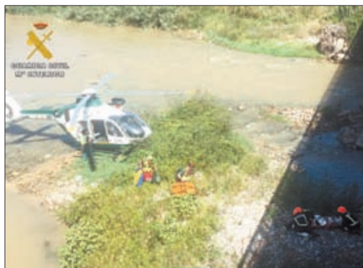
Moment del rescat de l'home de 50 anys de Fraga

Un home de 50 anys, veí de Fraga, va ser rescatat ahir després de caure de forma accidental pel pont vell de la localitat al cabal del riu. Els efectius desplaçats van comprovar que estava conscient, però no es podia moure. La unitat aèria de la Guàrdia Civil el treure del lloc i una ambulància el va traslladar a l'Hospital Arnau de Vilanova de Lleida.