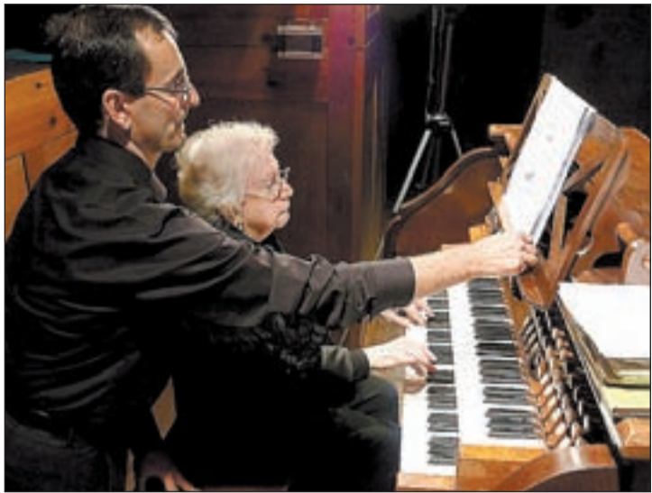
Montserrat Torrent actuará como solista en Cervera