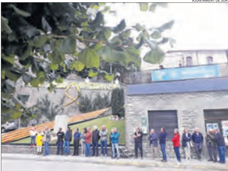
AJUNTAMENT DE SORT