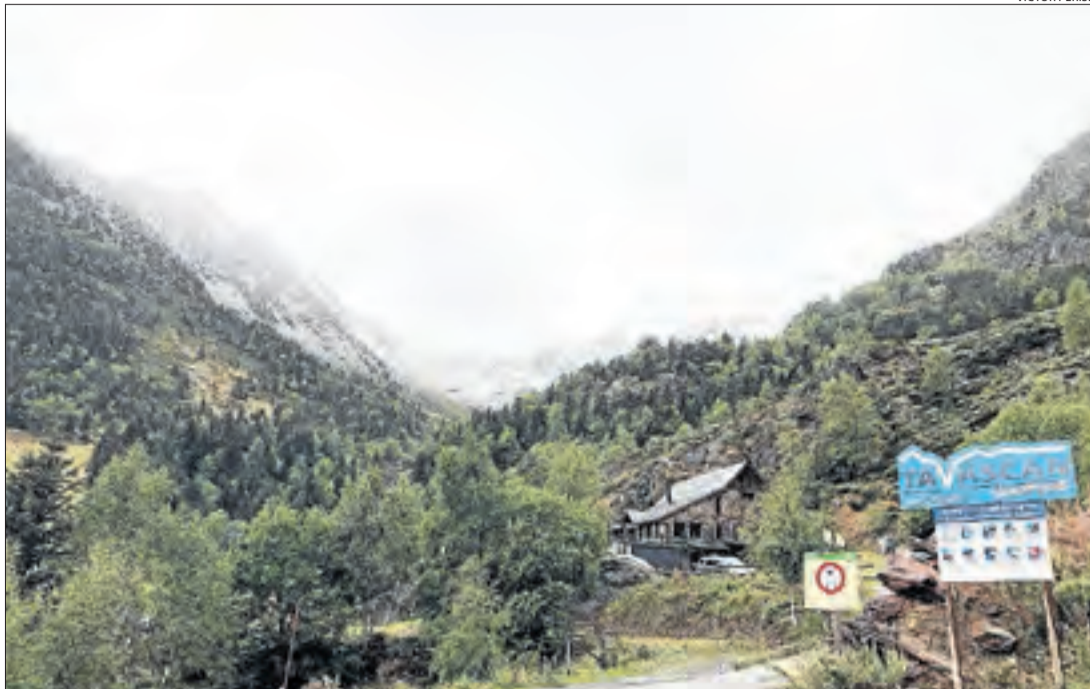
Imatge del refugi Pleta del Prat de Tavascan i l'estació d'esquí.