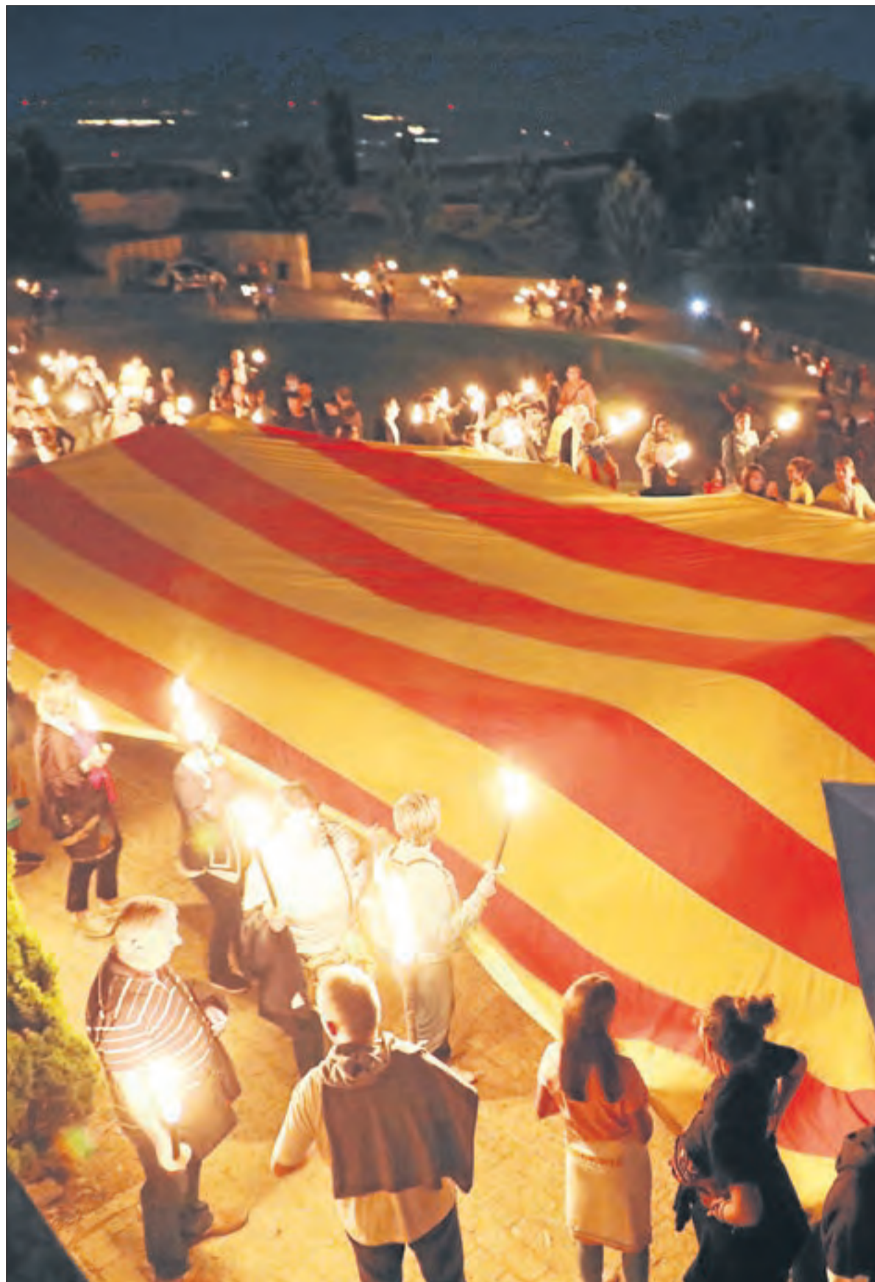
Lleida. Una enorme estelada tancava la Marxa de Torxes de la capital, que va ser amenitzada amb gralles, tambors i balls de