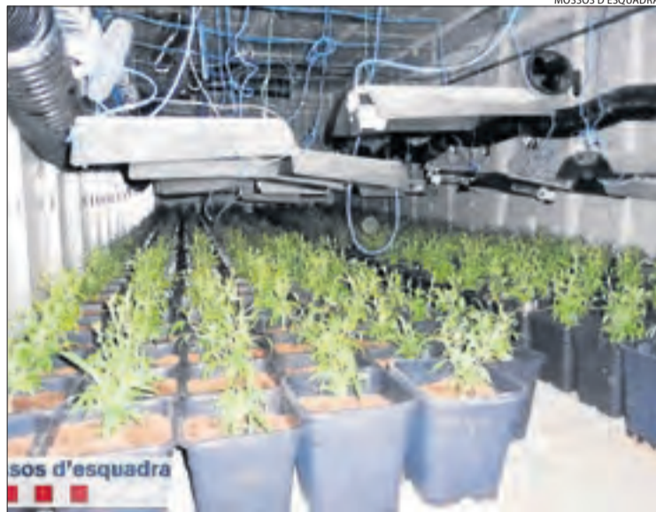
Plantació intervinguda el mes de març passat a Torà.

La memòria del Ministeri Públic també assenyalava que hi ha un augment de les formes tradicionals del tràfic de drogues. En general, les diligències de la