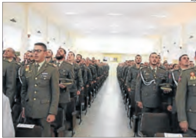
Moment de l'acte inaugural del curs escolar a l'AGBS.