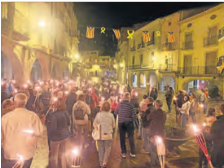
Les Borges Blanques. La Marxa de Torxes també va desafiar la pluja a la capital de les Garrigues.