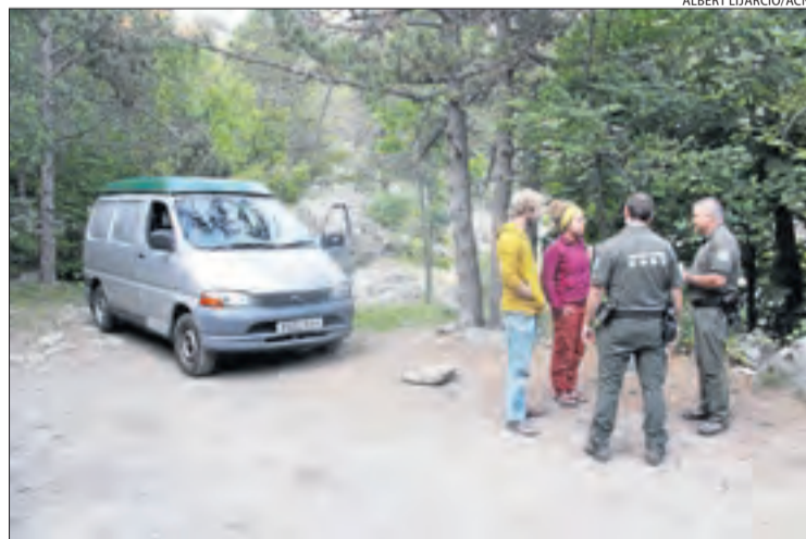
Dos agents rurals informen excursionistes de la normativa.

L'objectiu és dissuadir possibles pernoctacions, ja que, a banda d'infringir la normativa, l'activitat genera una problemàtica de saturació i de degradació dels aparcaments habituals als accessos a l'entorn. En aquests controls, els Rurals han informat sobre la regulació en un total de 231 ocasions a l'agost.