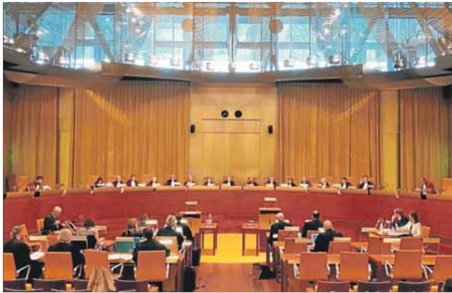
El Tribunal de Justícia de la UE, amb seu a Luxemburg

El Tribunal de Justícia de la Unió Europea (TJUE), amb seu a Luxemburg, ha admès a tràmit un recurs de l'Assemblea Nacional Catalana (ANC) contra la decisió de la Comissió Europea de rebutjar sancionar l'Estat espanyol per "la vulneració dels drets polítics i civils del poble català i per extensió les minories nacionals i els seus representants". En el ple del secretariat nacional de l'entitat, celebrat el 14 d'abril de l'any passat, es va aprovar la presentació d'una iniciativa ciutadana europea (ICE) a l'executiu comunitari per demanar la sanció en virtut de l'aplicació de l'article 7 del Tractat de la UE a l'Estat espanyol. Aquesta iniciativa ciutadana es va presentar conjuntament amb el Consell per la República Catalana, el 7 de maig del 2019, però la comissió no la va admetre a tràmit.