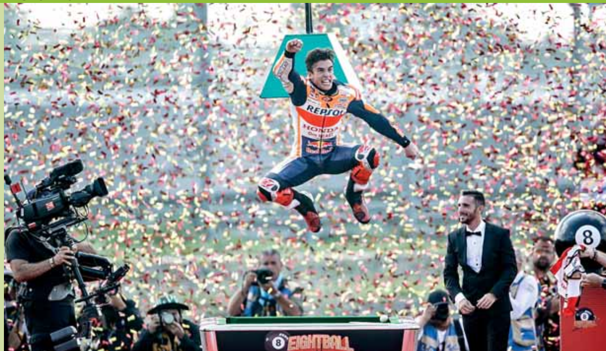
Marc Márquez saltant damunt d'una taula de billar per celebrar la vuitena bola mundial