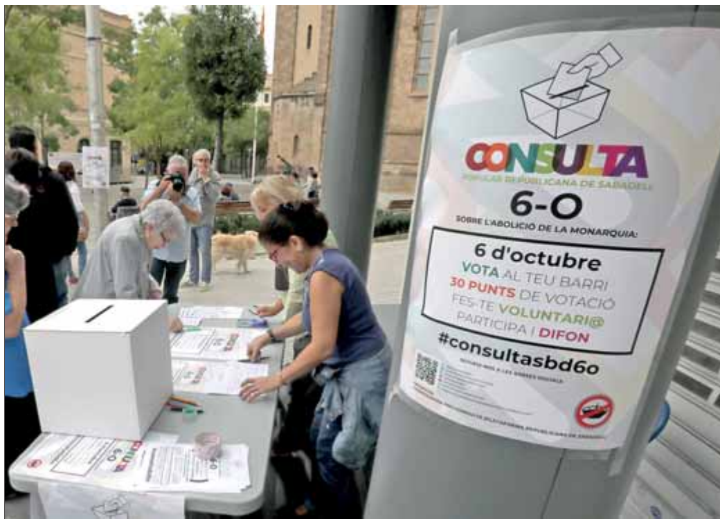
Persones votant a la plaça de l'Ajuntament, on es van registrar algunes cues

El concepte de transversalitat es confirmava fent un recorregut pels barris perifèrics. Mentre que en les