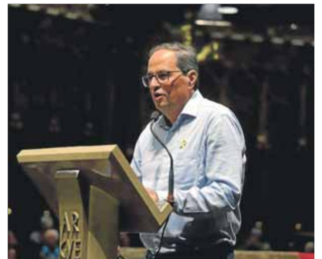
El president de la Generalitat, Quim Torra, dissabte a Montserrat

En una crítica velada al seu soci de govern d'Esquerra, Torra avisa: “No eixamplarem cap base de manant permís i esperant que se'ns doni.” ■