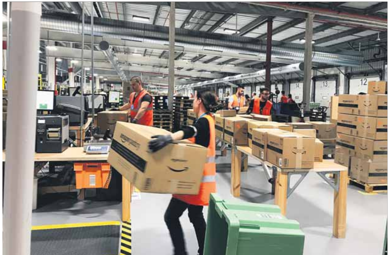
Treballadors d'un centre logístic del Baix Llobregat

També la consultora Savills Aguirre Newman assenyala que durant l'any es podrien haver comercialitzat a tot Catalunya prop de 600.000 m 2 , després que la contractació en el segment industrial s'hagi recuperat durant els mesos de juliol i setembre. Així, durant el tercer trimestre de l'any, la contractació va ser de