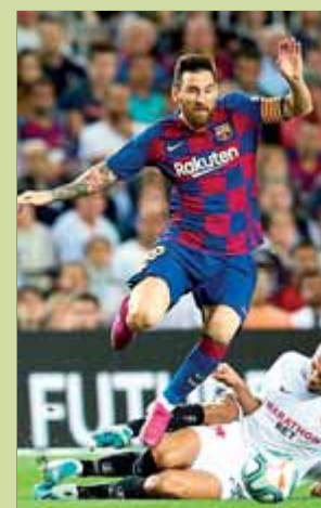
Messi, en acció

Tres gols entre el 27' i el 35' van decidir un partit que va acabar 4-0