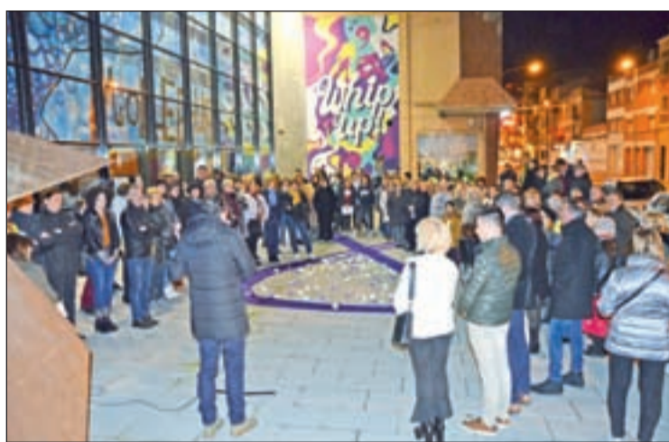
A Mollerussa van posar roses per denunciar-ho