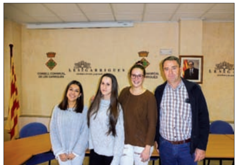
Les tres treballadores que s'incorporen a la feina

al Servei d'Informació i Atenció a les Dones i a l'Equip d'Atenció a la Infància i Adolescència. Cal recordar que aquest programa és una iniciativa europea que té la finalitat de facilitar l'accés dels joves al mercat laboral. S'adreça, concretament, a joves d'entre 16 i 30 anys, empadronats a l'Estat, en situació d'atur i que no estiguin rebent cap mena de formació.