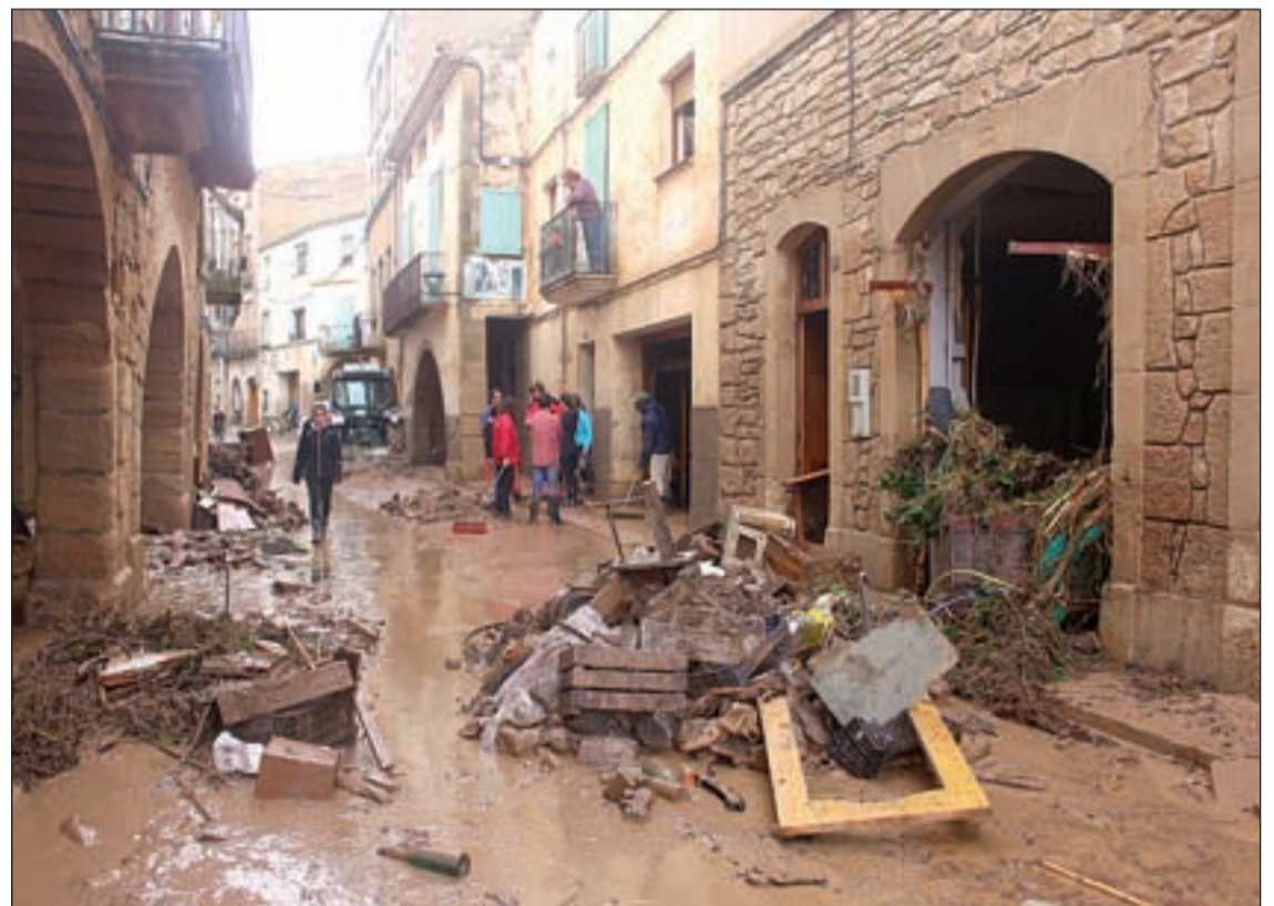
Imatge d'arxiu dels desperfectes causats pels aiguats al poble de l'Albi

El Reial Decret preveu ajuts a corporacions locals, unitats familiars o particulars, comunitats de propietaris i establiments industrials i comercials per fer front a les despeses d'emergència ocasionades per la gota freda. El termini per presentar les sol·licituds va finalitzar dissabte, 23 de novembre i la direcció general de