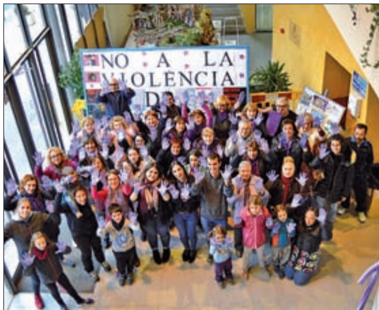
Uns 60 veïns van participar en l'acte de denúncia