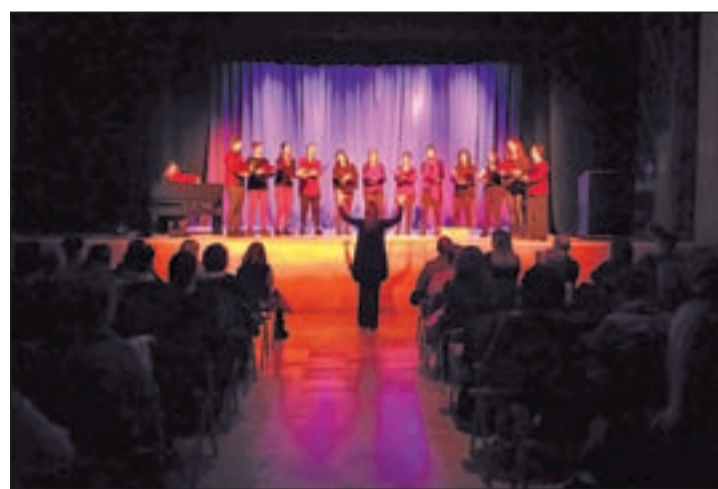
La música i el cinema centren els actes a Alcarràs