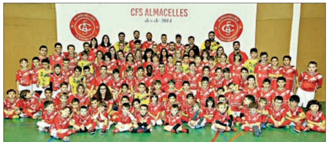
Imagen de grupo de los diferentes conjuntos del club de la localidad del Segrià