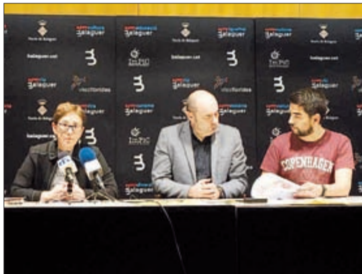
Els resultats del projecte es van presentar ahir

Ha estat l'opció més votada, amb un total de 371 vots (347 online i 24 presencials), d'un total de sis propostes. Les actuacions tenen previst un pressupost de 39.094,19 euros. En segon lloc, hi ha l'adequació de la vorera del Pavelló Molí de l'esquerra per millorar-ne l'accessibilitat, que va rebre el suport de 353 vots i pel qual hi ha un pressupost previst de 59.070,39 euros. I la tercera opció és l'adequació i millora del parc infantil del col·legi Montroig, la qual va rebre 301 vots i un preu de 71.742,34 euros. Aquestes tres propostes seran incloses dins del pressupost de l'exercici