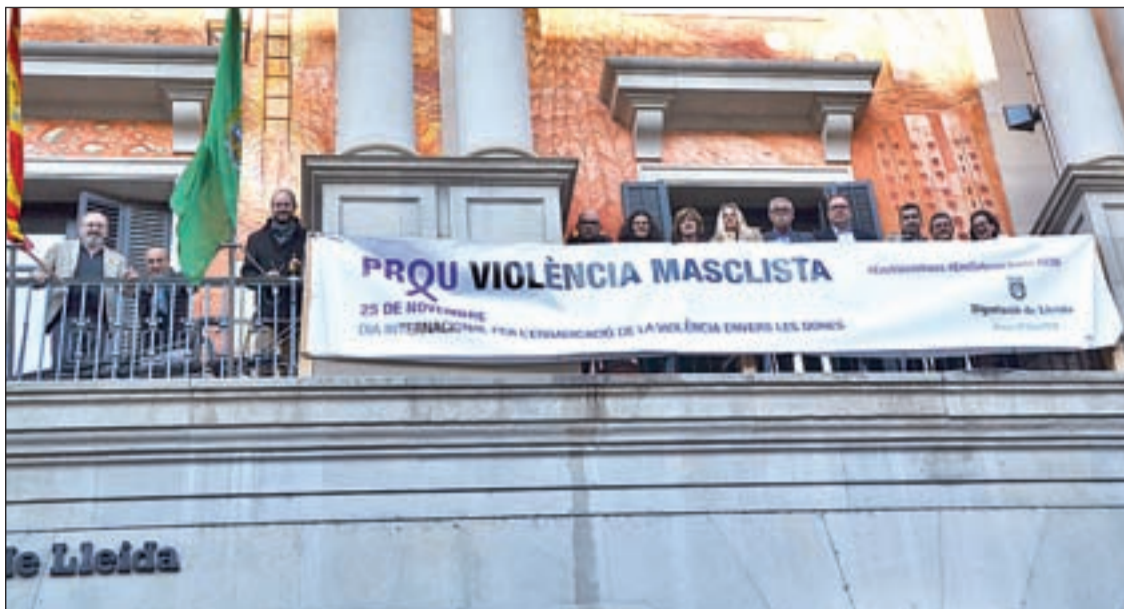
La Diputació penja una pancarta per condemnar les violències masclistes cap a les dones