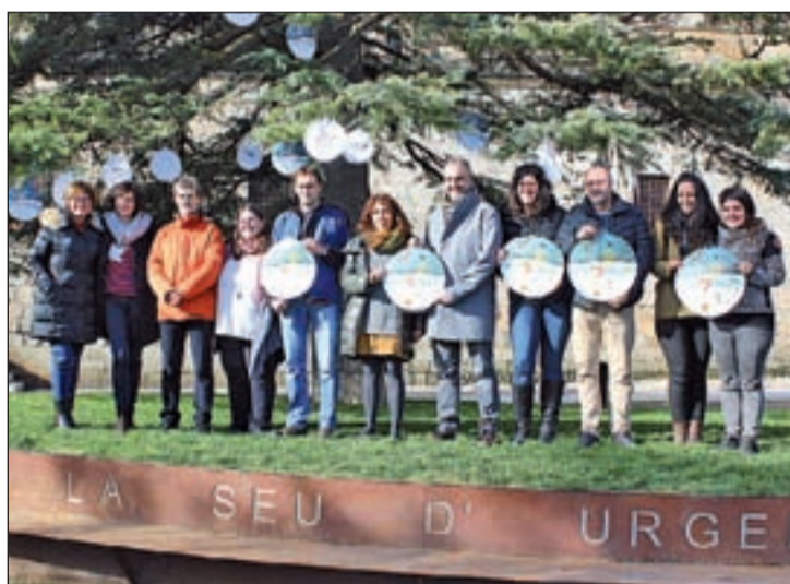
L'ajuntament presentà ahir la programació nadalenca

L'alcalde de la Seu va avançar que el programa nadalenc recull enguany "un total de 49 activitats per gaudir el Nadal a la nostra ciutat, que s'adrecen a totes les edats i gustos". "Del 30 de novembre al 6 de gener, urgellencs i visitants podran gaudir del Món Màgic de les Muntanyes sota l'atenta mirada dels minairons.