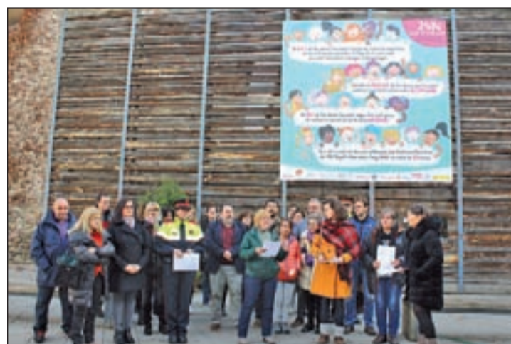
A la Seu d'Urgell s'han atès durant el 2019 87 dones