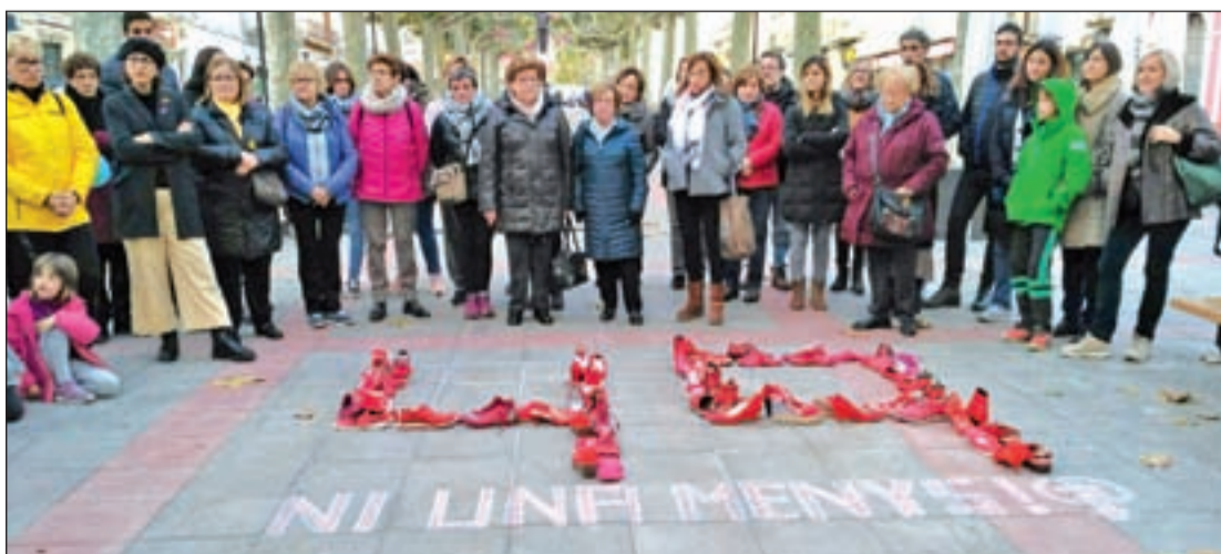
Imatge de les 49 sabates que es van mostrar ahir a Tremp pel 25 de Novembre