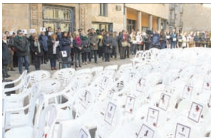
Cadires buides per denunciar les dones assassinades