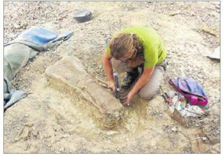
Un dels ossos fòssils de dinosaure trobat a Suterranya.

D'altra banda, es va anunciar una nova campanya d'excavacions abans d'acabar l'any al jaciment ibèric del Molí de l'Espigol de Tornabous (Urgell).