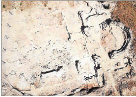
Vista de la planta de l'església santonista medieval d'Alguaire.

A més de les 157 intervencions d'investigació científica, s'han desenvolupat 861 excavacions preventives (aquelles obligatòries en projectes d'obres o en actuacions que podrien afectar restes arqueològiques o paleontològiques) i set d'urgència (aquelles en llocs en els