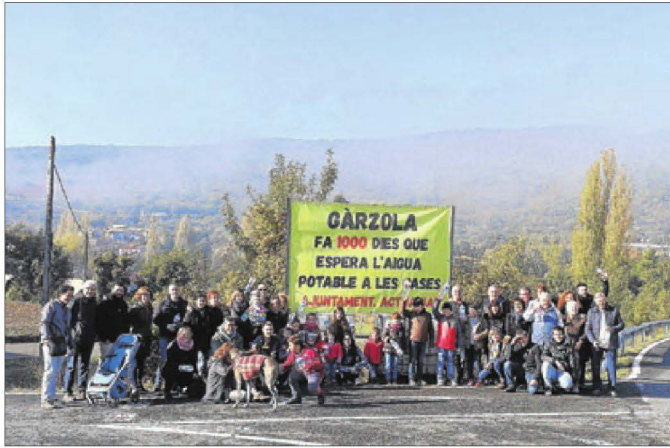
La plataforma de veïns de Gàrzola durant una protesta en l'encreuament de Vilanova de Meia.