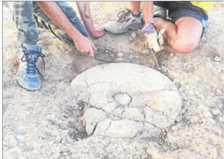
Pedra de molí apareguda a les excavacions al Pla d'Almatà.

quals no es coneixia l'existència de jaciment).