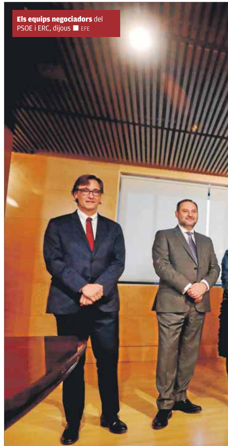
Els equips negociadors del PSOE i ERC, dijous

Tal com estan les coses, ERC es mostra més cauta que un PSOE que es vol menjar els torrons de la investidura abans de Nadal. Els republicans demanen no córrer, no fos cas que se'ls ennuaguesin a tots. ■