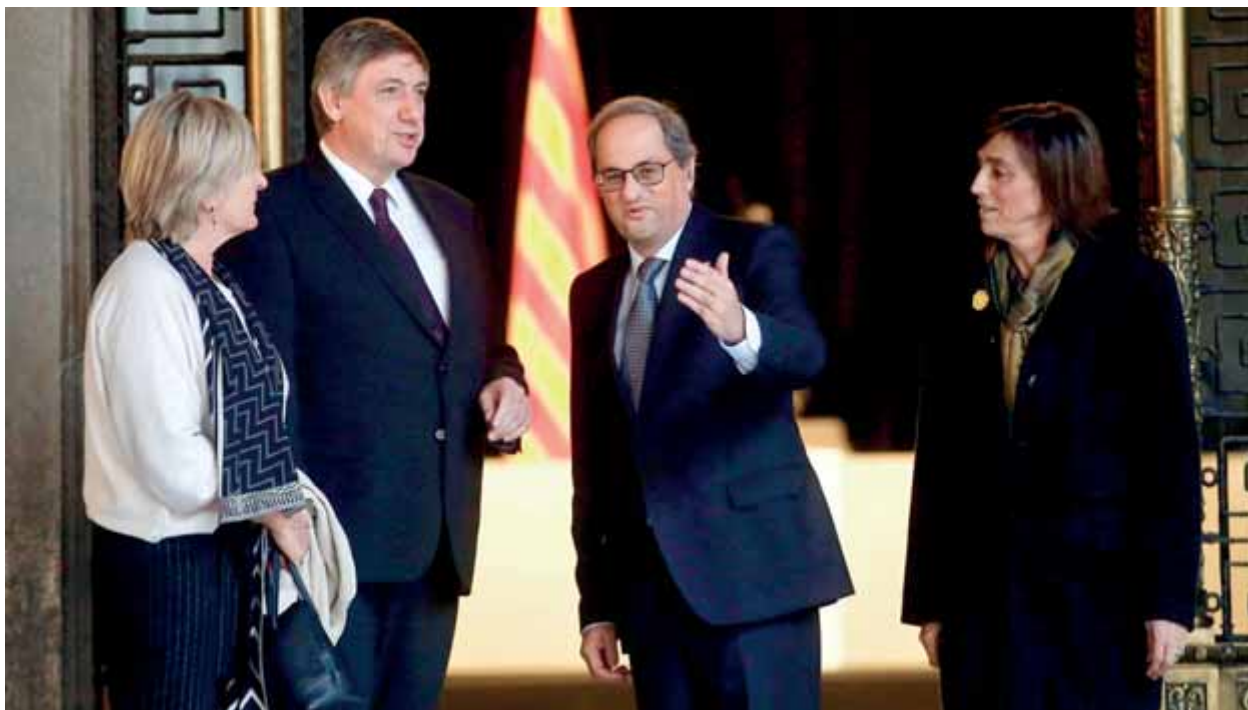
El president de Flandes, Jam Jambon, i el català, Quim Torra, amb les seves respectives esposes, ahir a la Generalitat

PITJOR • La sentència a Torra, les vistes sobre els exiliats i la decisió europea sobre Junqueras compliquen més el calendari