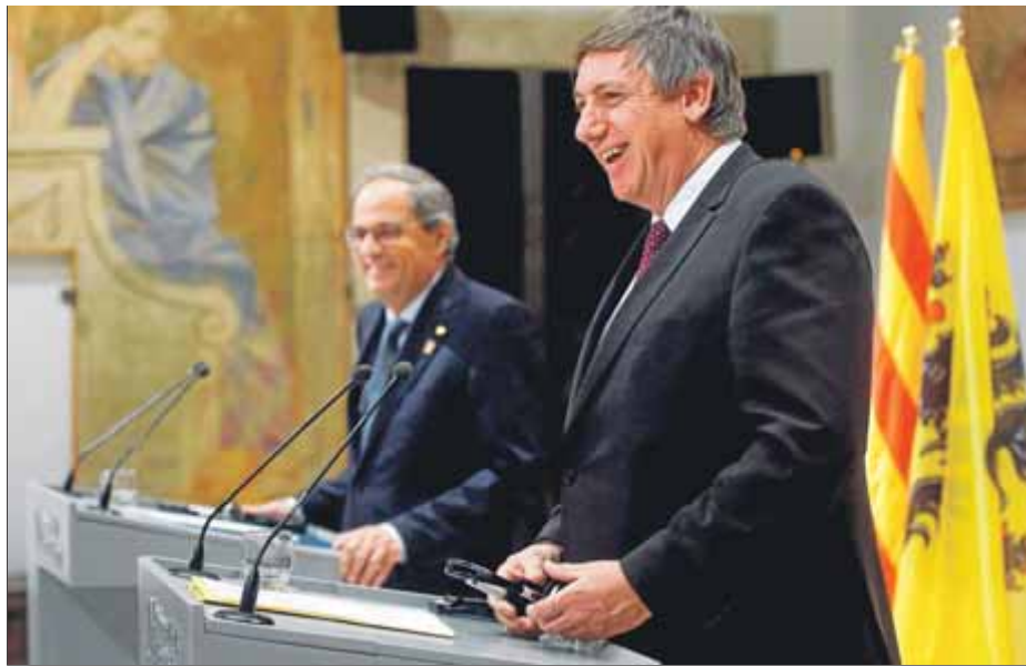
Els presidents Quim Torra i Jan Jambon, en la seva compareixença davant dels mitjans

El document, però, no s'atura aquí. Torra i Jam-