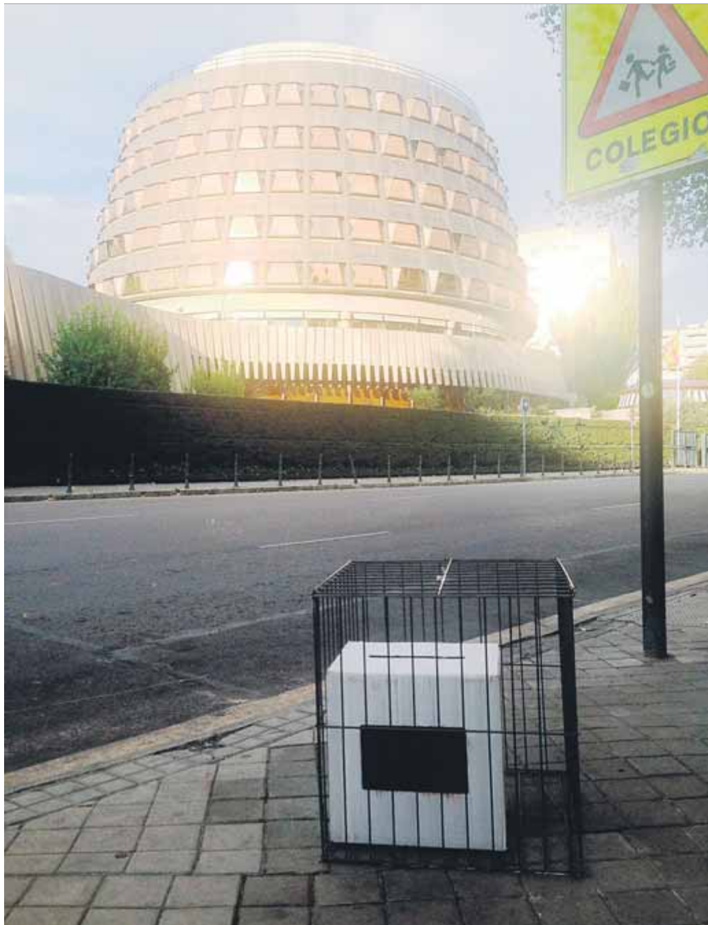
El grup d'ERC al Congrés ja va publicar el 2014 aquesta il·lustrativa foto davant del TC

Anem a pams. La mare dels ous, evidentment, és l'autodeterminació, i l'article 150.2 és un dels que s'han perfilat com a possible via per transferir les competències estatals per organitzar un referèndum. La petició, de fet, ja es va fer i es va rebutjar el 2014 al Congrés, però fins i tot en el cas que es repetís i ara sí que tirés endavant, Jaria recorda que "això no canvia la posició del TC", que des del 2008, arran del pla Ibarretxe, ha estat molt restrictiva en aquesta matèria. Una possible transferència podria ser impugnada, de fet, sense ni tan sols la necessitat que s'hi impliquessin el PP o Cs: n'hi hauria prou amb un recurs dels 54 diputats de Vox, que segons ell tindria el "previsible" suport del TC, que "ha limitat molt l'abast del 150.2". El professor, fins i tot, considera que el tribunal, vista la jurisprudència, ni tan sols deixaria con-