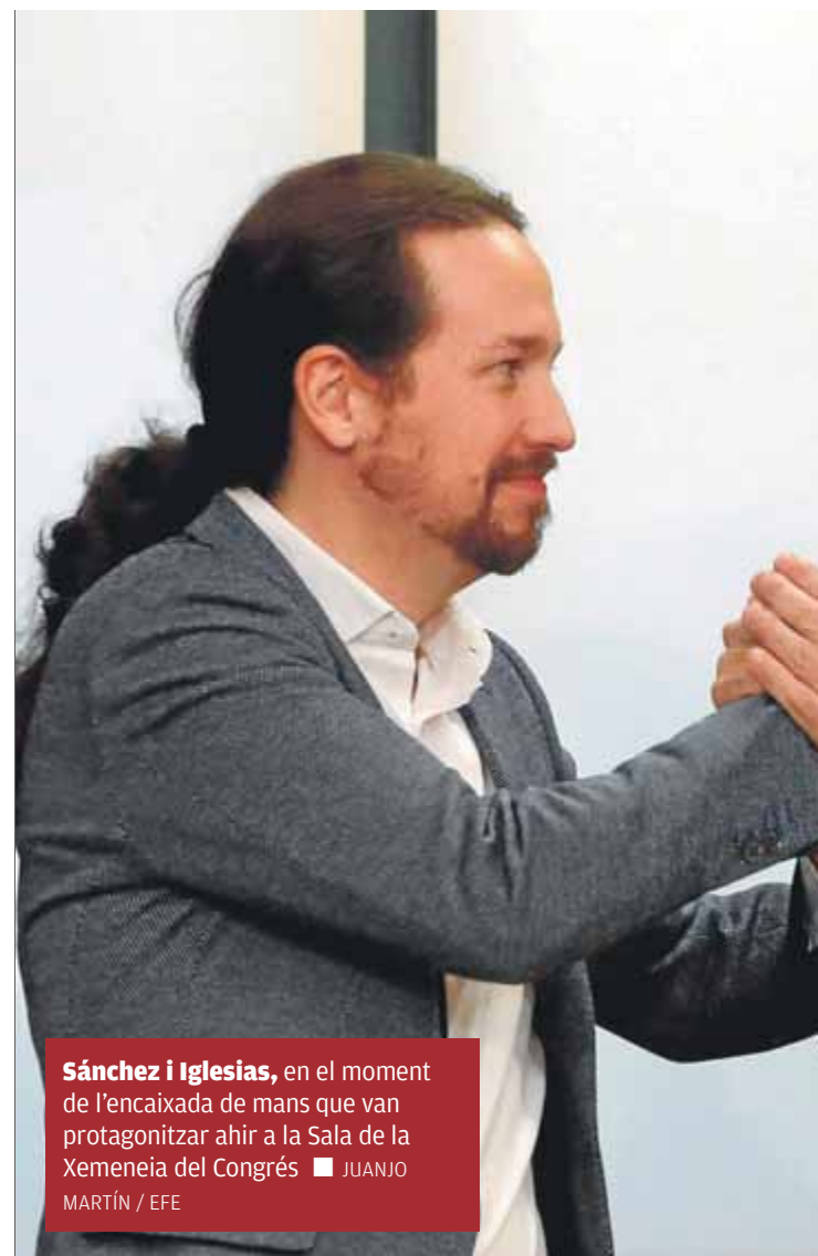
Sánchez i Iglesias, en el moment de l'encaixada de mans que van protagonitzar ahir a la Sala de la Xemeneia del Congrés

El programa de la coalició PSOE-Podem inclou la derogació de tota la reforma laboral que Rajoy va aprovar el 2012. Si fins ara el PSOE prometia la fi dels seus “aspectes més lesius” i prou, amb Iglesias a bord el Consell de Ministres no farà un decret de derogació –no es fa així–, però aprovarà una nova reforma laboral que derogui la norma que volia satisfer la troika . Al mateix temps, el govern no nat promet “les mesures normatives necessàries per posar sostre a les pujades abusives dels preus del lloguer en zones de mercat tensionat” com