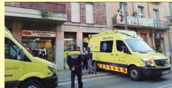
Els serveis d'emergències, al lloc dels fets ■ T.S.