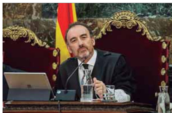
El jutge Marchena ha de dirimir com acata el TJUE