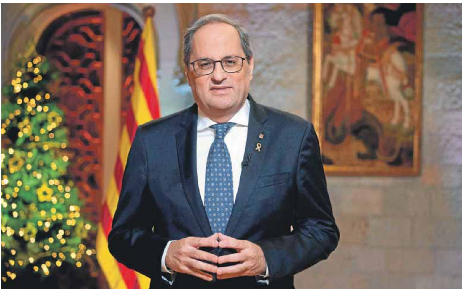
El president de la Generalitat, Quim Torra, pronunciant ahir el missatge institucional de Cap d'Any