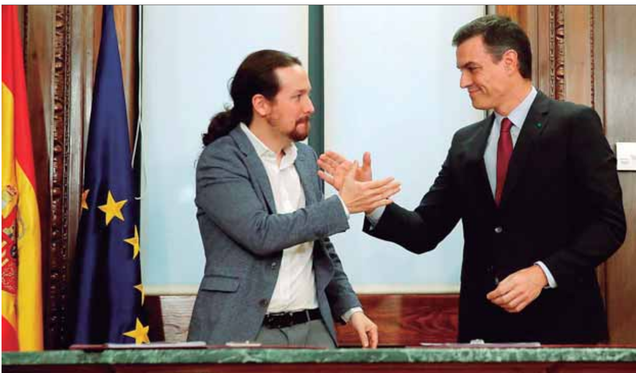
Pedro Sánchez i Pablo Iglesias encaixen les mans després de presentar el pacte al Congrés

FI • Els republicans donen per acabada la negociació i la duran al seu consell nacional dijous