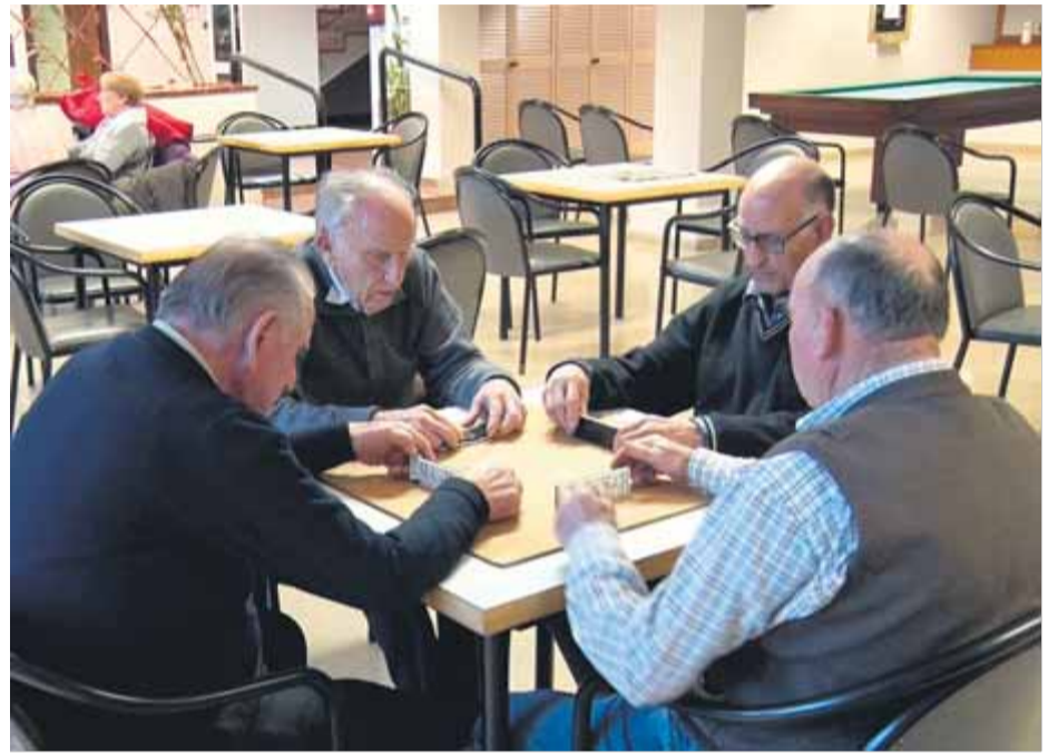
Pensionistes de Mollerussa, fent la partida diària, en una imatge d'arxiu

L'acord de govern suggereix que la derogació de la reforma laboral del 2012 (no de la reforma de l'època de José Luis Rodríguez Zapatero) serà completa, però s'han prioritzat punts com l'acomiadament per absentisme causat per baixes per malaltia, la recuperació de la ultraactivitat dels convenis (quan no s'han renovat), la limitació de les causes d'acomiadament i