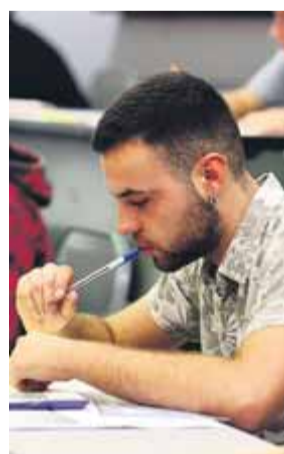
Un estudiant fent la selectivitat

tre els dos ministeris i amb la Generalitat. Reclamen que l'Estat no aprovi normatives que afectin els pressupostos universitaris sense aportar-hi recursos i, en definitiva, un millor finançament. Cal també que el ministeri faci efectiu el traspass pendent