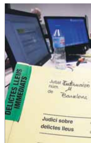
Un expedient de judicis ràpids per furt ■ J. RAMOS

als vuit que, assegura el Departament, s'ha gastat per posar en marxa els 14 aprovats el 2017. Catalunya va ser la primera autonomia a tenir competències de Justícia, però ara —sostenen— té pitjors condicions que la resta, malgrat que cada any l'Estat