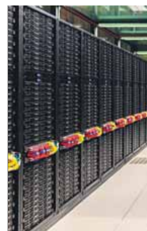
El superordinador 'Mare Nostrum' està en expansió ■

govern de l'Estat haurà de continuar mantenint el compromís amb el finançament de dues grans infraestructures científiques compartides entre la Generalitat i l'Estat que estan en ple creixement: el sincrotró Alba i el Barcelona Supercomputing Center. Finalment, el sector també considera un error haver revertit la decisió de crear un ministeri que reunís ciència amb innovació i universitats, que era una vella reclamació assolida per fi el 2018. ■