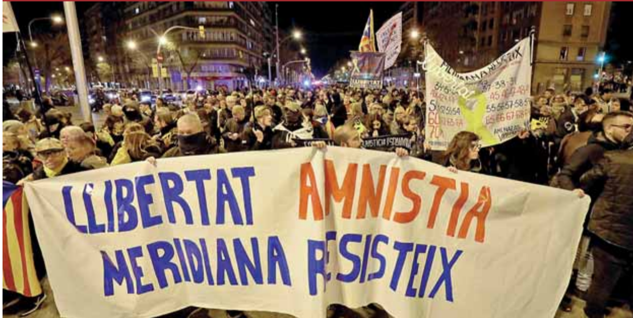
Centenars de ciutadans van recórrer la Meridiana de Barcelona entre Glòries i Sant Andreu ahir al vespre ■ JUANMA RAMOS