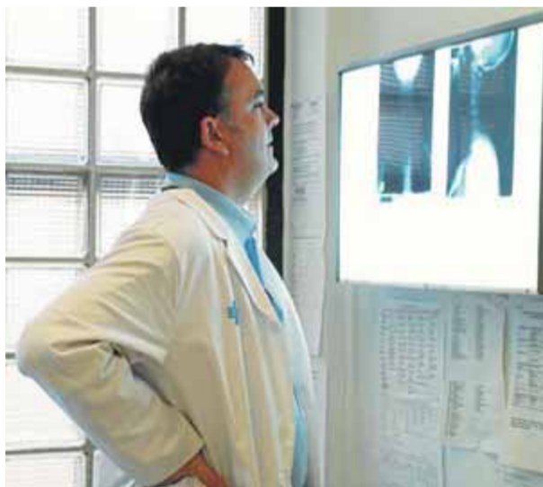
L'atenció primària és un dels sectors més castigat durant els darrers anys de retallades ■ M. MIRALLES

de sanitat les té transferides a les comunitats autònomes i té un greu problema d'infrafinançament i d'esgotament del personal i els recursos de la sanitat pública. Els professionals li reclamen principalment que inverteixi en el sistema estatal de salut fins a assolir nivells propis d'altres estats de la zona euro, fins a arribar a destinar-hi el 7% del PIB el 2023. Actualment, segons el sindi-