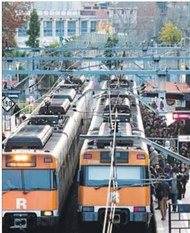
Els traspàs complet de rodalies és prioritari per al govern ■