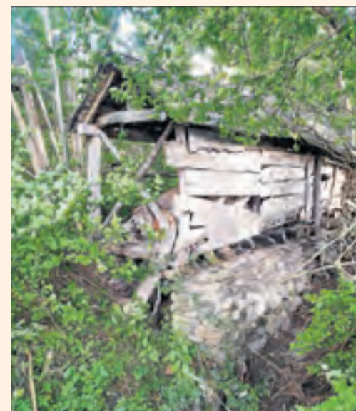
Una sitja a les valls d'Àneu. Sorpresa la que es va emportar la Roser, de Balaguer, de vacances.

Envia'ns la millor foto de les teues vacances a cercle@segre.com o puja-la al web fins a l'11 de setembre i entraràs al sorteig d'una estada familiar a PortAventura i altres fantàstics premis.