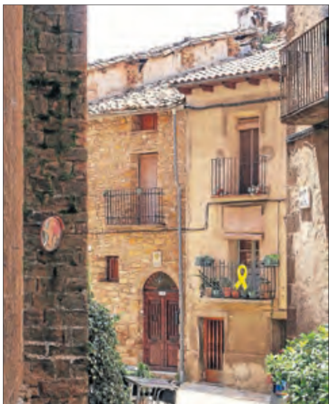
Talarn. Buscant pobles diferents pel Pallars Jussà, Talarn és preciós. @nurintn.