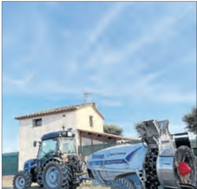
Anglesola. Cel esplèndid un dijous a la tarda en ple estiu. @blaicotrub.