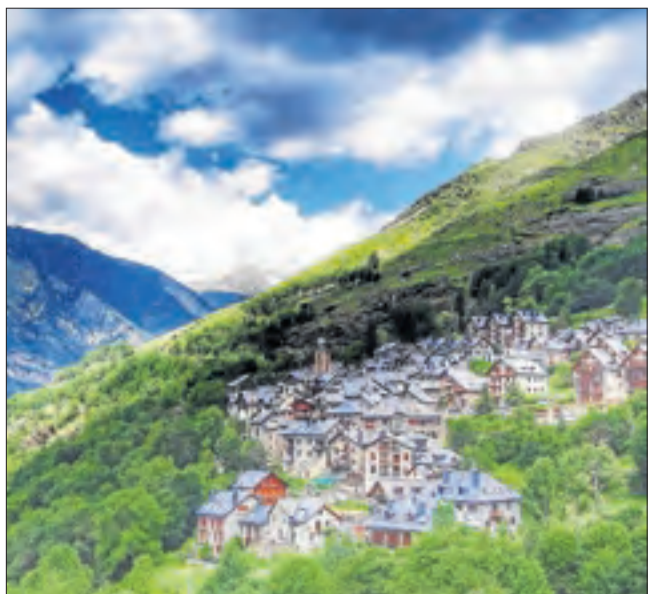
Taüll, a la Vall de Boí. Una bonica panoràmica d'un dels pobles més bonics de la Ribagorça. @romris.