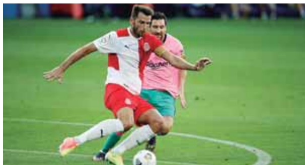
El Barça va vèncer el Girona (3-1) en l'amistós d'ahir ■ J. RAMOS