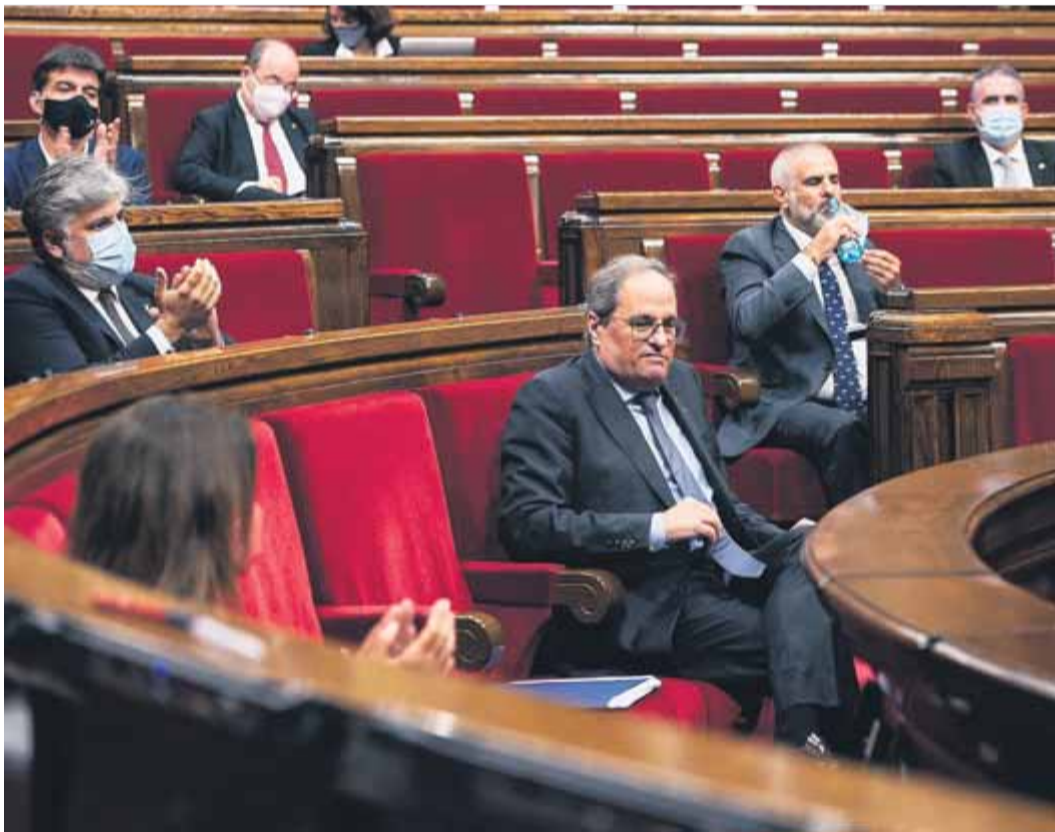
Un moment del ple, que es reprendrà divendres, quan Torra ja hagi comparegut al Suprem

La possible imminent inhabilitació de Torra centra la sessió