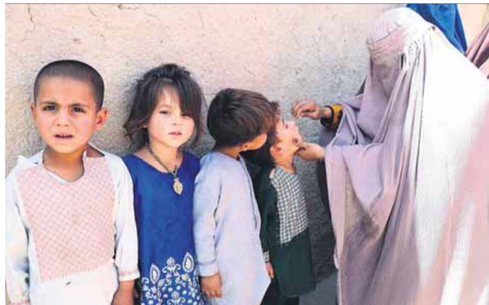
La Covid i els altres virus. Una sanitària, sota un burca, vacunant la canalla contra la poliomielitis a Kandahar (Afganistan), on la malaltia ha crescut durant les restriccions de la pandèmia