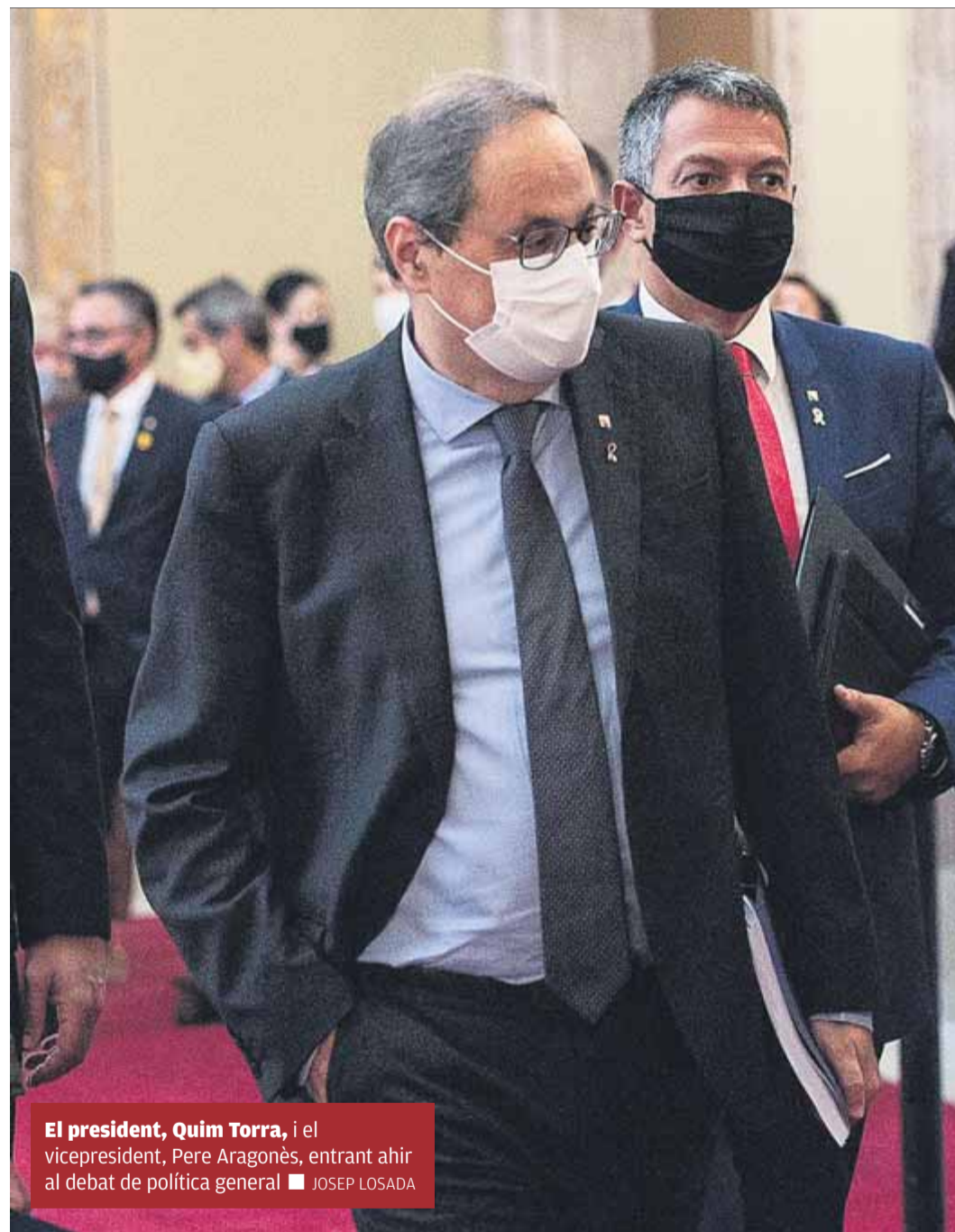
El president, Quim Torra, i el vicepresident, Pere Aragonès, entrant ahir al debat de política general

ERC va reclamar-li que pacti l'escenari postinhabilitació i no deixi les eleccions en mans del Suprem: "És imprescindible que ens posem d'acord, que no deixem la capacitat de decidir a un tribunal espanyol i aprofitem el marge que tenim per intervenir nosaltres." Malgrat mostrar una imatge d'unitat amb una foto conjunta del govern en solidaritat antirepressiva amb Torra abans de començar el debat, el cap de files dels republicans, Sergi Sabrià, va instar el president a acordar la reacció al marge de "càlculs electoralistes".