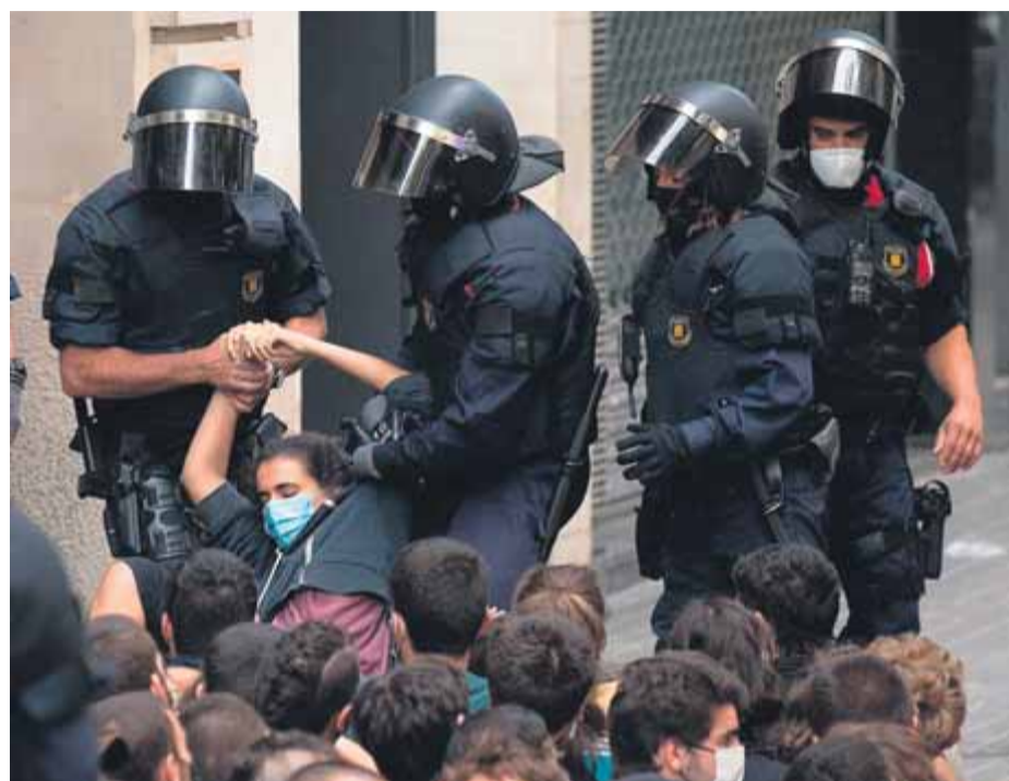
Agents dels Mossos amb una armilla que no permet veure la seva identificació professional, en una protesta per un desallotjament a Barcelona, el setembre passat

La identificació dels antiavalots és una reivindicació històrica de les ONG, ja que en alguns casos de mala praxi, com ara en les càrregues policials, l'agent s'ha lliurat d'una investigació judicial davant les dificultats per identificar-lo en imatges enregistrades. L'acord parlamentari va ser promogut per Amnis-