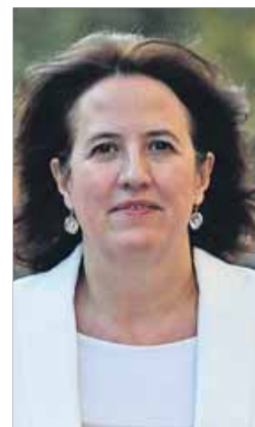
La presidenta de l'ANC, Elisenda Paluzie

La presidenta de l'Assemblea Nacional Catalana (ANC), Elisenda Paluzie, ha tramès una carta a la màxima responsable de la Comissió Europea, Ursula von der Leyen, en què li demana que l'organisme revisi el capítol de l'informe sobre l'estat de dret al continent, corresponent a l'any 2020, que fa referència a l'Estat espanyol. Concretament, l'ANC vol que s'inclouguin en aquest estudi les aportacions fetes per 14 institucions de la societat civil catalana –entre les quals hi ha la mateixa Assemblea o el Síndic de