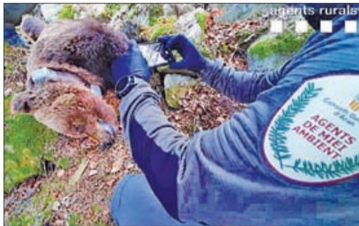
Imatge de l'os 'Cachou' mort el 9 d'abril del 2020

L'animal es va trobar sense vida el 9 d'abril, una mort que oficialment es va associar a una baralla amb un altre os. La jutgessa va decretar el secret d'actuacions del cas al maig. Entitats ecologistes van considerar poc creïbles les causes oficials de la mort d'aquest plantígrad i van