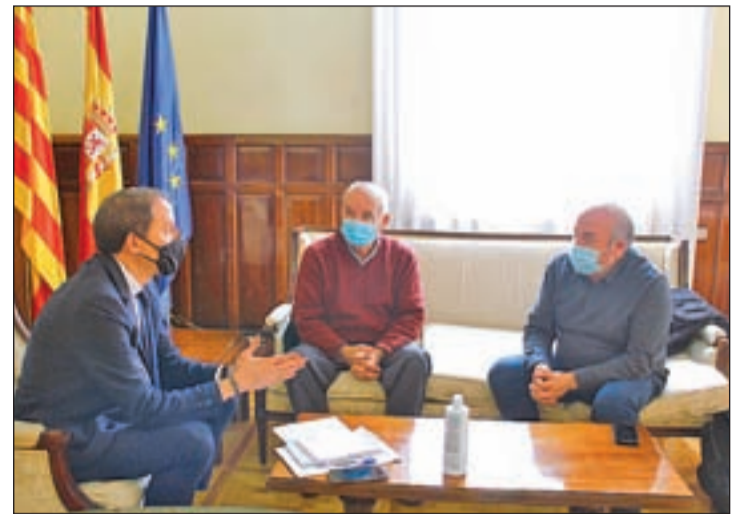
Moment de la reunió celebrada ahir

El més recent és Cachou que hauria mort enverinat en beure líquid anticongelant i l'altre plantígrad mort va ser durant el passat mes de juny a causa d'un o més trets a la zona francesa de Ariège, prop de l'estació d'esquí Guzet-Neige.