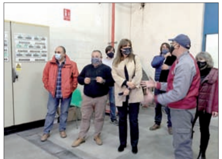
La candidata a les primàries durant la seva visita a Lleida

El Conselh Generau d'Aran posarà en funcionament aquests dies un nou servei al Banc d'Aliments per a dotar-lo setmanalment de productes frescos per a repartir entre les famílies que depenen del servei. La infraestructura necessària s'ha aconseguit també gràcies a l'adquisició per part de Mercadona d'un refrigerador.