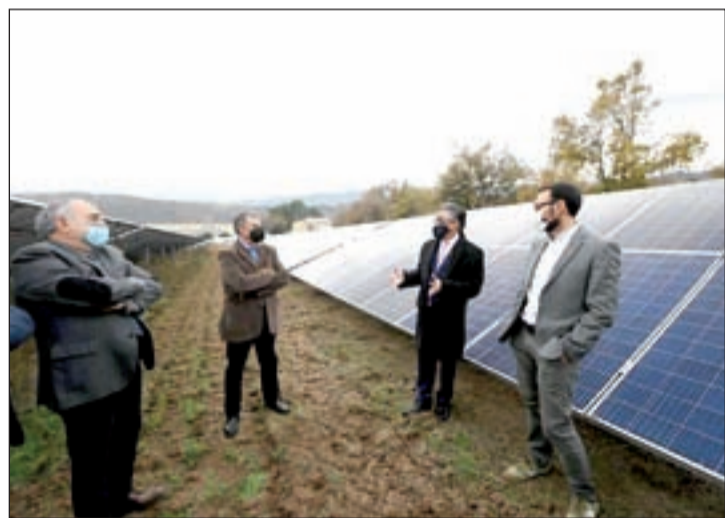
El conseller d'Empresa va visitar una planta a Espassera

Pel que fa a la reproducció en captivitat, durant la temporada de cria del 2020, s'ha constatat el naixement de fins a 74 polls al Centre de Cria de la trenca a Vallcalent, a Lleida, procedents de l'estoc captiu, gairebé com l'any anterior (71).