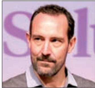
És l'actual portaveu a les Terres de Lleida