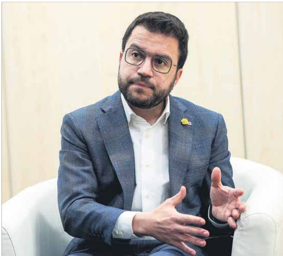
El candidat d'ERC, durant l'entrevista realitzada ahir a la seu del partit ■ JOSEP LOSADA

Nosaltres prenem les decisions per salvar vides, no per salvar vots. En un govern tot ell ha d'assumir les decisions, i jo ho he fet, amb àrees de consellers de JxCat en què potser n'hauria pres de diferents, però un go-