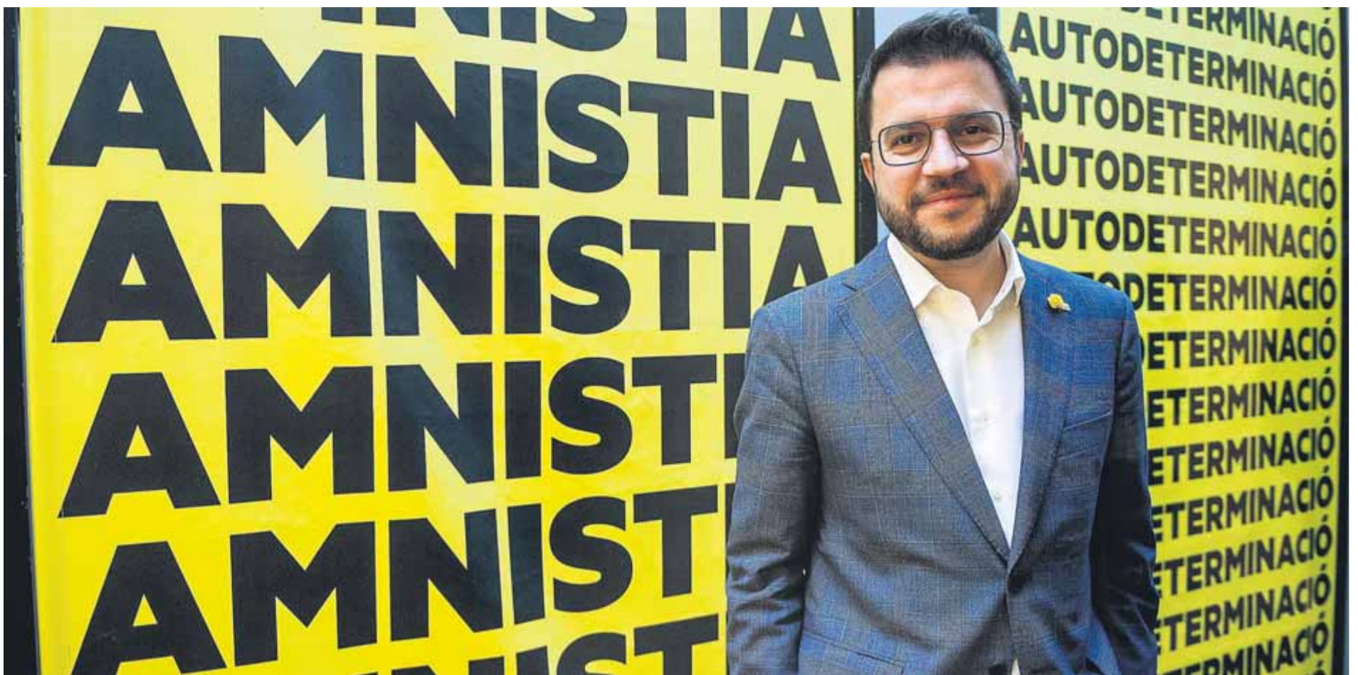
L'autodeterminació i l'amnistia són els dos grans "consensos de país" que Aragonès vol defensar liderant un front ampli al govern ■ JOSEP LOSADA