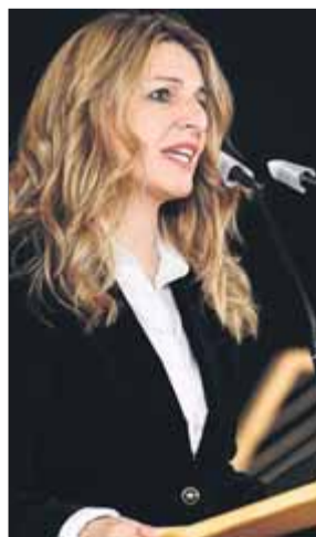
La ministra Díaz, durant l'acte electoral telemàtic a Tarragona

Ho va dir en un acte a Tarragona per parlar so-