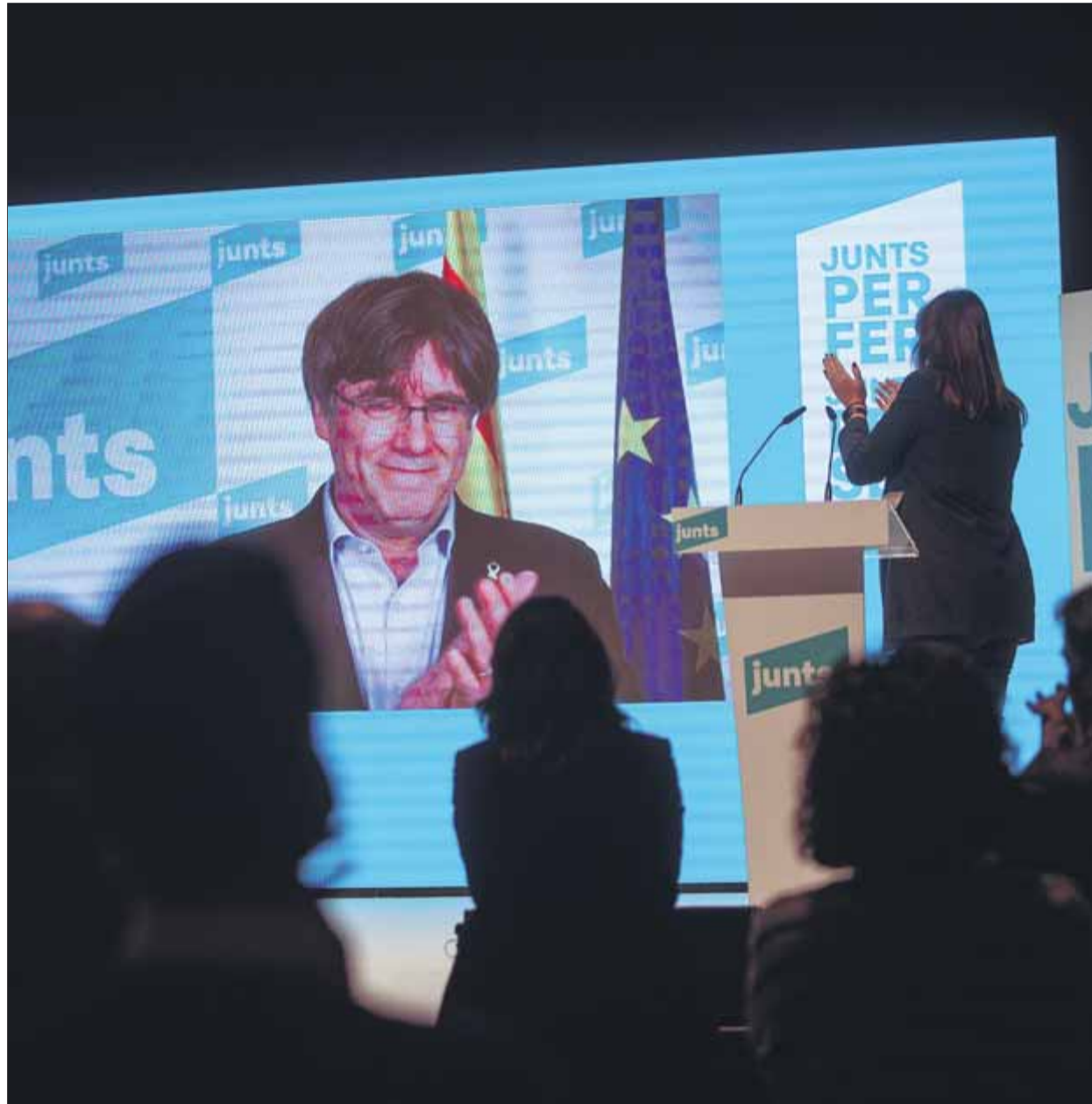
Puigdemont va intervenir telemàticament des de Waterloo en l’acte de campanya de Junts a Girona

La presidenciable de Junts, Laura Borràs, va alertar de la possibilitat d’un nou tripartit: “Diumenge només hi ha dues opcions, o un govern independentista o un tripartit”. Borràs va recalcar que, si és presidenta, “només pactarà amb partits independentistes” com a única via per assolir la independència del país, i va