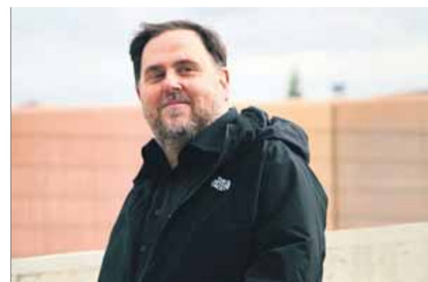
Oriol Junqueras, en una de les sortides de la presó

■ Sosté que era imprescindible que acatés la Constitució davant la JEC i que no podia ser candidat a les eleccions generals en tenir una condemna ferma